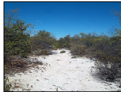
27 Caatinga Arbustiva