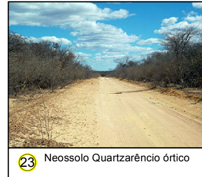
23 Neossolo Quartzarêncio órtico