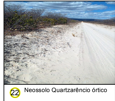
22 Neossolo Quartzarêncio órtico