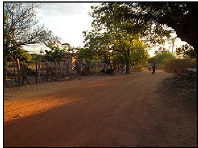
21 Comunidade Fundo de Pasto com território diretamente