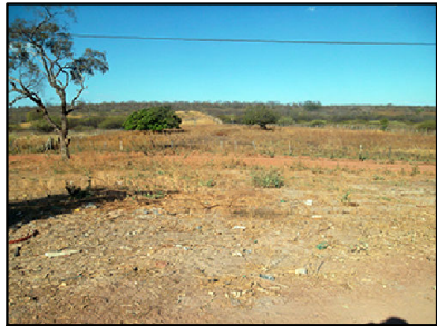
20 Acesso é interceptado muito próximo ao povoado