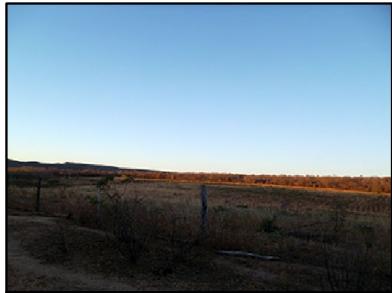
14 Superfícies Aplainadas Degradadas