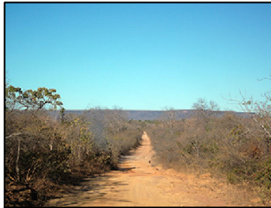
13 Superfícies Aplainadas Degradadas