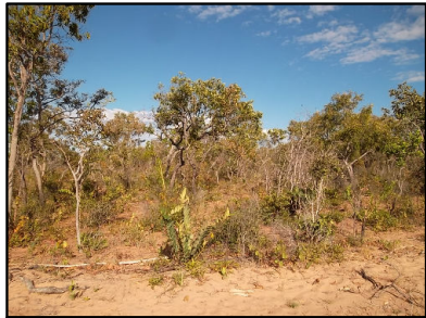
① Cerrado Sentido Restrito