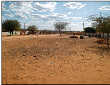
Comunidade Quilombola com território atravessado e acesso