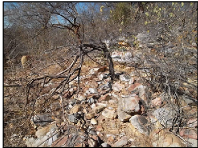
② Caatinga Arborizada