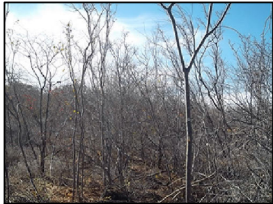
⑥ Caatinga Arborizada