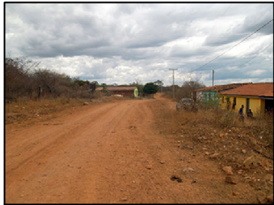
⑥ Acesso é interceptado muito próximo ao povoado