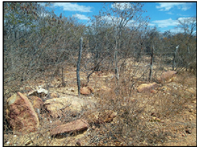
5 Afloramento de metarenito da Formação Mangabeira