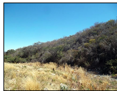
4 Caatinga Florestada