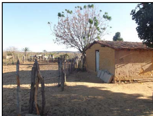
Figura 36: Entrevista com o Sr Antonio Caiçaras 2

Relata que não conhece lócas, grunas, furnas, sumidouros, cavernas, grutas, cavidades na localidade.