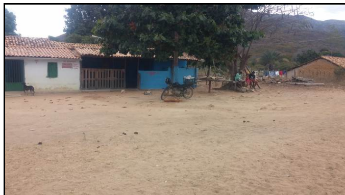
Figura 38: Entrevista com os demais em Santa Cruz