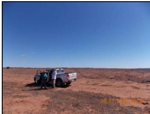
Figura 9: Entrevista com o Sr. Valdete em Espinheiro 1.

Relata a ocorrência de tocas numa baixa próximo ao local. Afirma que em seu terreno e nos adjacentes não ocorrem tocas , nem furnas , nem sumidouros .