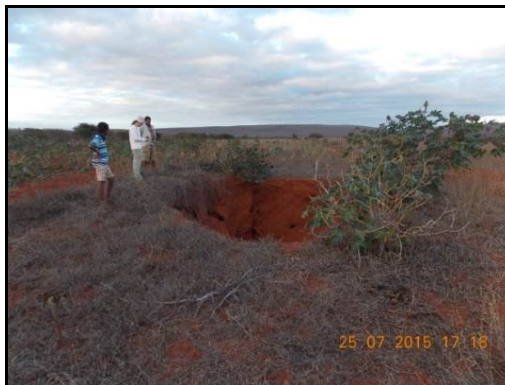
Figura 4: Entrevista com o Sr. Manoel em Escondido.

Relata a ocorrência de buracos (Dolinas) na plantação.