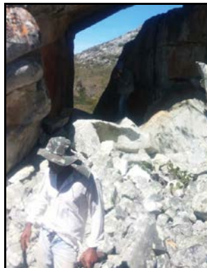
Figura 39: Entrevista Senhor Abel, em Mangabeira.

Relata que conhecer apenas uma cavidade na região que conhece muito bem e vive há mais de 65 anos. É um abrigo com pinturas rupestres que também foi vistoriado pela equipe e a ficha de número 13200.