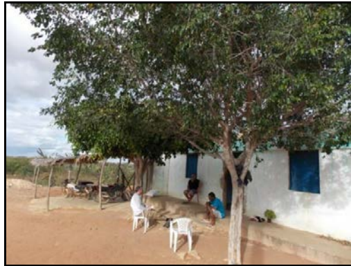
Figura 2: Entrevista com o Sr. Edilson em Jitirana.