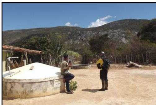
Figura 34: Entrevista com o Sr Neto em Achuré.

Relata não conhecer lócas, grunas, furnas, sumidouros , na localidade. Contudo apontou para um ponto de nascente de água que ele indicou na Serra do Achuré aproximadamente 1,5km de sua residência. A “gruna” foi vistoriada e não é caracterizada como cavidade, são blocos abatidos no terço inferior da serra. Disse que na região toda não há mais cavidades.