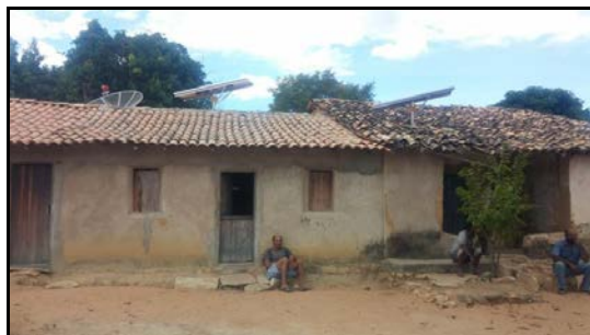
Figura 40: Entrevista Senhor José Genivaldirson, em Colônia de Cima.

Relata não conhecer lôcas, grunas, furnas, sumidouros , etc na localidade. Relatou apenas um abrigo denominado gruta dos Patis, com pintura rupestre, localizado em lagoa nova a aproximadamente 16 km da área de estudo e no sopé da Serra dos Cristais.