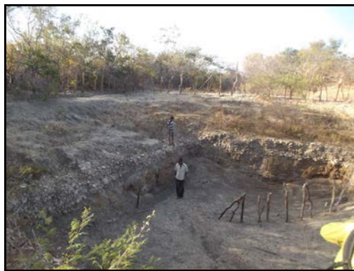
Figura 35: Entrevista com o Sr Tonho em Alagadiço.

Relata não conhecer lócas, grunas, furnas, sumidouros, cavernas, acidades na localidade. Levou a equipe a um local de retirada de água que não se configura cavidade.