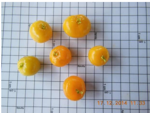
Foto 27 - Sementes de Pitomba, Talisia esculenta (Cambess.) Radlk. em processo de beneficiamento.