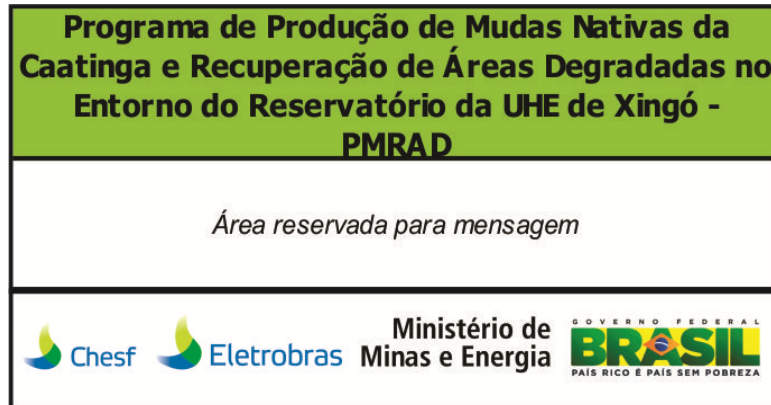
Figura 3 - Modelo de placa elaborada pela Chesf para implantação nas áreas degradadas no entorno da UHE de Xingó.

A localização da placa no campo e o conteúdo da mensagem serão definidos com a aprovação da Divisão de Meio Ambiente de Geração - DEMG. Além disso, será realizada a manutenção ou substituição das placas a cada 6 (seis) meses. Na Figura 3 consta um modelo de Placa elaborada pela CHESF para implantação nas áreas degradadas no entorno da UHE de Xingó.