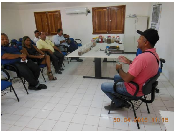
Foto 49 - Visita dos representantes das Colônias de Pescadores ao Viveiro Florestal Xingó.