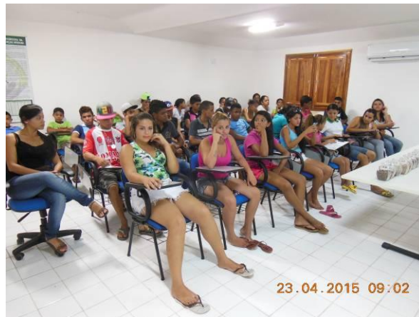
Foto 48 - Visita da SCFV ao Viveiro Florestal Xingó.