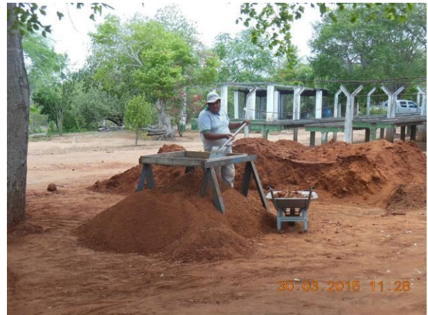
Foto 68 - Peneiramento de solo para uso no plantio e produção de mudas.