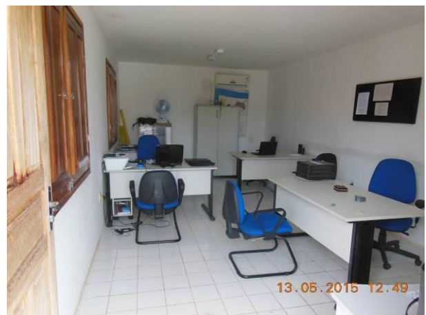
Foto 70 - Área do escritório no Viveiro Florestal na UHE Xingó.