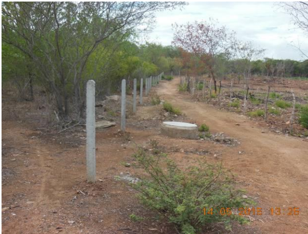
Foto 83 - Vista geral da implantação de mourão e estacas de concreto para cercamento da área de reserva próximo ao Viveiro.