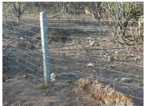
Foto 86 - Vista geral da cerca de concreto finalizada na área de reserva próximo ao Viveiro.