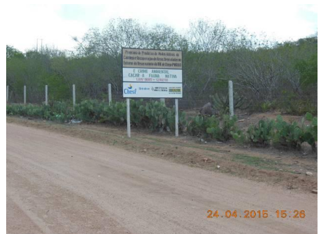
Foto 88 - Placa de sinalização localizada na Área 08 em boas condições de conservação.