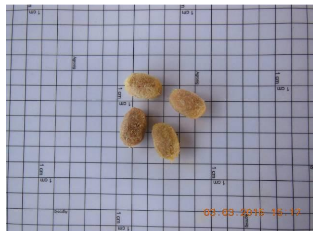
Foto 14 - Detalhe das sementes de Umbú, Spondias tuberosa Arruda Cam. beneficiada.