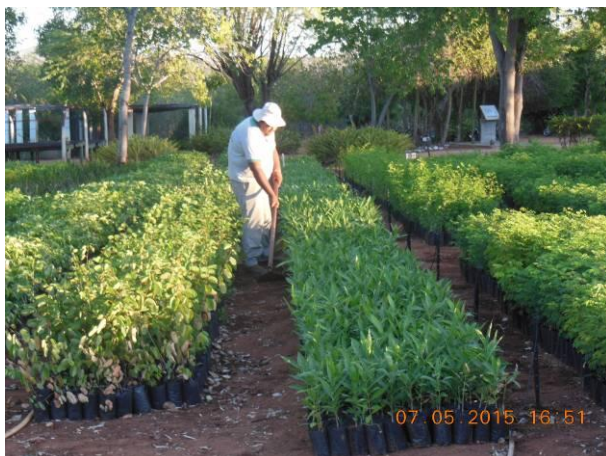
Foto 71 - Equipe da AGROSIG realizando a limpeza na área do Viveiro Florestal na UHE Xingó.