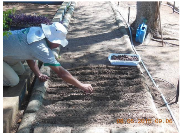
Foto 62 - Vista da semente de Ouricuri, Syagrus coronata (Mart.) Becc. em areia lavada para posterior repicagem.

Após a germinação das sementes, foi iniciada a repicagem das mudas para os demais sacos plásticos de transporte deixando apenas uma muda por embalagem. Esta etapa de repicagem das mudas para os recipientes que possibilitem o acondicionamento e transporte até o local definitivo é uma operação delicada e deve ser executada com todo o cuidado.