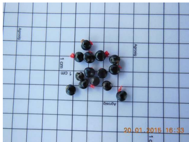
Foto 40 - Detalhe das sementes Espinheiro preto, Pithecellobium diversifolium Benth beneficiada.