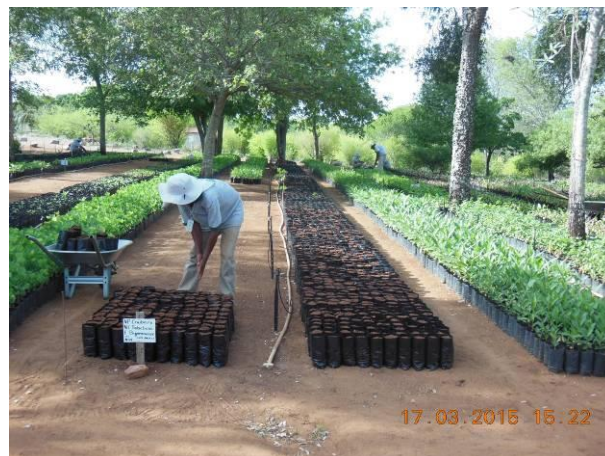
Foto 72 - Serviço de encanteiramento dos sacos plásticos para produção de mudas.