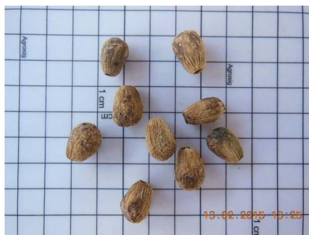
Foto 26 - Detalhe das sementes Salgueiro, Vitex gardneriana Shauer beneficiada.