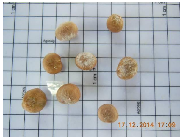
Foto 28 - Detalhe das sementes Pitomba, Talisia esculenta (Cambess.) Radlk. beneficiada.