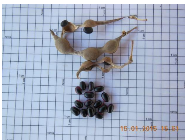
Foto 37 - Sementes de Mulungu preto, Erythrina sp. em processo de beneficiamento.