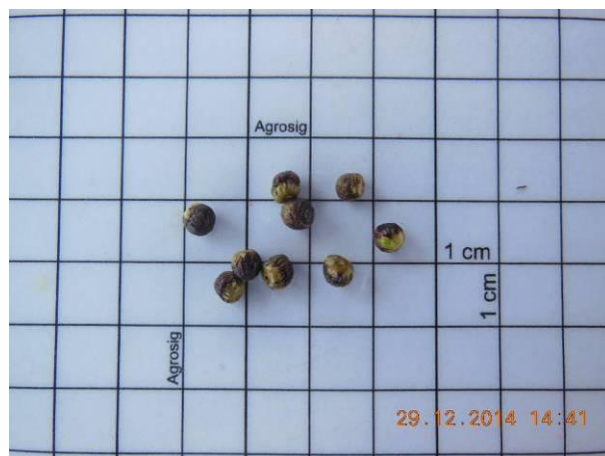
Foto 32 - Detalhe das sementes Aroeira, Myracrodruon urundeuva Allemão beneficiada.