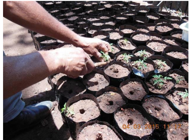
Foto 64 - Mudanças de Aroeira, Myracrodruon urundeuva Allemão em processo de repicagem.

Após a repicagem estas mudas foram e outras ainda serão acomodadas em local sombreado para evitar temperaturas elevadas e a desidratação pelas plantas. Para tanto, são realizadas regas suaves e frequentes. Passados aproximadamente 15 dias após a repicagem será realizada o início da retirada do abrigo, aumentando gradualmente a incidência de sol sobre as mudas até a completa adaptação ao ambiente.