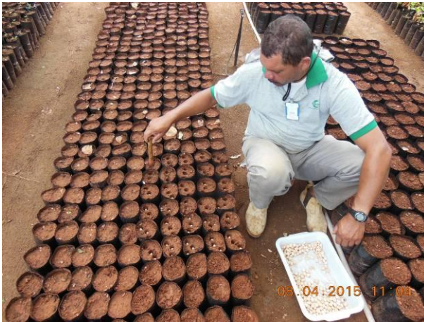
Foto 59 - Vista do processo de plantio de sementes de Umbu, Spondias tuberosa Arruda Cam..