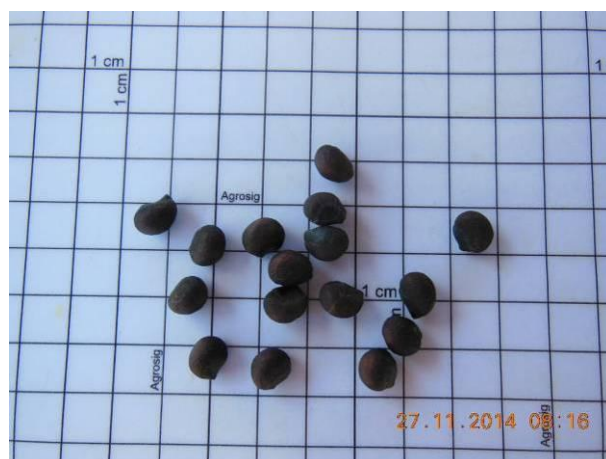
Foto 16 - Detalhe das sementes de Barriguda do sertão, Ceiba glaziovii K. Schum. Ex Chod. & Hassl beneficiada.