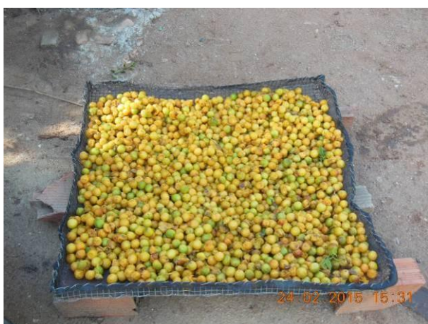
Foto 7 - Detalhe das sementes de Umbú, Spondias tuberosa Arruda Cam. em processo de beneficiamento.