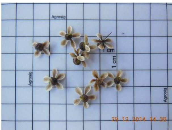
Foto 31 - Sementes de Aroeira, Myracrodruon urundeuva Allemão em processo de beneficiamento.