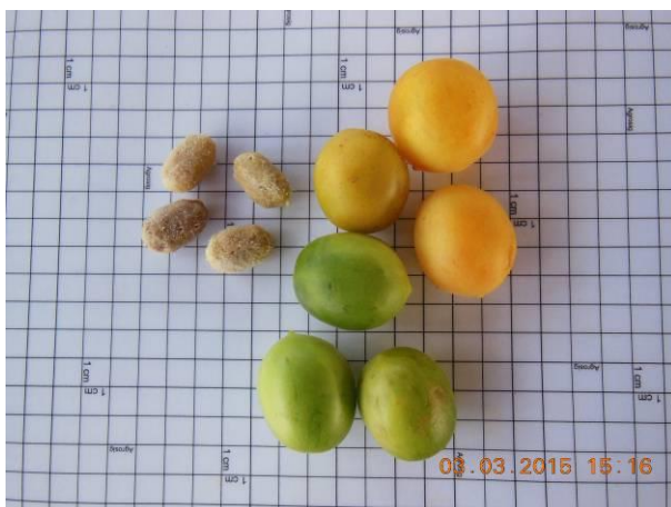
Foto 13 - Sementes de Umbú, Spondias tuberosa Arruda Cam. em processo de beneficiamento.