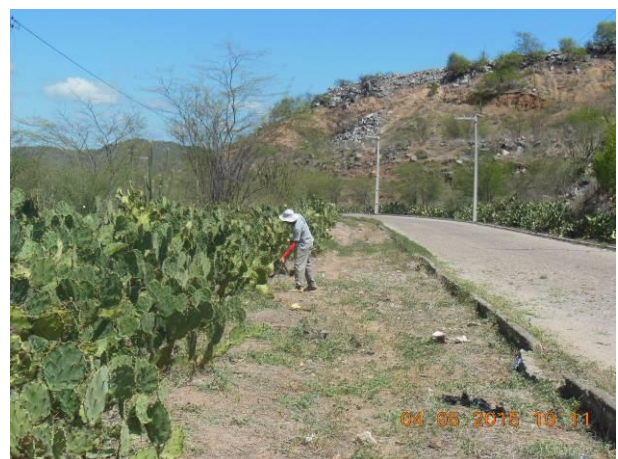
Foto 54 - Limpeza e roço das margens do acesso próximo a guarita.