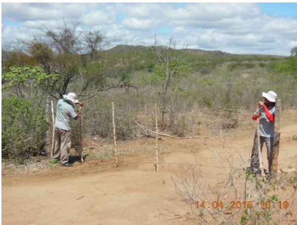
Foto 75 - Manutenção do colchete na Área 06.