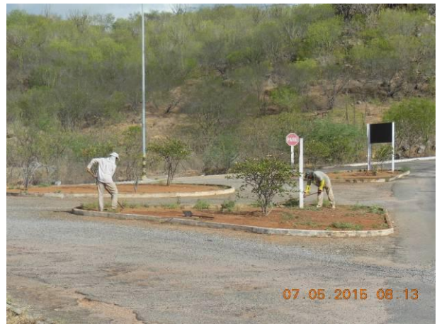
Foto 56 - Limpeza e roço trevo de acesso ao a estação 500kw.