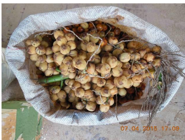
Foto 5 - Equipe da AGROSIG beneficiando sementes Ouricuri, Syagrus coronata (Mart.) Becc.