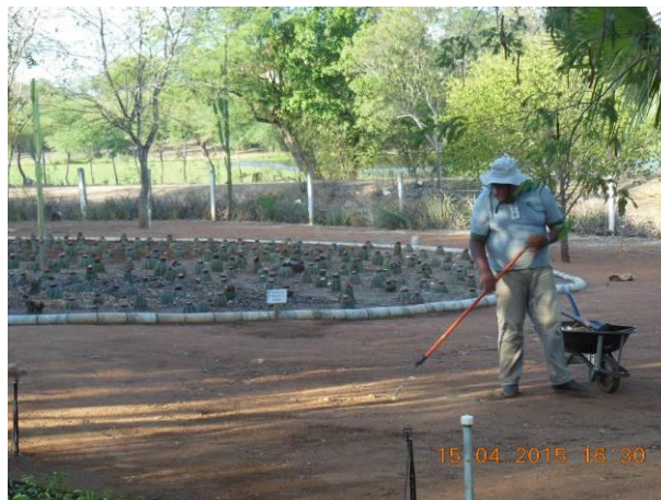
Foto 66 - Limpeza na área interna viveiro e utilização da material vegetal para o composto.