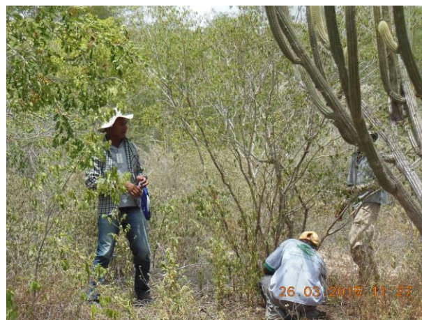
Foto 2 - Equipe da AGROSIG realizando a coleta de sementes da matriz M53 de Araçá no campo.