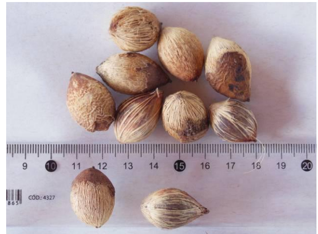
Foto 10 - Detalhe das sementes de Ouricuri, Syagrus coronata (Mart.) Becc. beneficiada.