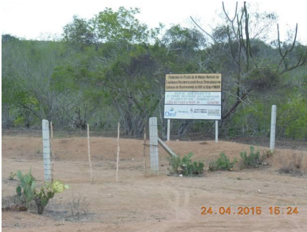
Foto 89 - Placa de sinalização localizada na Área 11 em boas condições de conservação.