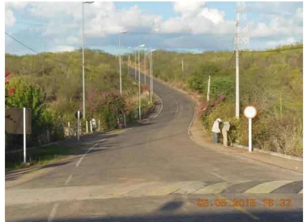
Foto 52 - Limpeza nas margens da estrada de acesso a área superior da barragem.