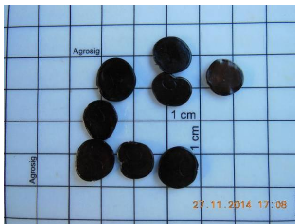
Foto 20 - Detalhe das sementes de Angico de caroço, Anadenanthera colubrina (Vell.) Brenan beneficiada.