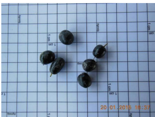
Foto 41 - Sementes de Quixabeira, Sideroxylon obtusifolium (Roem. & Schult.) Penn. em processo de beneficiamento.