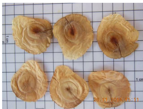
Foto 18 - Detalhe das sementes de Pereiro, Aspidosperma multiflorum A. DC. beneficiada.