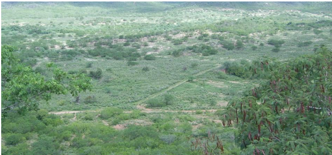
Foto 44 - Registro fotográfico das Áreas 6, 7 e 8 no mês de maio de 2014 período intermediário ao final das chuvas.