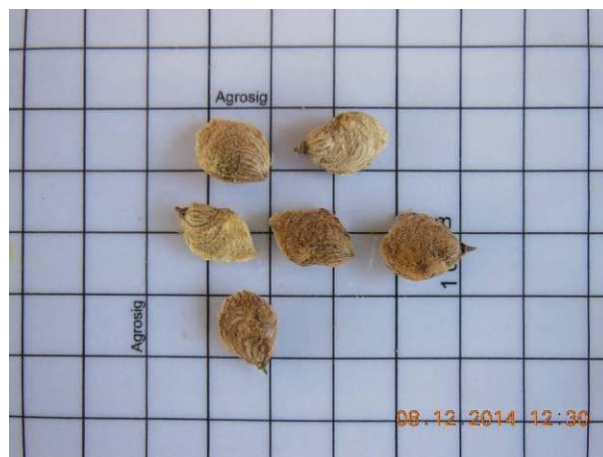
Foto 22 - Detalhe das sementes de Braúna, Schinopsis brasiliensis Engl. beneficiada.