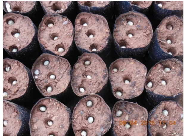
Foto 60 - Detalhe da semente de umbu, Spondias tuberosa Arruda Cam. com 03 sementes por saco.