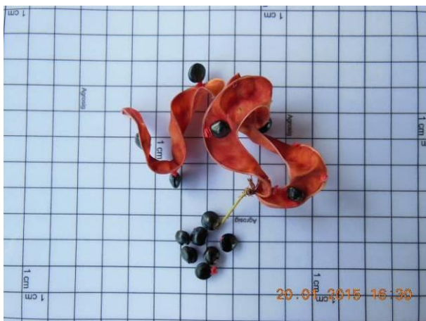
Foto 39 - Sementes de Espinheiro preto, Pithecellobium diversifolium Benth em processo de beneficiamento.