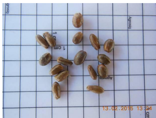
Foto 42 - Detalhe das sementes Quixabeira, Sideroxylon obtusifolium (Roem. & Schult.) Penn. beneficiada.

No período compreendido entre os meses de fevereiro a maio foram realizadas diversas expedições para a coleta de sementes porém, em alguns casos, não foi possível a realização da coleta devido às sementes estarem em estágio imaturo para beneficiamento. Desta forma, constam descritas no Quadro 2, a seguir, as espécies coletadas para o período.