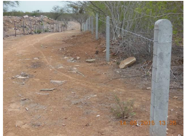
Foto 84 - Outro detalhe da implantação de mourão e estacas de concreto para cercamento da área de reserva próximo ao Viveiro.