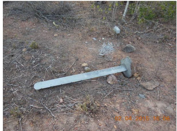
Foto 74 - Substituição de estaca e manutenção da cerca nas proximidades do Viveiro Florestal de Xingó.