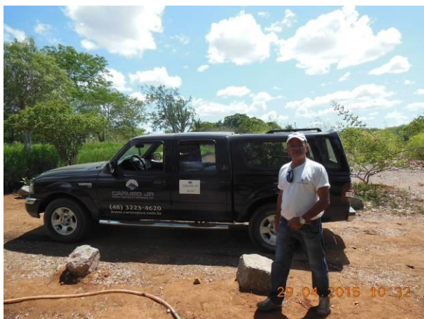
Foto 79 - Doação a empresa Caruso Engenharia.