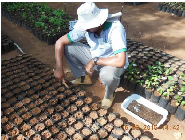
Foto 61 - Vista do processo de plantio de Pau ferro, Libidibia ferrea Mart. Ex Tul. L. P. Queiroz.