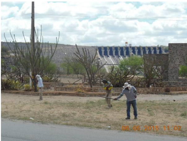
Foto 55 - Limpeza e roço das margens do acesso área do aterro.