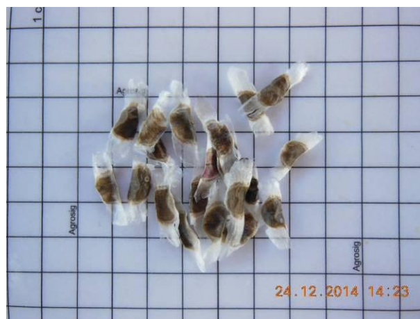
Foto 30 - Detalhe das sementes de Ipê Roxo, Tabebuia impetiginosa (Mart. ex DC.) Standl. beneficiada.