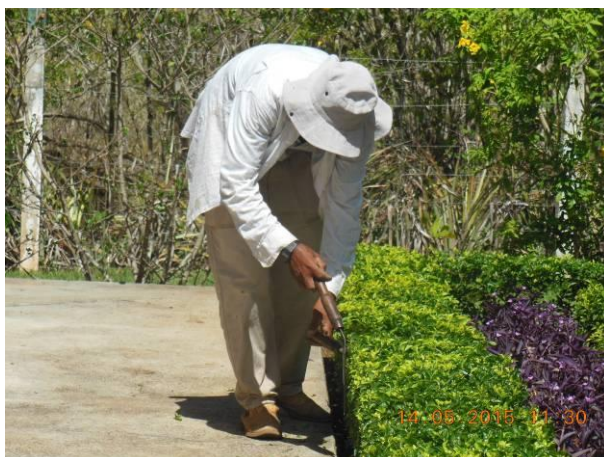
Foto 69 - Manutenção do jardim no Viveiro Florestal na UHE Xingó.