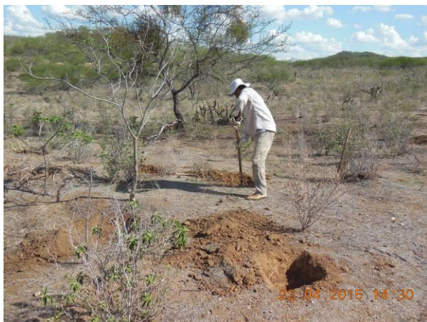
Foto 45 - Equipe da Agrosig realizando a abertura de covas na área degradada 06.