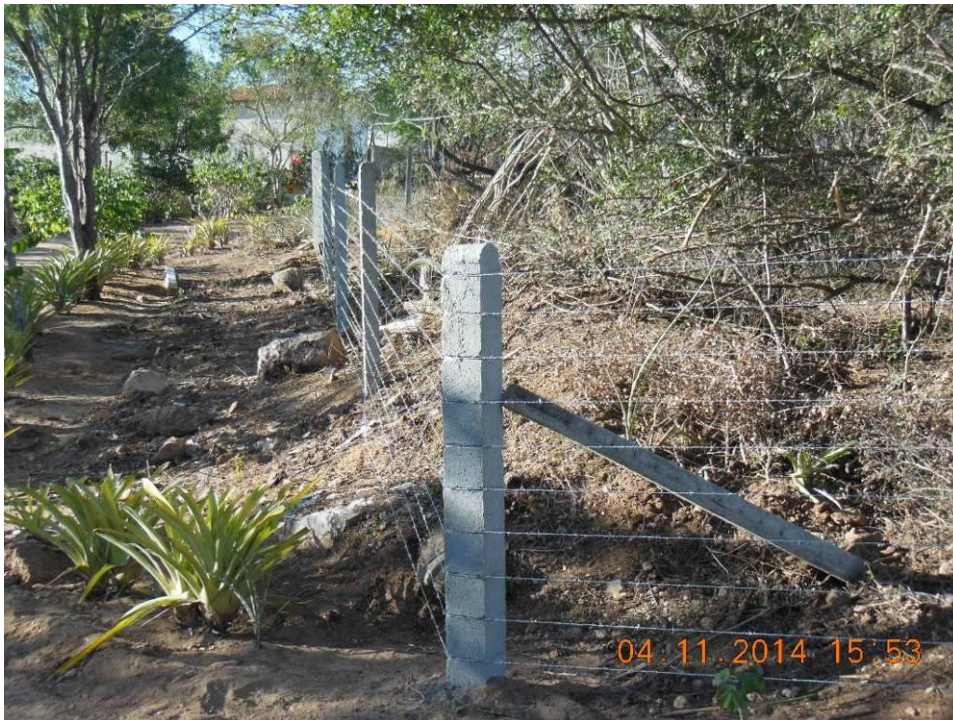
Foto 81 - Modelo e dimensões de cerca com 1,6 metro de altura, com mourões de concreto de 15 cm de diâmetro e estacas de concreto com 10 cm de diâmetro e espaçamento de 5x5 m, com 10 fios de arame farpado classe 250.

O cercamento das áreas dar-se-á no perímetro, em toda a extensão da área degradada com vistas a proteger as mudas do plantio e evitar a entrada de animais que podem causar prejuízos sérios pela herbívora da vegetação introduzida, queda do animal e, até mesmo, pelo pisoteio. Na Foto 81 pode-se observar o modelo de cerca com 10 fios, proposto para a proteção da vegetação nas áreas conforme supracitado.