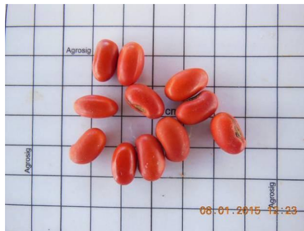
Foto 34 - Detalhe das sementes Mulungu, Erythrina velutina Willd. beneficiada.