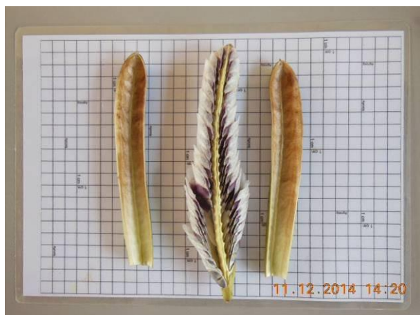
Foto 23 - Sementes de Craibeira, Tabebuia aurea (Silva Manso) Benth. & Hook.f. em processo de beneficiamento.