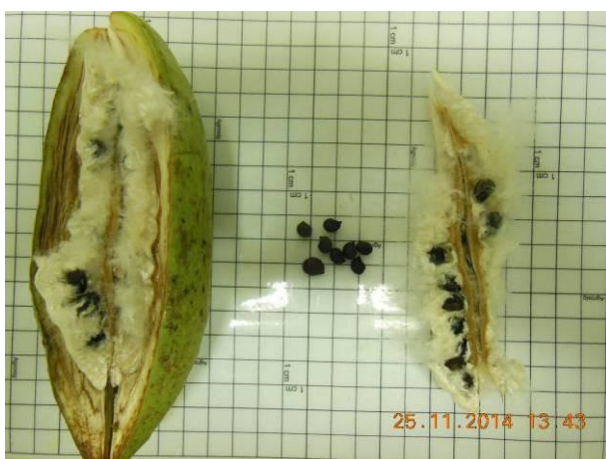
Foto 15 - Sementes de Barriguda do sertão, Ceiba glaziovii K. Schum. Ex Chod. & Hassl em processo de beneficiamento.