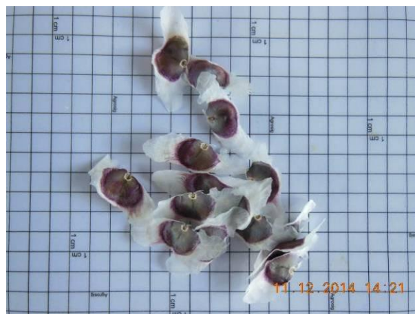
Foto 24 - Detalhe das sementes Craibeira, Tabebuia aurea (Silva Manso) Benth. & Hook.f. beneficiada.