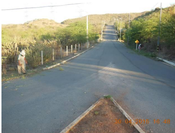
Foto 53 - Limpeza e roço das margens do acesso próximo ao museu.