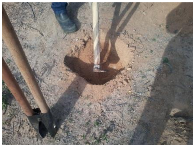
Foto 82 - Exemplo proposto para o coveamento manual com a utilização de cavadeira.

A construção de cercas iniciou na área de reserva no entorno do viveiro florestal. Esta área tem aproximadamente 50 hectares sendo o perímetro de 1.675 metros.