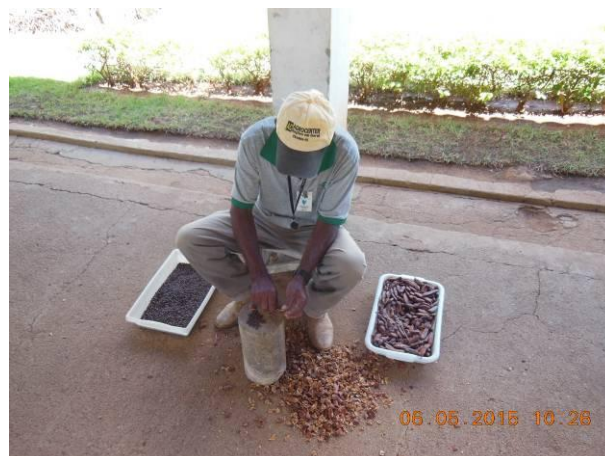
Foto 4 - Equipe da AGROSIG realizando o beneficiamento das sementes de Mulungu, Erythrina velutina Willd..