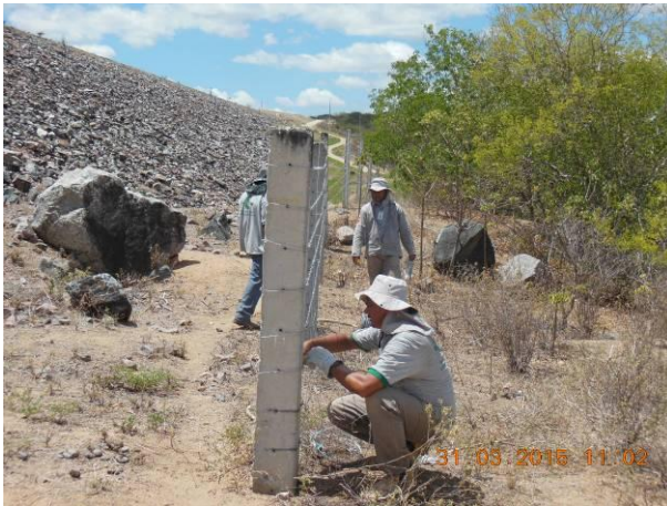
Foto 73 - Manutenção do arame da cerca de concreto existente nas proximidades da dique IV.