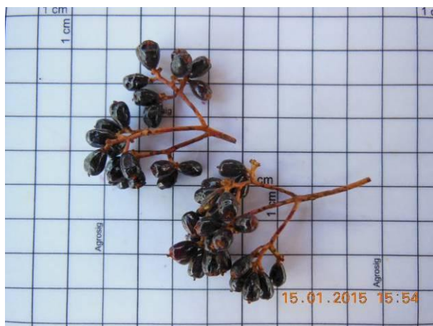
Foto 35 - Sementes Pau piranha, Guapira laxa (Netto) Furlan em processo de beneficiamento.