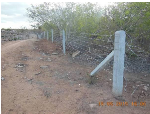
Foto 85 - Etapa de lançamento dos fios de arame farpado e fixação dos mesmos com arame liso nº16 e 18 área de reserva próximo ao Viveiro.