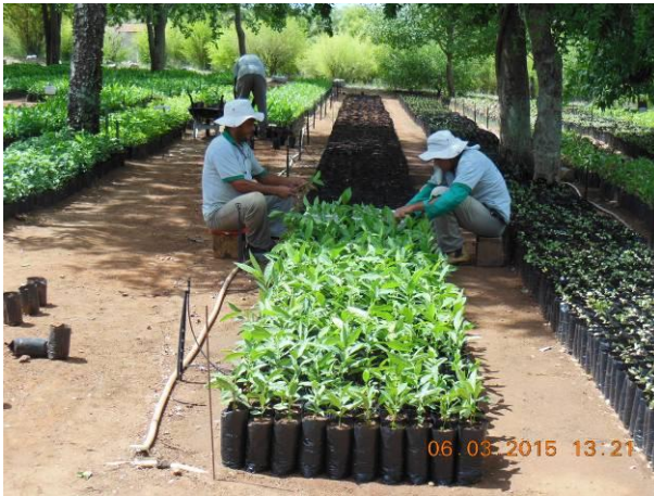
Foto 63 - Mudanças de Craibeira, Tabebuia aurea (Silva Manso) Benth. & Hook.f. ex S em processo de repicagem.