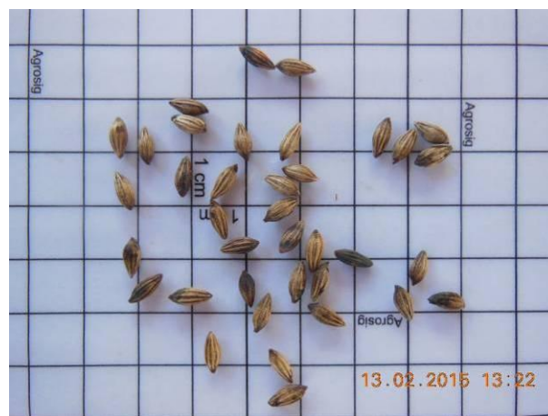
Foto 36 - Detalhe das sementes Pau piranha, Guapira laxa (Netto) Furlan beneficiada.