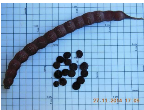
Foto 19 - Sementes de Angico de caroço, Anadenanthera colubrina (Vell.) Brenan em beneficiamento.