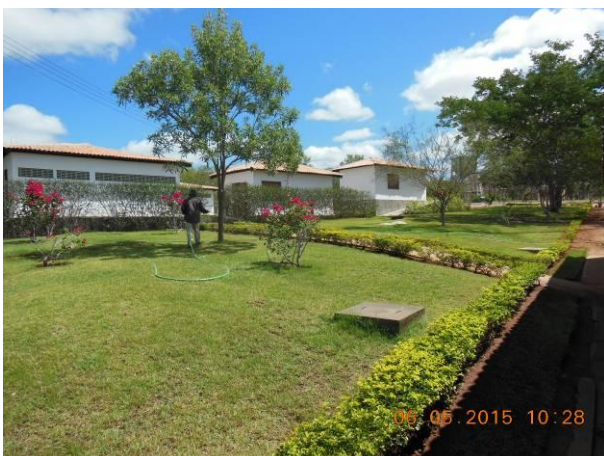
Foto 57 - Manutenção e Irrigação nos jardins do Viveiro Florestal.