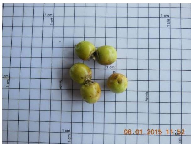
Foto 25 - Sementes de Salgueiro, Vitex gardneriana Shauer em processo de beneficiamento.