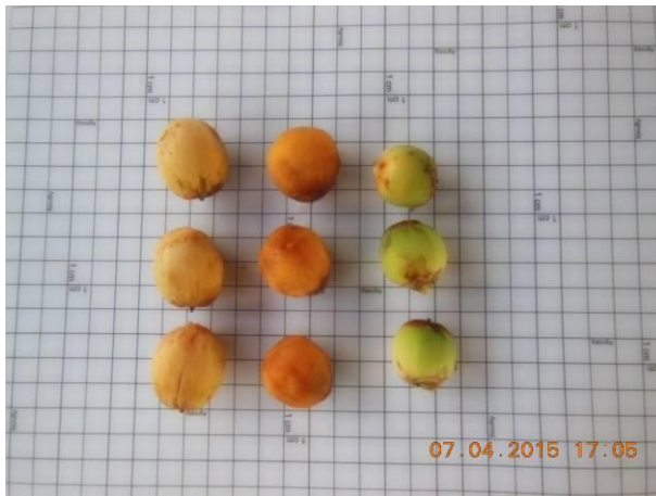
Foto 9 - Sementes de Ouricuri, Syagrus coronata (Mart.) Becc. em processo de beneficiamento.