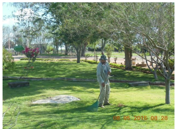
Foto 58 - Retirada de ervas daninhas e limpeza nos jardins do Viveiro Florestal.