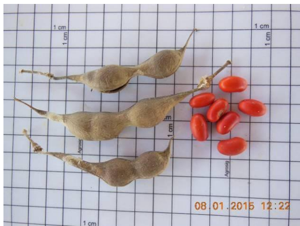
Foto 33 - Sementes de Mulungu, Erythrina velutina Willd. em processo de beneficiamento.