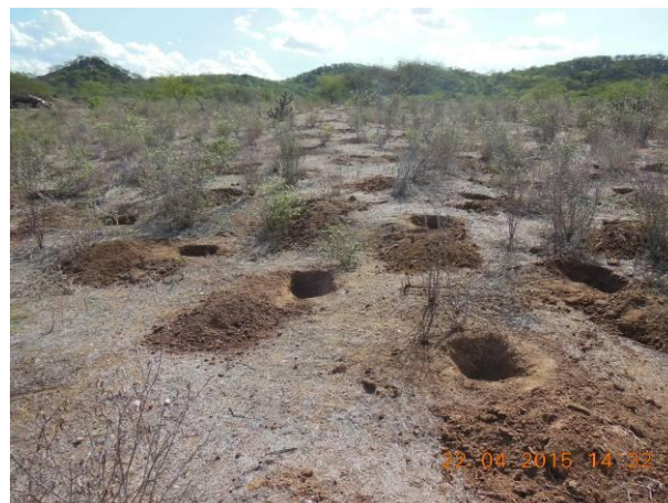
Foto 46 - Detalhe do coveamento 40x40x40 cm iniciado na área 06 para plantio e adensamento.