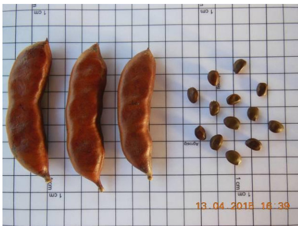
Foto 11 - Sementes de Pau ferro, Libidibia ferrea Mart. Ex Tul. L. P. Queiroz em processo de beneficiamento.