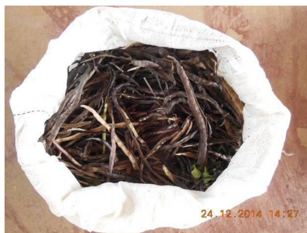
Foto 8 - Detalhe das sementes de Ipê Roxo, Tabebuia impetiginosa (Mart. ex DC.) Standl. em beneficiamento.