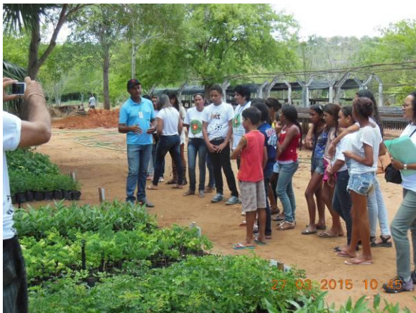
Foto 47 - Visita do Instituto Plano de Ação Socioambiental - PAS ao Viveiro Florestal Xingó.

Na oportunidade, os visitantes conheceram também algumas áreas degradadas em trabalhos de recuperação no entorno da UHE de Xingó proporcionando uma atividade prática de plantio de espécies nativa no local conforme o registro fotográfico a seguir (Foto 47 até a Foto 50).