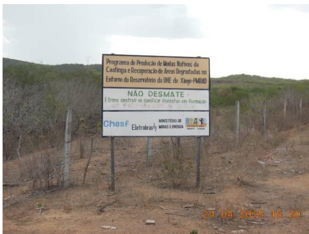
Foto 87 - Placa de sinalização localizada no acesso ao Dique IV em boas condições de conservação.

A seguir na Foto 87 até a Foto 90 constam os registros fotográficos da vistoria das placas de sinalização realizada nas áreas degradadas do entorno da UHE de Xingó.