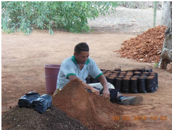
Foto 67 - Equipe da AGROSIG realizando enchimento dos sacos para plantio de mudas na área do Viveiro Florestal na UHE Xingó.

A seguir no conjunto de registros abrangidos pela Foto 67 até a Foto 72 observam-se os locais onde foram efetuados os serviços de manutenção e limpeza.