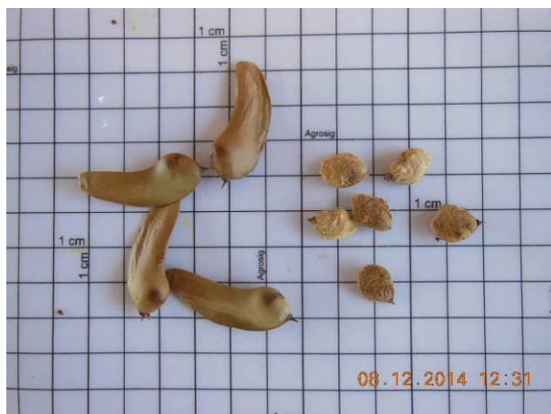
Foto 21 - Sementes de Braúna, Schinopsis brasiliensis Engl. em beneficiamento.