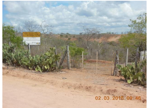
Foto 90 - Placa de sinalização localizada na Clareira 06 em boas condições de conservação.