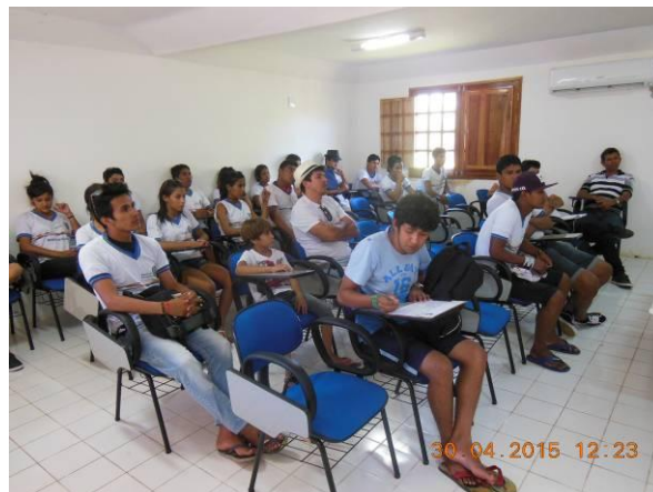
Foto 50 - Visita da Escola Indígena Fulni-ô ao Viveiro Florestal de Xingó.