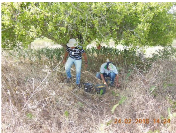
Foto 1 - Equipe da AGROSIG realizando a coleta de sementes da matriz M50 de Umbuzeiro no campo.

A seguir no conjunto de registros que consta da Foto 1 até a Foto 42 observam-se detalhes das etapas realizadas para a coleta e beneficiamento de sementes no Viveiro Florestal.