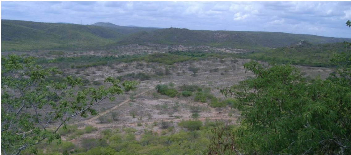
Foto 43 - Registro fotográfico das Áreas 6, 7 e 8 no mês de março de 2014 período de início das chuvas.