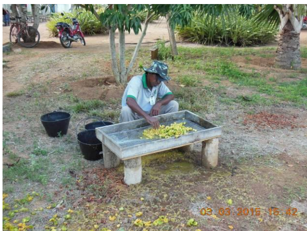
Foto 3 - Equipe da AGROSIG realizando o beneficiamento das sementes de Umbú, Spondias tuberosa Arruda Cam..