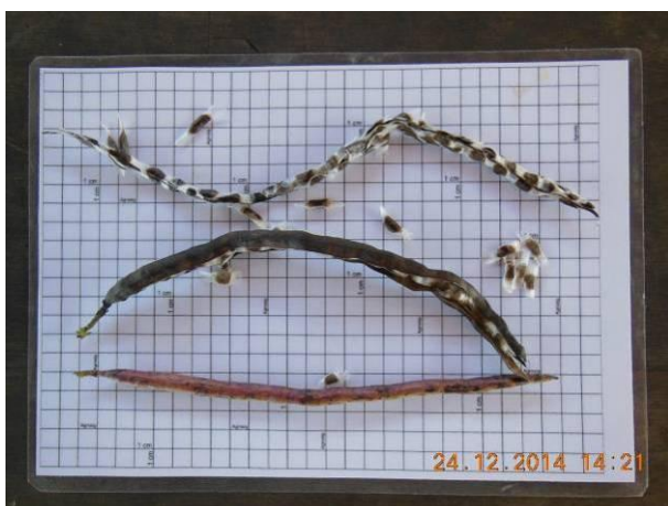
Foto 29 - Sementes de Ipê Roxo, Tabebuia impetiginosa (Mart. ex DC.) Standl. em processo de beneficiamento.