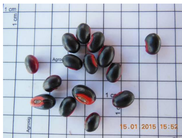
Foto 38 - Detalhe das sementes Mulungu preto, Erythrina sp. beneficiada.