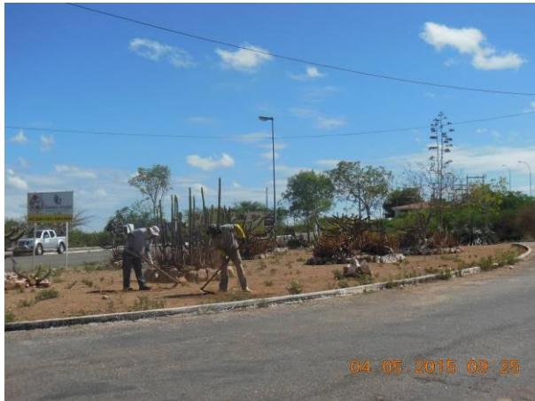
Foto 51 - Limpeza e plantio de espécies no trevo norte sul próximo da área administrativa da CHESF.

Foram realizadas a roçagem as margens do acesso ao longo dos 18 quilômetros existentes. Foram realizados irrigações, capinações, coroamentos e plantios de cactáceas, bromeliáceas e demais plantas ornamentais a fim de melhorar aspectos visuais do acesso ao Viveiro conforme Foto 51 a Foto 58 a seguir.