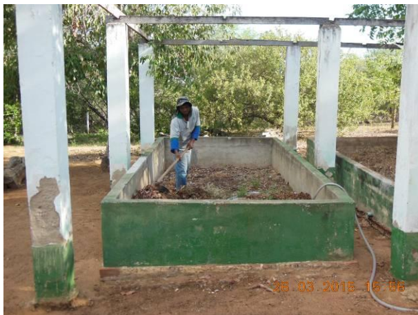
Foto 65 - Equipe da AGROSIG realizando o revolvimento do material orgânico na composteira.

O tempo médio para a decomposição e estabilização do material é em torno de 2 meses. As características finais do composto são de cor marrom café, cheiro agradável de terra, estar homogêneo sendo impossível distinguir o material de origem.