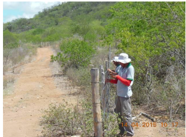
Foto 76 - Manutenção da cerca de madeira no entorno da área 06.