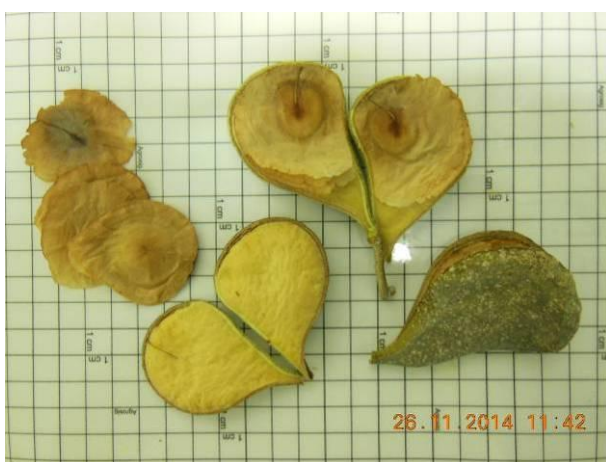
Foto 17 - Sementes de Pereiro, Aspidosperma multiflorum A. DC. em beneficiamento.