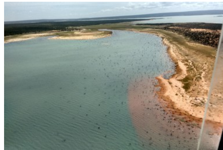
Ponto 2.2 - 09°03'00,3"S / 38°18'37,7"W