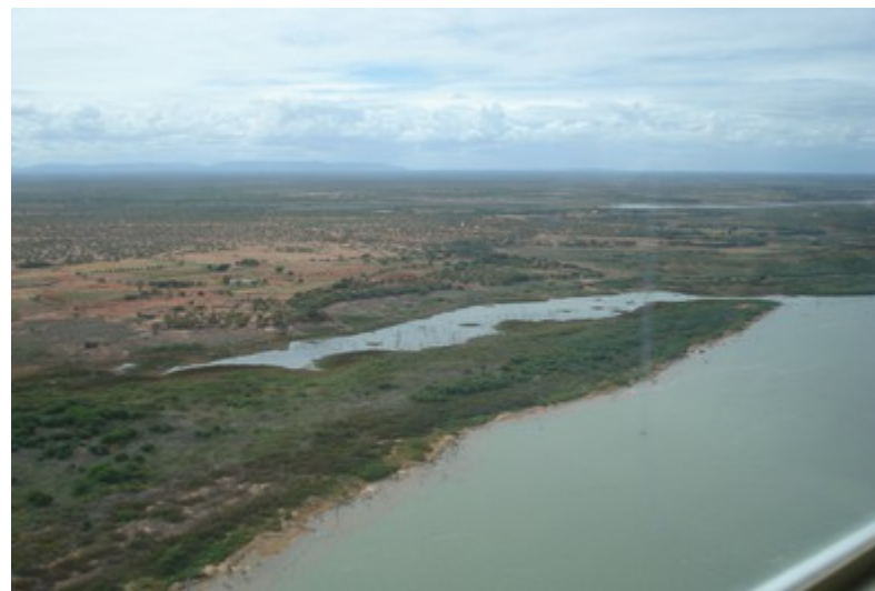
Ponto 1.6 - 08°47'17,9"S / 38°55'46,9"W