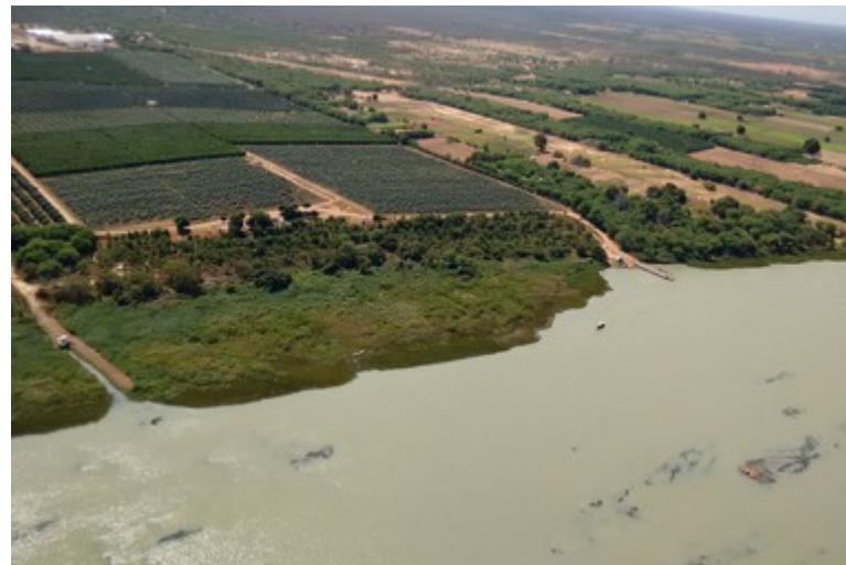
Ponto 5.2 - 08°40'55,1"S / 39°10'15,9"W