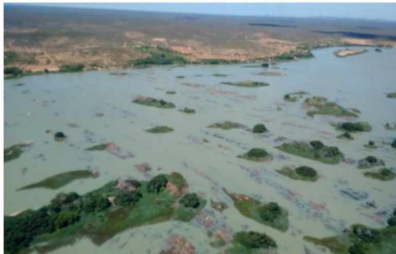
Ponto 4.1 - 08°32'12,9"S / 39°25'27,0"W