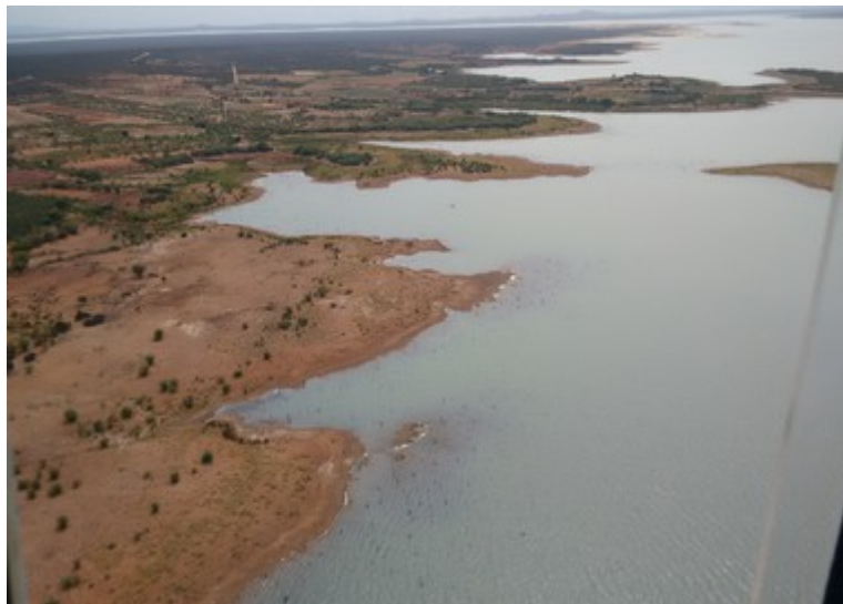
Ponto 2.3 - 08°57'31,8"S / 038°32'59,0"W