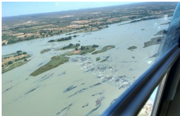
Ponto 4.3 - 08°40'37,3"S / 39°13'28,2"W