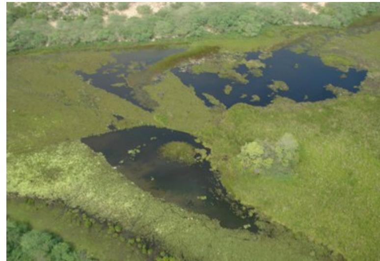
Ponto 1.10 - 09°10'59,8"S / 38°18'47,2"W