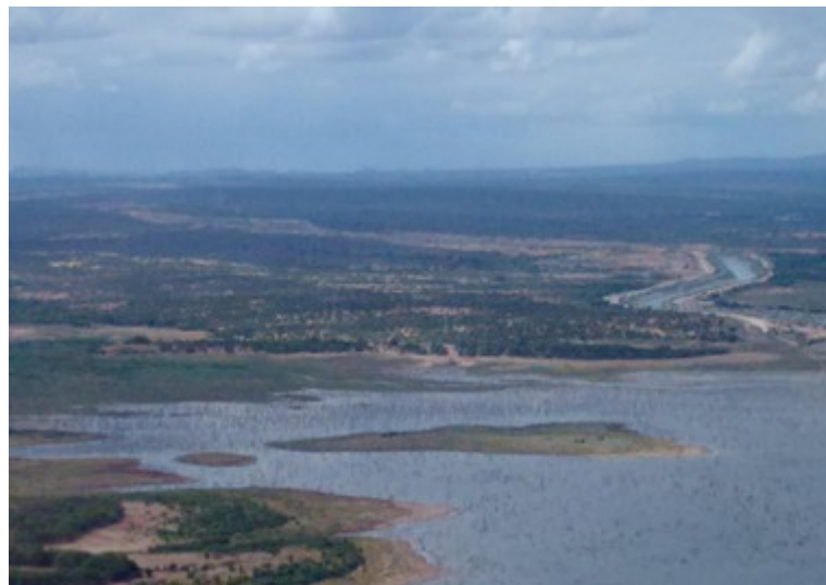
Ponto 2.5 - 08°48'45,1"S / 38°25'09,0"W