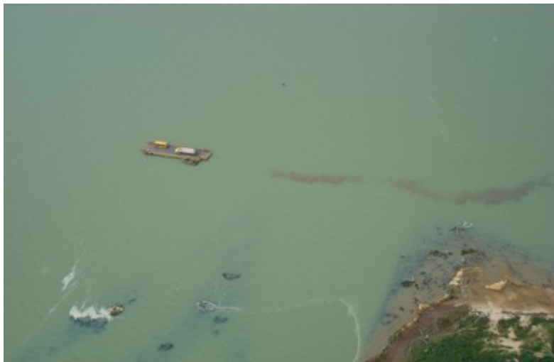
Ponto 5.1 - 08°47'48,6"S / 38°57'23,1"W