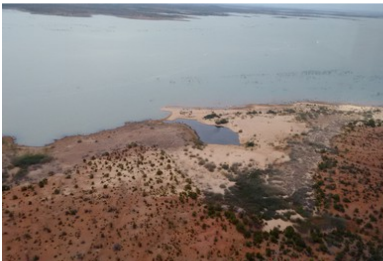
Ponto 1.3 - 08°48'58,8"S / 38°47'05,0"W