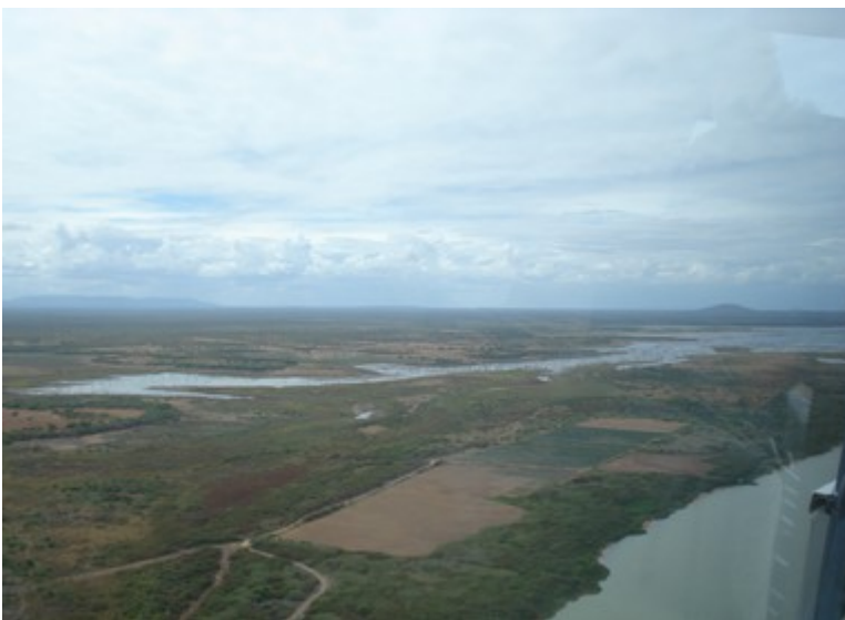
Ponto 1.7 - 08°46'45,6"S / 38°54'04,0"W