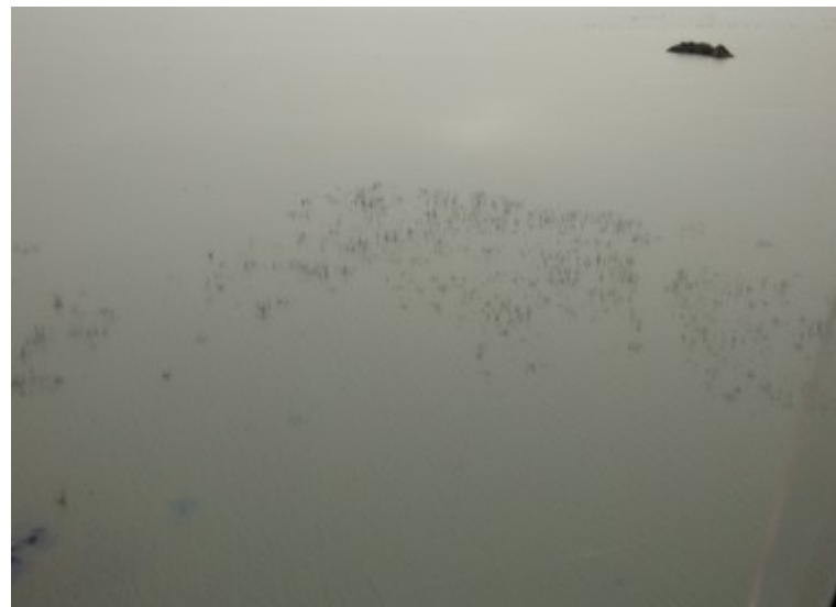
Ponto 2.4 - 08°50'22,9"S / 38°45'25,2"W