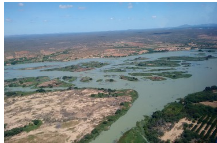
Ponto 4.2 - 08°32'37,7"S / 39°20'26,4"W