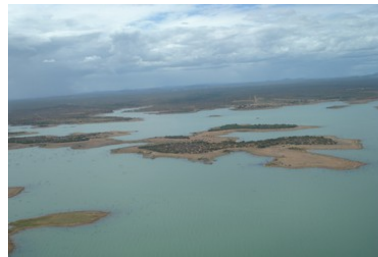
Ponto 3.4 - 08°47'51,1"S / 38°33'57,6"W