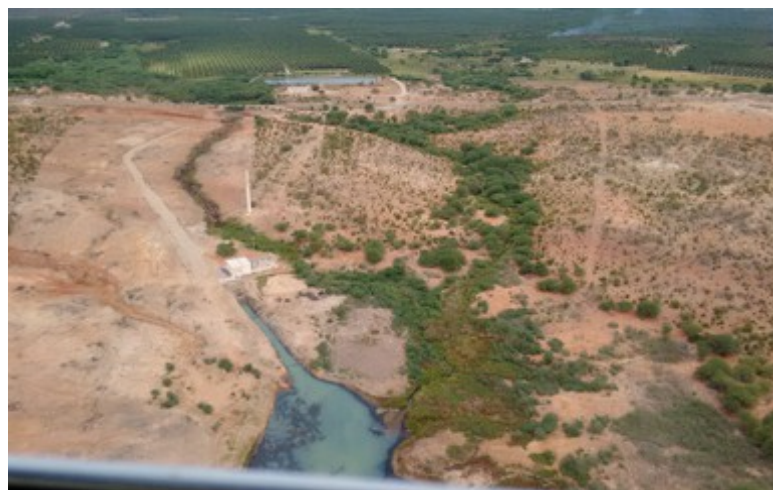
Ponto 6.1 - 08°51'12,0"S / 38°44'12,2"W