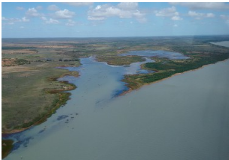
Ponto 1.5 - 08°47'21,8"S / 38°54'17,1"W