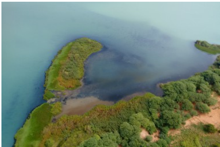
Ponto 3.1 - 09°10'49,8"S / 38°17'05,7"W