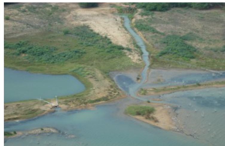
Ponto 6.2 - 08°57'04,3"S / 38°19'05,4"W