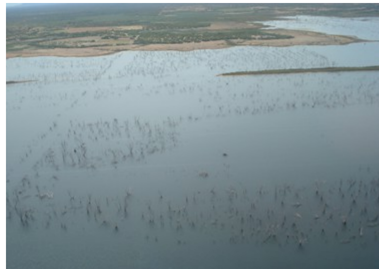
Ponto 2.6 - 08°46'13,5"S / 38°51'52,0"W