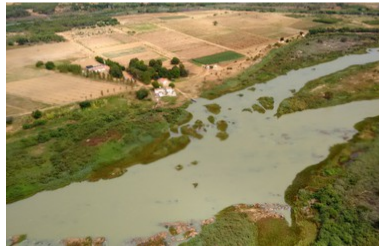
Ponto 4.4 - 08°44'17,9"S / 39°00'30,6"W