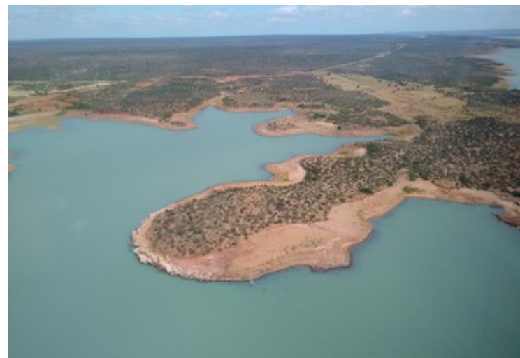
Ponto 3.2 - 08°58'07,5"S / 38°30'45,8"W