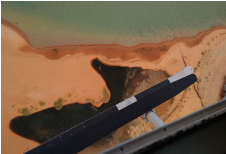
Ponto 1.1 - 08°59'11,8"S / 38°28'31,8"W