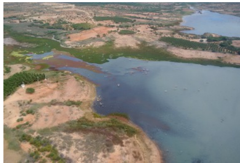
Ponto 1.2 - 08°49'39,2"S / 38°46'42,5"W