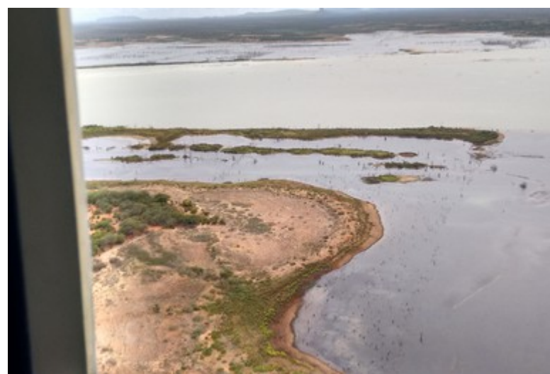
Ponto 1.4 - 08°47'31,04"S / 38°52'11,1"W