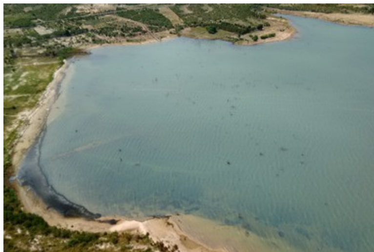
Ponto 2.1 - 09°05'07,6"S / 38°17'45,1"W