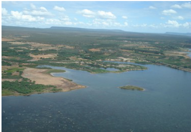
Ponto 1.9 - 08°59'10,0"S / 38°12'40,8"W

MINISTÉRIO DO MEIO AMBIENTE INSTITUTO BRASILEIRO DO MEIO AMBIENTE E DOS RECURSOS NATURAIS RENOVÁVEIS DIRETORIA DE LICENCIAMENTO AMBIENTAL