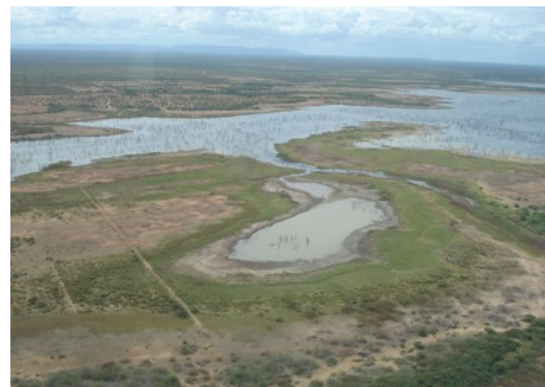
Ponto 1.8 - 08°46'40,4"S / 38°53'39,1"W