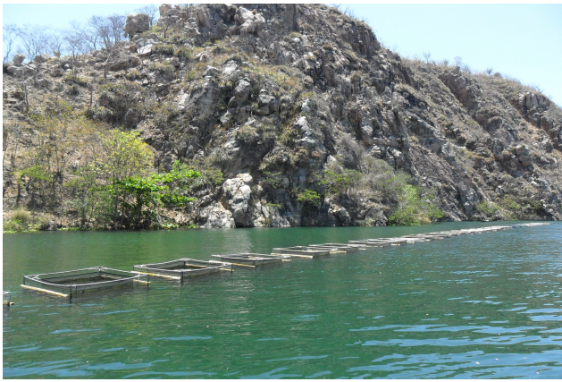
Figura 25: Lago de Xingó piscicultura tanque rede