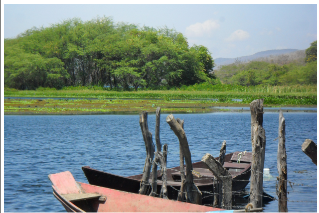
Figura 30: Macrófitas no lago de Moxotó