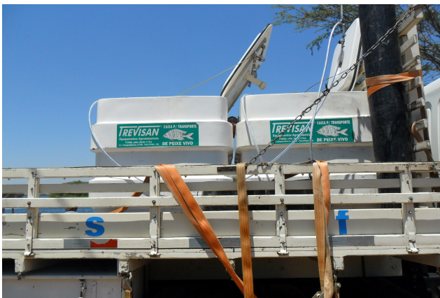
Figura 21: Transporte de alevinos da EPPA até o ponto de soltura