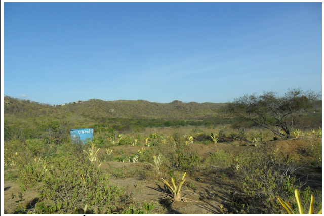
Figura 14: Área de PRAD Xingó com bom estágio de recuperação