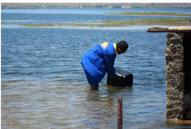
Figura 23: Alevinos sendo transportados de balde para aclimação no local