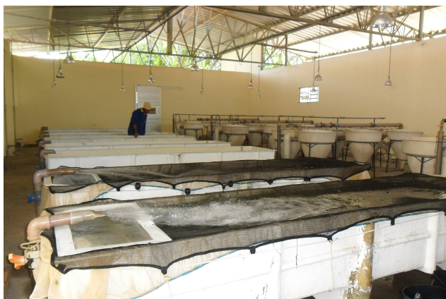
Figura 3: Incubadoras tipo calha e funil