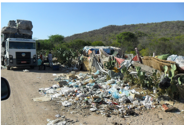
Figura 17: Lixão de Canindé