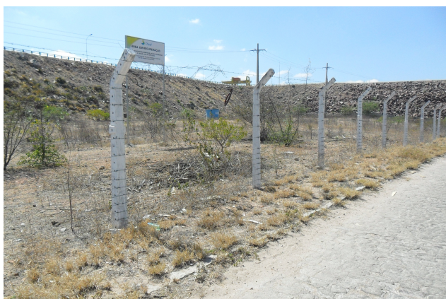
Figura 5: Área 2 de implantação do PRAD em PA