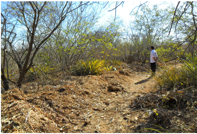
Figura 19: Interior da área do entorno do viveiro de mudas de Xingó