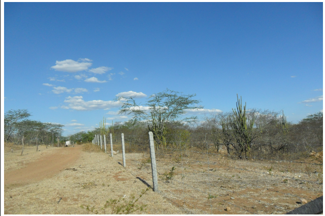
Figura 20: Cerca que limita área em recuperação no entorno do viveiro de mudas de Xingó