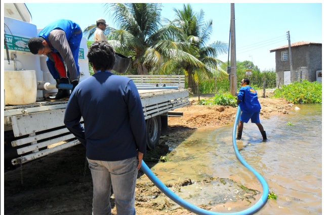
Figura 22: Peixamento no reservatório de Moxotó