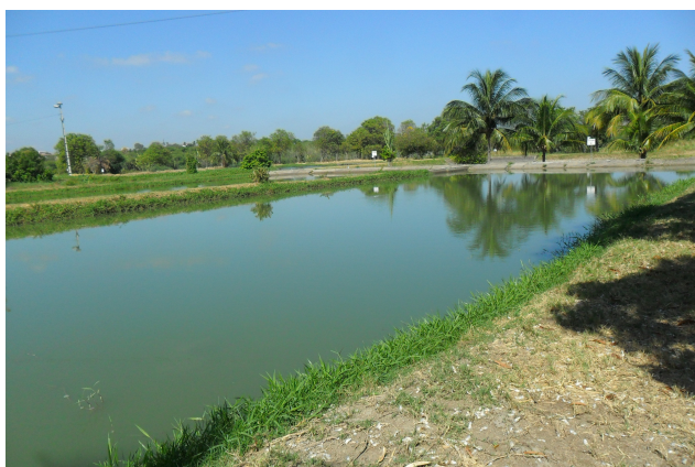
Figura 1: Viveiro escavado na área externa da EPPA