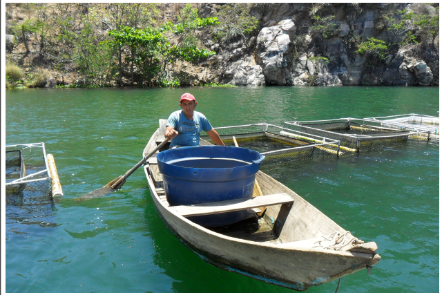
Figura 26: Funcionário da Piscicultura Boa Vista no lago de Xingó