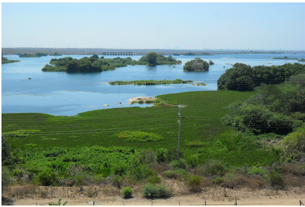
29: Macrófitas no lago Delmiro Gouveia