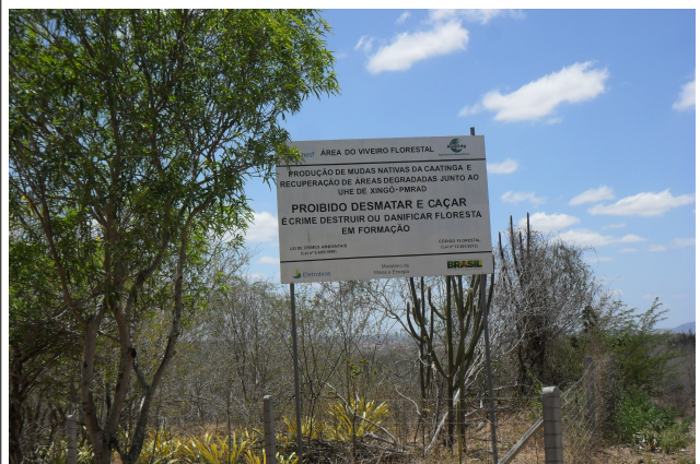
Figura 18: Área em recuperação no entorno do viveiro de mudas de Xingó