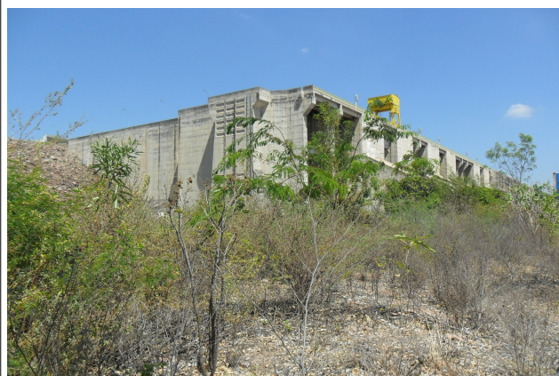
Figura 6: Área 3 de implantação do PRAD em PA