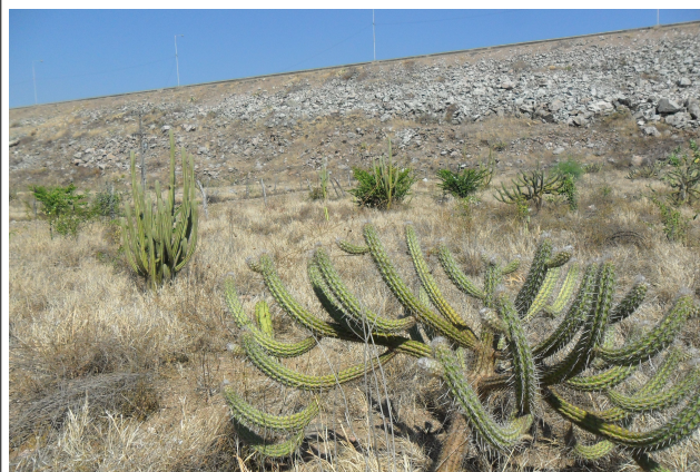
Figura 4: Área 1 de implantação do PRAD em PA