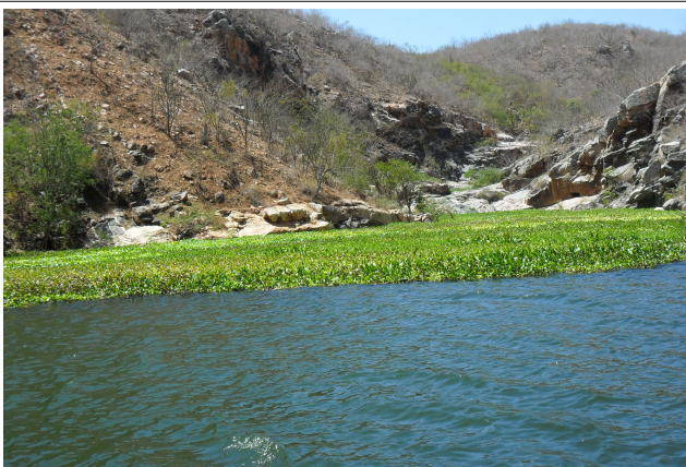
Figura 27: Acúmulo de macrófitas próximo as UHES do