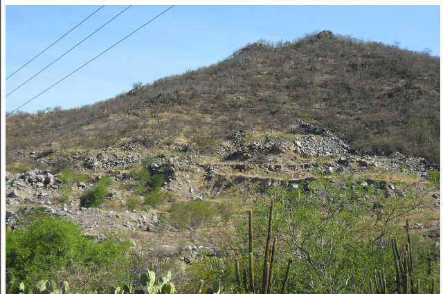
Figura 12: Área de PRAD Xingó com material rochoso espalhado em área mais plana