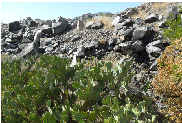
Figura 11: Área de PRAD Xingó com material rochoso que serve de reserva técnica