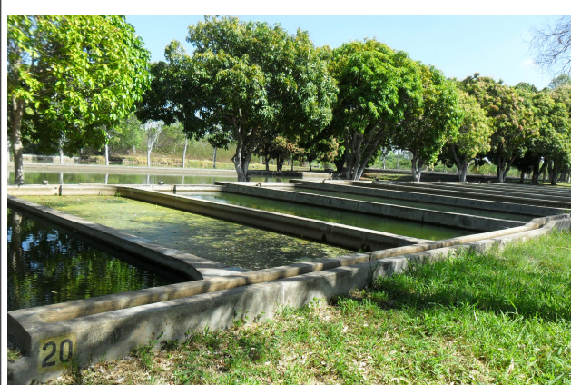
Figura 2: Tanques em, alvenaria na área externa da EPPA