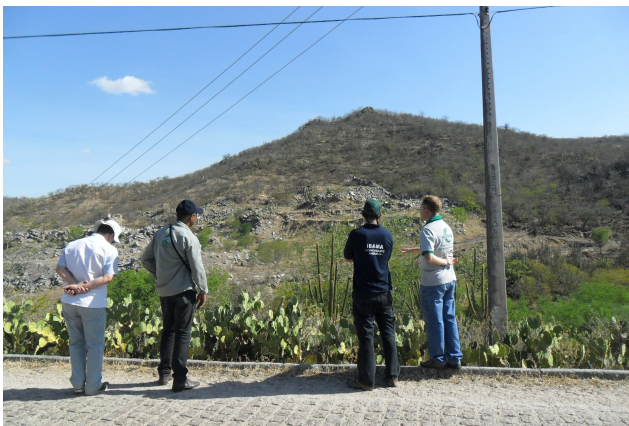
Figura 9: Área de implantação do PRAD Xingó