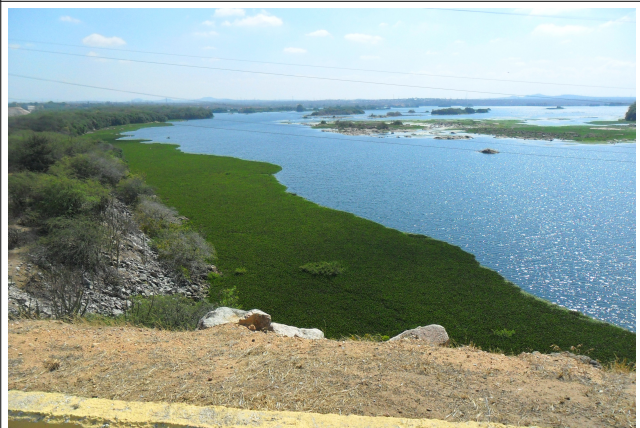
Figura 28: Macrófitas registradas no lago de Delmiro Gouveia próximo ao vertedouro da UHE