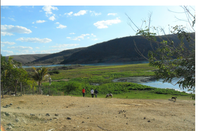
Figura 24: Outro ponto utilizado para peixamento no rio Capiá, a jusante da UHE Xingó, observa-se a formação de uma ilha em função da seca na região