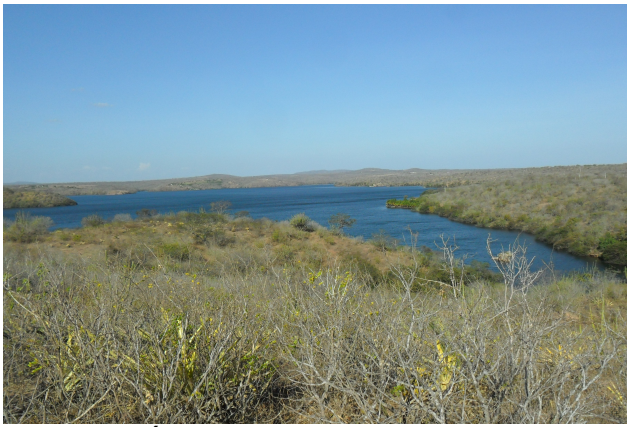
Figura 13: Área de PRAD Xingó próximo a margem do rio com bom estágio de recuperação