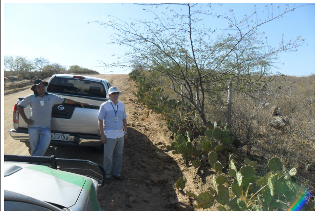
Figura 10: Área de implantação do PRAD Xingó área plana