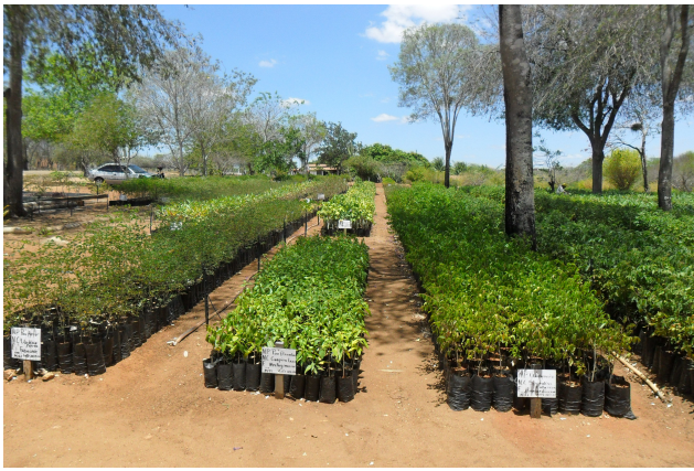
Figura 7: Mudas produzidas no viveiro de Xingó - Piranhas/AL