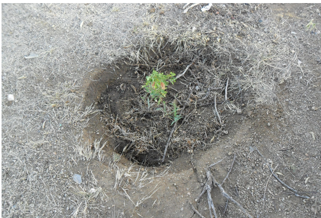
Figura 15: PRAD Xingó – área 06 onde foram replantadas 2.000 mudas