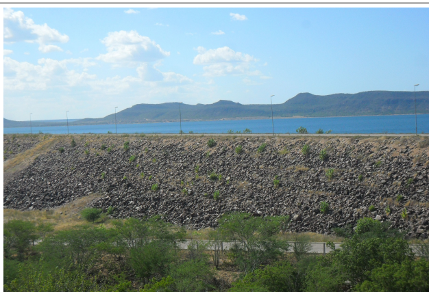
Imagem 48: Petrolândia/PE, barragem de Itaparica