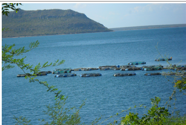
Imagem 47: Petrolândia/PE, Reservatório Itaparica, piscicultura com tanques flutuantes