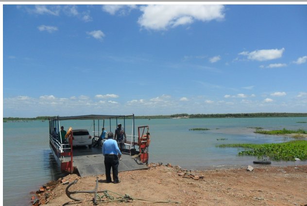
Imagem 37: Travessia Chorrocho/BA - Belém do São Francisco/PE