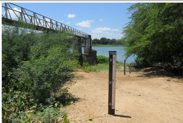
Imagem 39: Belém do São Francisco/PE - Régua Limnimétrica no ponto de captação para abastecimento urbano