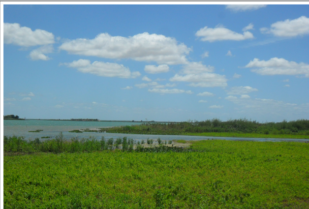
Imagem 38: Reservatório Itaparica margem direita, vegetação próxima ao ponto de travessia