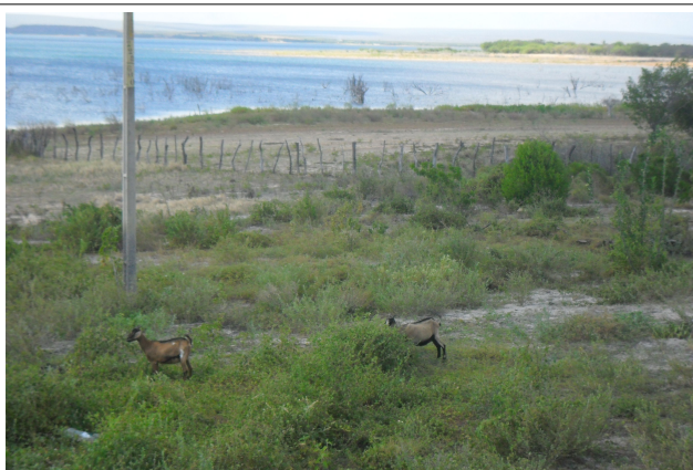
Imagem 44: Petrolândia/PE, Reservatório Itaparica, bancos de areia e áreas secas no entorno do reservatório