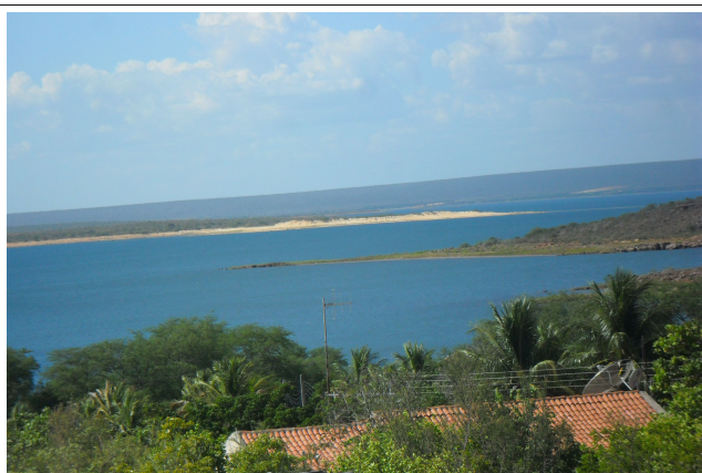
Imagem 45: Petrolândia/PE, Reservatório Itaparica, banco de areia e afloramento de rochas