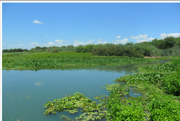
Imagem 41: Belém do São Francisco/PE, vegetação nos arredores do ponto de captação