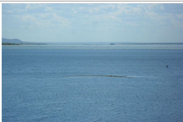
Imagem 43: Petrolândia/PE, Reservatório Itaparica, bancos de areia avistados da margem esquerda