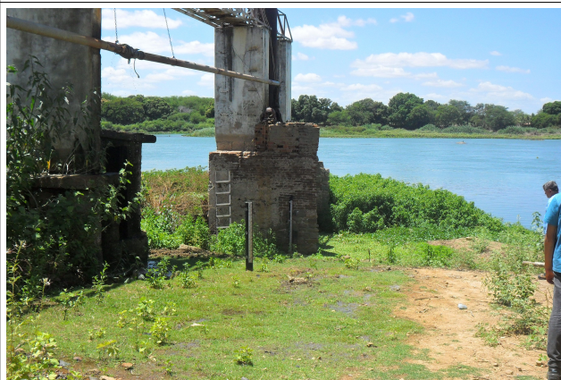
Imagem 40: Belém do São Francisco/PE, detalhe da Régua Limnimétrica