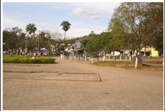
FOTO 57 - Camelôs ao lado da praça, Cerro Azul. UTM: 675.623 mE X 7.253.154 mN.