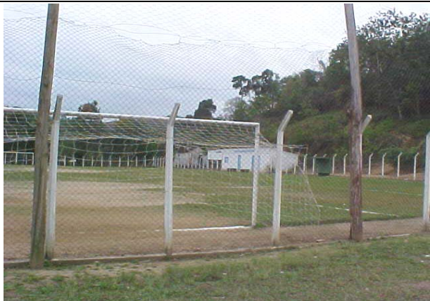
Praça Antonio Dias Agibert, Adrianópolis. UTM: 703.350 mE X 7.271.269 mN.