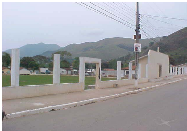
FOTO 64 – Praça Doutor Ulysses Guimarães, Doutor Ulysses. UTM: 659.976 mE X 7.281.962 mN.