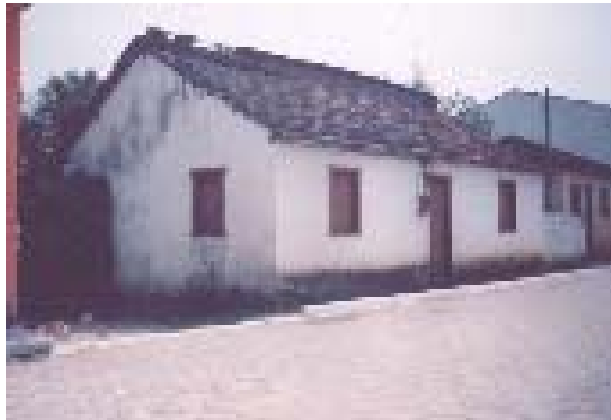
FOTO 56 - Praça Monsenhor Celso, Cerro Azul. UTM: 675.623 mE X 7.253.154 mN.