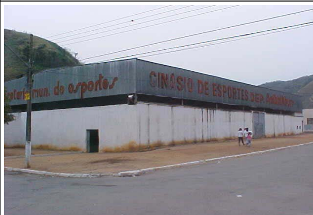
FOTO 63 – Estádio Municipal, Adrianópolis. UTM: 703.321 mE X 7.270.805 mN.