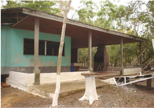
FOTO 81 – Acesso à Ilha da Saudade, Ribeira. UTM: 693.897 mE X 7.277.258 mN.