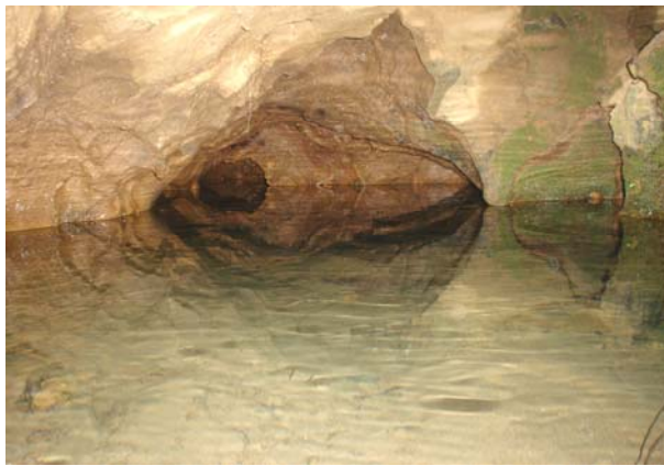
FOTO 79 – Entrada da Caverna da Pedra Grande, Ribeira. UTM: 703.327 mE X 7.271.802 mN.