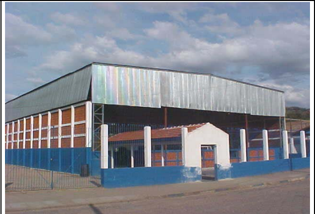
FOTO 59 - Estádio Marlindo V. Pereira, Cerro Azul. UTM: 675.875 mE X 7.253.557 mN.