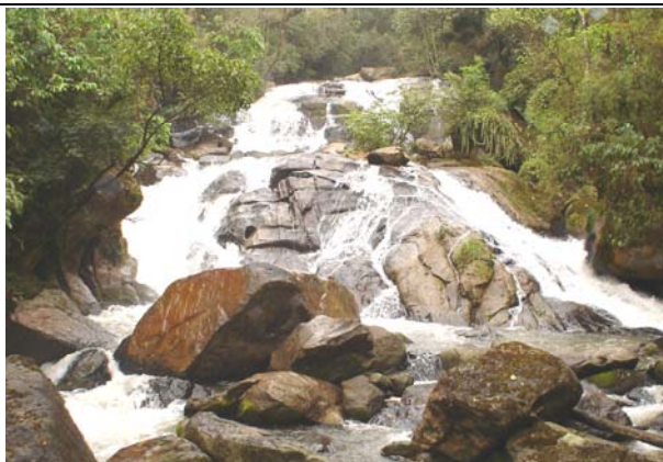
FOTO 74 – Gruta do Bom Sucesso, Cerro Azul. UTM: 681.092 mE X 7.255.219 mN.