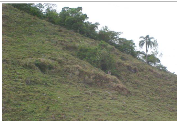
FOTO 75 – Entrada da Gruta do Bom Sucesso. UTM: 681.092 mE X 7.255.219 mN.