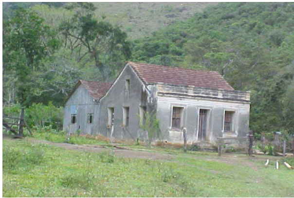
FOTO 20 – Edificação localizada na Praça Monsenhor Celso utilizada para fins comerciais. Construída em madeira e alvenaria. Nota-se a presença marcante do porão. UTM: 675.623 mE X 7.253.154 mN.