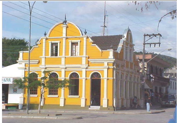
FOTO 10 - Outro exemplar arquitetônico eclético na Praça M. Celso. Apresenta elementos de fachada com ritmo e simetria, características da arquitetura eclética. UTM: 675.623 mE X 7.253.154 mN.