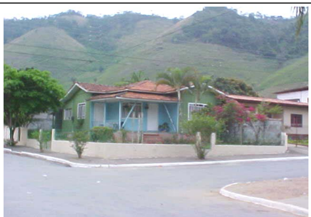
FOTO 30 – Edificação religiosa de madeira, “Assembléia de Deus em Curitiba”, na zona rural de Adrianópolis. UTM: 688.471 mE X 7.266.786 mN.