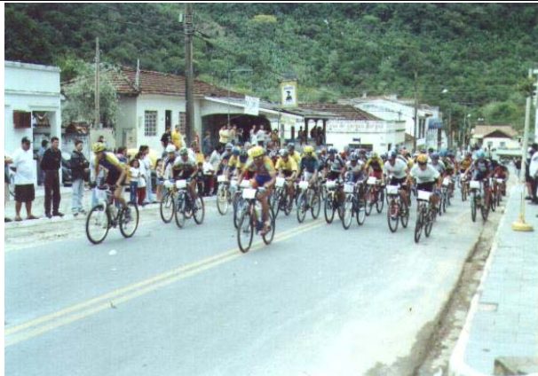
FOTO 37 - Prova Ciclística.