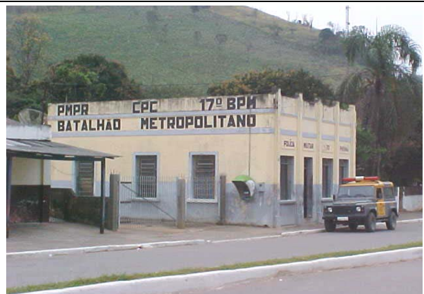
FOTO 28 – Edifício histórico, localizado na Avenida Mascarenhas dos Santos. UTM: 703.350 mE X 7.271.269 mN.