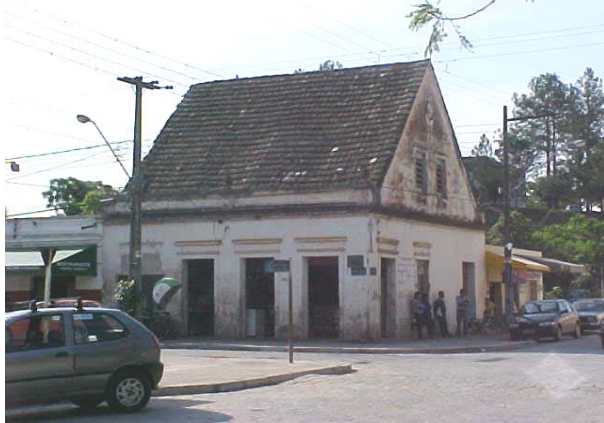
FOTO 14 —Casarão histórico (Rua São Jorge). Construído por uma família local, e funciona como residência até hoje, ao contrário da maioria. Pertenceu a diversos proprietários. UTM: 675.792 mE X 7.253.223 mN.