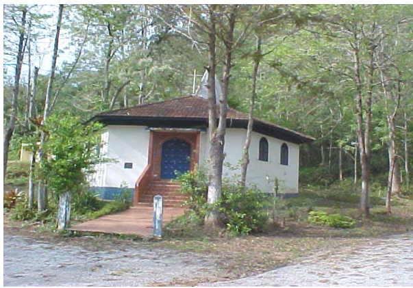
FOTO 34 – conjunto edificado, zona rural. UTM: 667.915 mE X 7.261.062 mN.