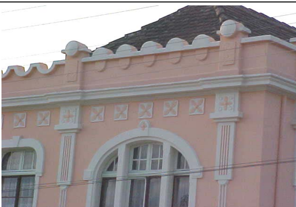
FOTO 17 – Detalhe da cuidadosa ornamentação nas fachadas do Palacete Bassetti.