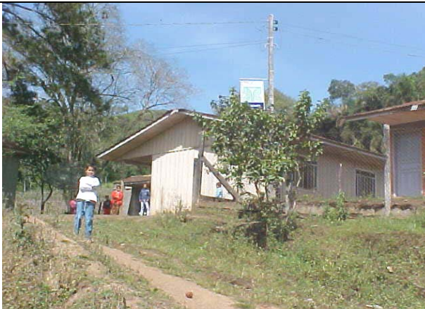
FOTO 24 - Residência de madeira em Mato Preto. Será afetada pela construção da UHE Tijuco Alto (ver Mapa Patrimônio Histórico e Cultural). UTM: 683.027 X 7.260.052 mN.