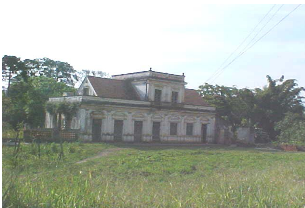
FOTO 02 – Detalhe da ornamentação na fachada principal. UTM: 675.284 mE X 7.252.158 mN.