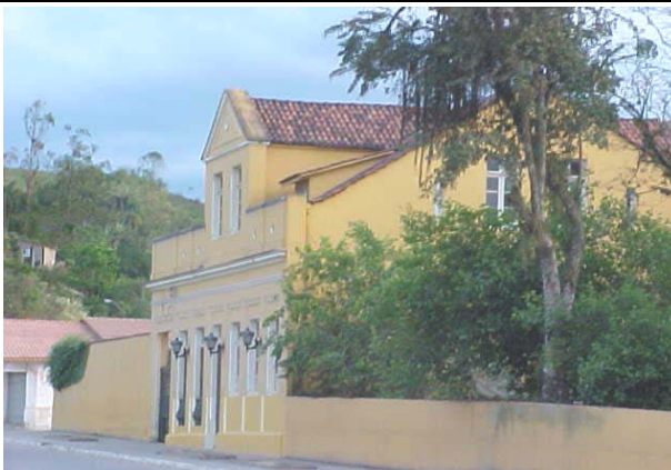
FOTO 16 – Palacete Bassetti. UTM: 675.853 mE X 7.253.363 mN.