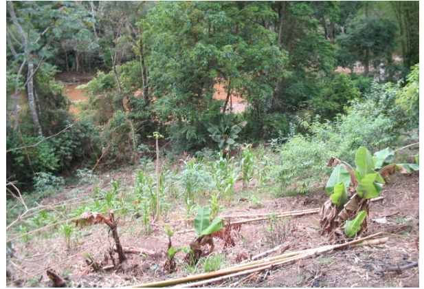
FOTO 89 – Curral e pastagem / ponto 60. UTM 673.642 mE X 7.254.679 mN.

FOTO 88 – Área de agricultura de subsistência, na margem do rio Ponta Grossa / ponto 59. UTM 674.949 mE X 7.254.298 mN.