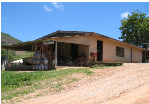
FOTO 54 – Galpão / ponto 118. UTM 666.088 mE X 7.254.636 mN.

FOTO 53 – Bar e mercearia / ponto 113. UTM 666.311 mE X 7.254.661 mN.