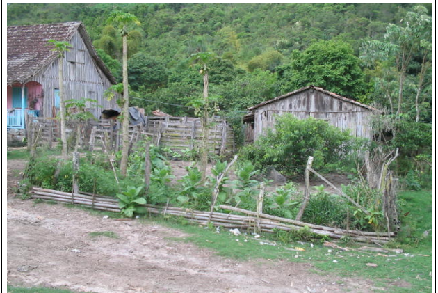
FOTO 19 – Instalações de um alambique. Segundo os proprietários funciona a mais de cem anos / ponto 134. UTM 677.221 mE X 7.262.251 mN.

FOTO 18 – Horta. Normalmente é cercada por tela para impedir a entrada de animais / ponto 131. UTM 675.176 mE X 7.262.737 mN.