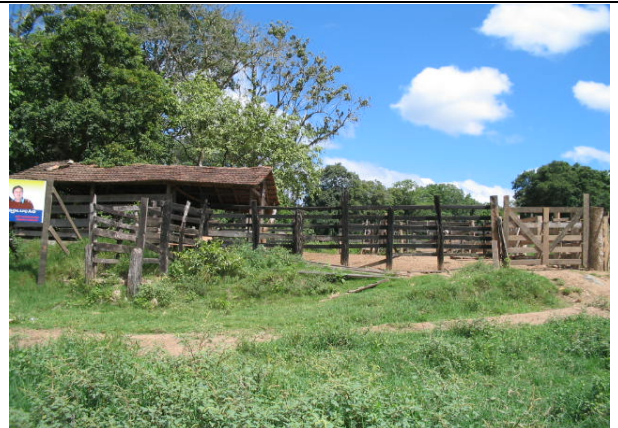
FOTO 74 – Áreas com agricultura de subsistência (feijão) / ponto 158. UTM 683.002 mE X 7.260.185 mN.

FOTO 73 Foto 71 – Curral / ponto 158. UTM 683.002 mE X 7.260.185 mN.