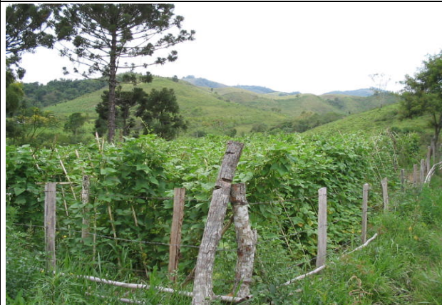
FOTO 59 – Cultura do feijão de vagem / ponto 122. UTM 662.843 mE X 7.249.992 mN.