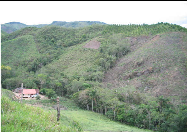
FOTO 18 – Horta. Normalmente é cercada por tela para impedir a entrada de animais / ponto 131. UTM 675.176 mE X 7.262.737 mN.

FOTO 20 – Vista da região do ribeirão dos Porcos, o qual deságua no rio Sete Quedas. Predomina a pecuária e a laranja, nas partes menos íngremes / ponto 135. UTM 677.224 mE X 7.263.141 mN.