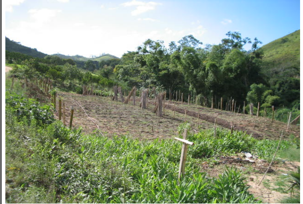
FOTO 52 – Madeira cortada e armazenada na beira da estrada. Utilizada para cercas e estruturas de produção / ponto 100. UTM 671.555 mE X 7.256.849 mN.

FOTO 51 – Área preparada para a implantação da cultura do maracujá. As estruturas (varal) ainda vão ser colocadas / ponto 107. UTM 667.847 mE X 7.255.165 mN.