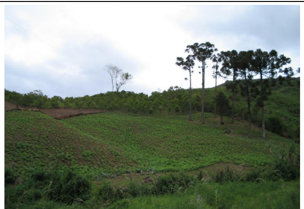
FOTO 31 Cultura do feijão / ponto 98. UTM 672.198 mE X 7.258.913 mN.