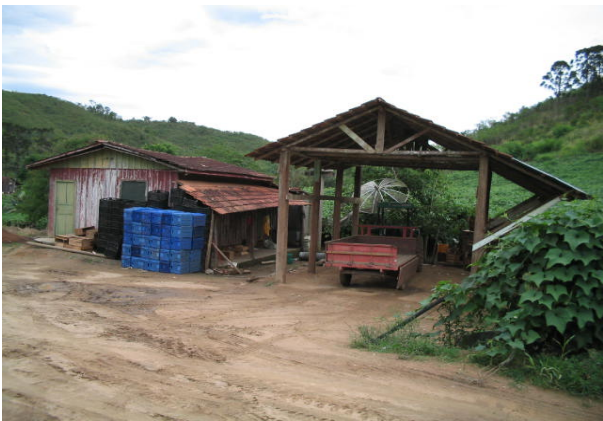
FOTO 95 – Chiqueiro / ponto 68. UTM 672.900 mE X 7.257.787 mN.