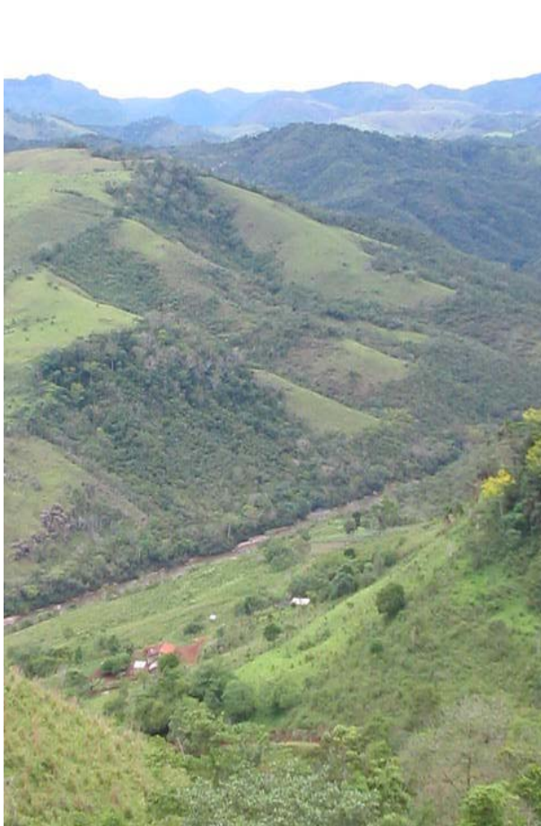
FOTO 20 – Vista da região do ribeirão dos Porcos, o qual deságua no rio Sete Quedas. Predomina a pecuária e a laranja, nas partes menos íngremes / ponto 135. UTM 677.224 mE X 7.263.141 mN.

FOTO 17 – Vista do rio Ribeira, entre a região de Sete Quedas e Itapirapuã, região onde a pecuária é predominante. Do outro lado do rio é a região conhecida como o bairro dos Blum / ponto 138. UTM 679.065 mE X 7.264.538 mN.