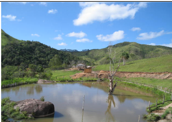
FOTO 43 – Bar e mercearia, próximo à balsa / ponto 109. UTM 666.667 mE X 7.254.642 mN.