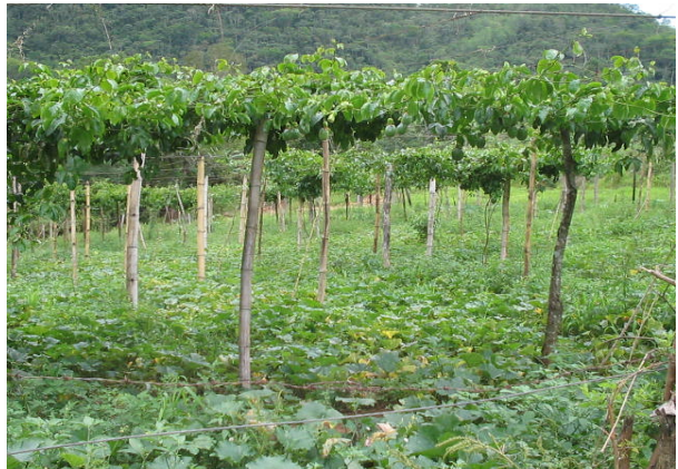
FOTO 09 – Horta. Normalmente é cercada por tela para impedir a entrada de animais / ponto 194. UTM 697.849 mE X 7.271.739 mN.