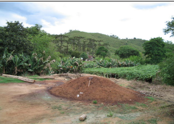
FOTO 90 – Preparo de adubo orgânico / ponto 61. UTM 674.376 mE X 7.256.212 mN.