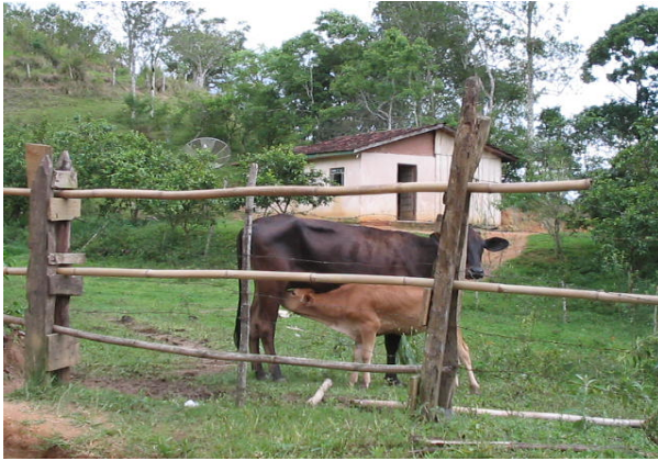
FOTO 88 – Área de agricultura de subsistência, na margem do rio Ponta Grossa / ponto 59. UTM 674.949 mE X 7.254.298 mN.

FOTO 87 – Criação de gado bovino em pequena escala (subsistência) / ponto 58. UTM 675.192 mE X 7.253.821 mN.