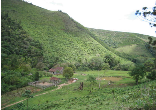
FOTO 83 – Gado bovino – região do Bonsucesso / ponto 150. UTM 680.997 mE X 7.255.309