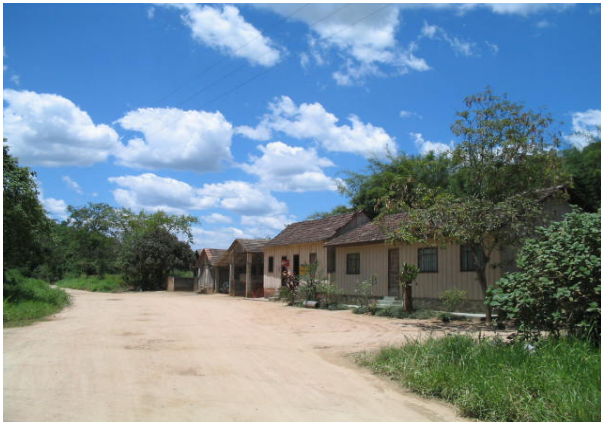
FOTO 27 – Cultivo de tomate, ao lado de residências e escola / ponto 94. UTM 673.471 mE X 7.257.814 mN.

FOTO 26 – Área comercial, bar e mercearia / ponto 94. UTM 673.471 mE X 7.257.814 mN.