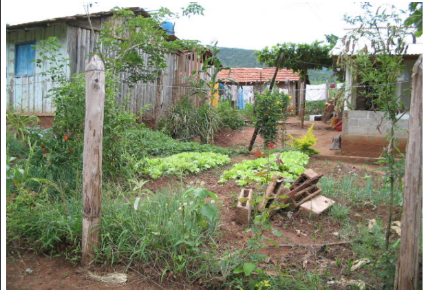
FOTO 10 – Vista da região do eixo da barragem / ponto 190. UTM 698.185 mE X 7.271.932 mN.