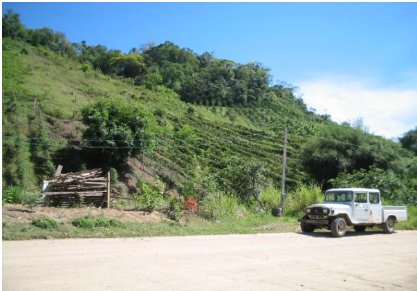
FOTO 25 – Preparo do terreno para plantio, feito de forma manual. / ponto 91. UTM 674.418 mE X 7.256.453 mN.

FOTO 23 – Área de agricultura, cultivada com horti-fruti e pastagem em área de morro / ponto 90. UTM 674.727 mE X 7.256.681 mN.