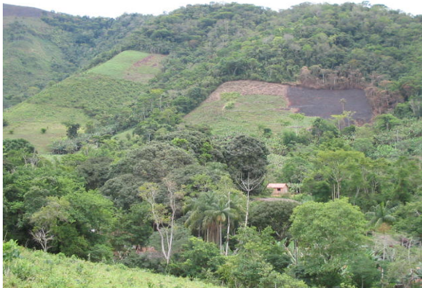
FOTO 07 – Cultura do feijão. Agricultura de subsistência cultivada próxima à residência / ponto 194. UTM 697.849 mE X 7.271.739 mN.