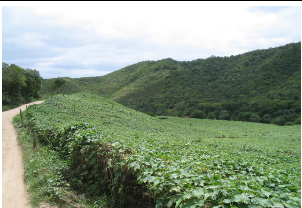
FOTO 49 – Área cultivada com maracujá. Nota-se o beneficiamento sendo feito no próprio local / ponto 101. UTM 671.567 mE X 7.257.165 mN.