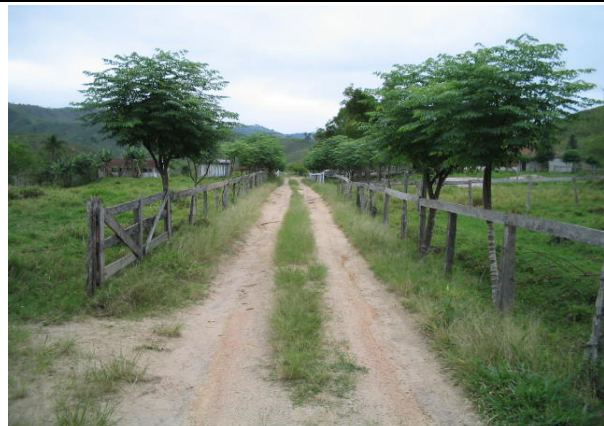
FOTO 63 – Estrada paralela ao rio Bomba, na área do remanso / ponto 125. UTM 662.176 mE X 7.252.287 mN.