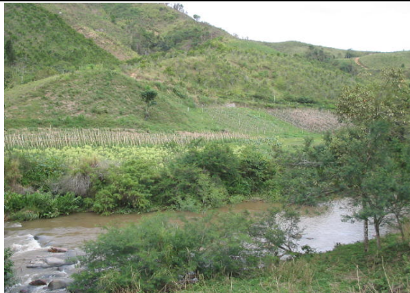
FOTO 35 – Criação de cabritos / ponto 96. UTM 672.282 mE X 7.258.073 mN.