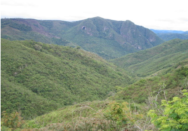
FOTO 16 – No primeiro plano nota-se o vale do rio Pinhal, que deságua no rio Itapirapuã, o qual se encontra ao fundo, e na parte alta do morro vê-se a entrada de uma caverna / ponto 139. UTM 677.576 mE X 7.266.161 mN.