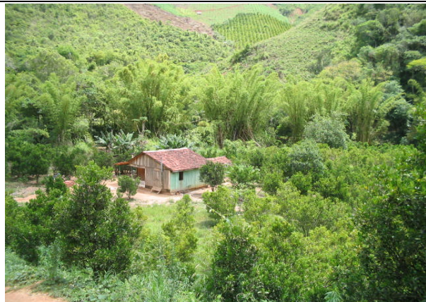
FOTO 85 – Remanescente florestal na região do rio Bonsucesso. Nota-se aqui a grande quantidade de Palmitos / ponto 152. UTM 680.899 mE X 7.256.033 mN.