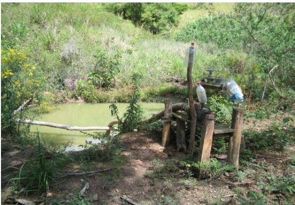
FOTO 101 – Área de agricultura irrigada, com finalidade comercial (tomate, pimentão) / ponto 70. UTM 672.278 mE X 7.257.879 mN.