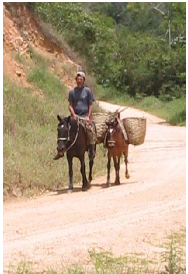
FOTO 76 – Área destinada à agricultura de subsistência, na margem do rio Ribeira / ponto 153. UTM 681.797 mE X 7.258.007 mN.

FOTO 75 – Meio de transporte utilizado pelos moradores e para carga / ponto 145. UTM 677.524 mE X 7.258.036 mN.