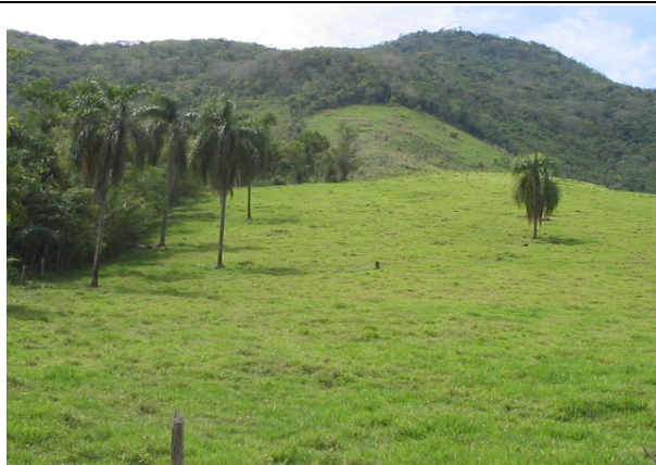
FOTO 69 – Cerca / ponto 186. UTM 697.966 mE X 7.270.557 mN.