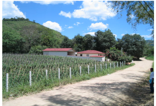
FOTO 28 Colheita e beneficiamento da produção de tomate / ponto 92. UTM 673.850 mE X 7.258.553 mN.

FOTO 27 – Cultivo de tomate, ao lado de residências e escola / ponto 94. UTM 673.471 mE X 7.257.814 mN.