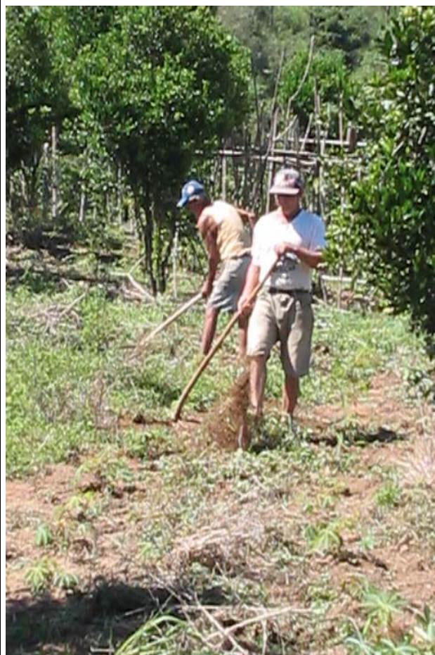
FOTO 24 – Terreno preparado para o plantio de maracujá e chuchu / ponto 91. UTM 674.418 mE X 7.256.453 mN.

FOTO 25 – Preparo do terreno para plantio, feito de forma manual. / ponto 91. UTM 674.418 mE X 7.256.453 mN.