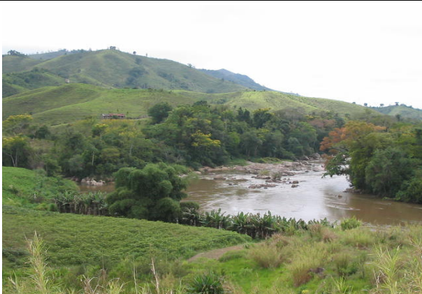
FOTO 65 – Visão do rio Ribeira, na área do remanso. Nota-se o cultivo de Citrus muito em área de APP / ponto 126. UTM 662.392 mE X 7.252.128 mN.