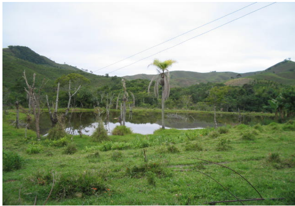
FOTO 61 – Curral, na área do remanso do rio Ribeira / ponto 124. UTM 663.171 mE X 7.251.339 mN.