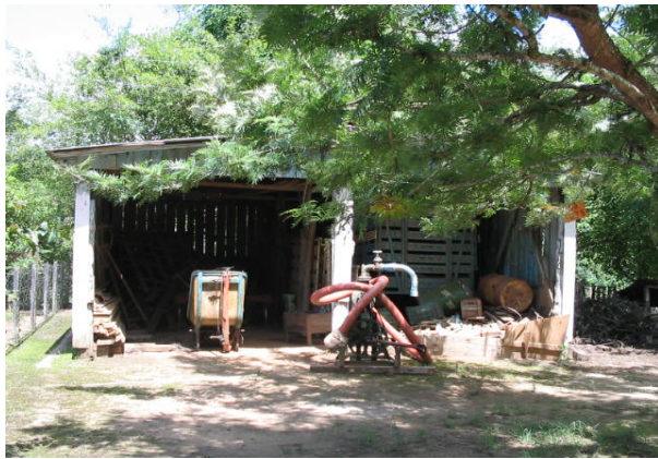
FOTO 107 – Represas de múltiplos usos / ponto 78. UTM 671.037 mE X 7.254.599 mN.