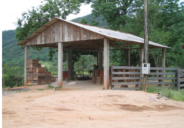
FOTO 02 – Barracão para armazenar produção de horti-fruti / ponto 189. UTM 698.031 mE X 7.271.936 mN.

FOTO 01 – Galpão com múltiplas funções / ponto 195. UTM 698.018 mE X 7.271.661 mN.