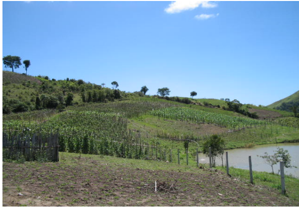
FOTO 56 – Visão do rio Ribeira nas proximidades da região do Lajeado Grande / ponto 114. UTM 665.940 mE X 7.254.487 mN.