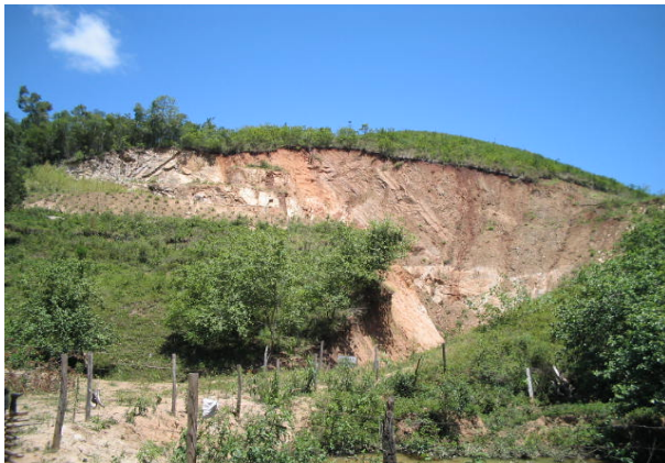
FOTO 41 – Visão de pastagens e da reforma de cercas / ponto 105. UTM 670.255 mE X 7.255.947 mN.