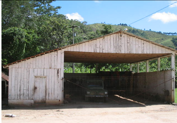
FOTO 45 – Estrutura para criação de porcos e aves / ponto 110. UTM 667.333 mE X 7.254.988 mN.