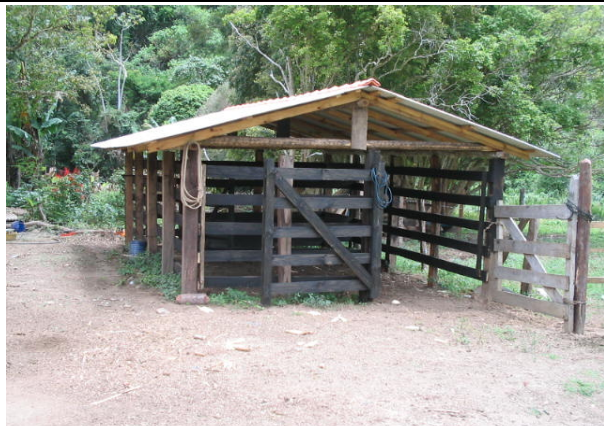
FOTO 80 – Curral / ponto 153. UTM 681.797 mE X 7.258.007 mN.