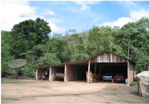
FOTO 97 – Barracão / ponto 71. UTM 672.808 mE X 7.257.849 mN.