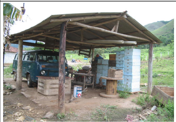
FOTO 11 – Barracão com múltiplas funções / ponto 197. UTM 697.704 mE X 7.270.221 mN.