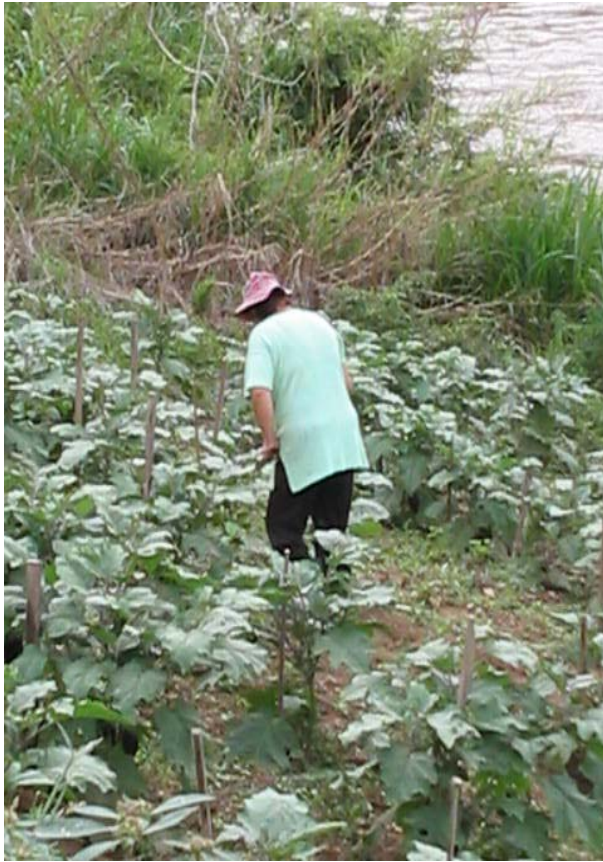
FOTO 93 – Meeiro trabalhando na colheita-beneficiamento do chuchu / Ponto 71. UTM 672.808 mE X 7.257.849 mN.