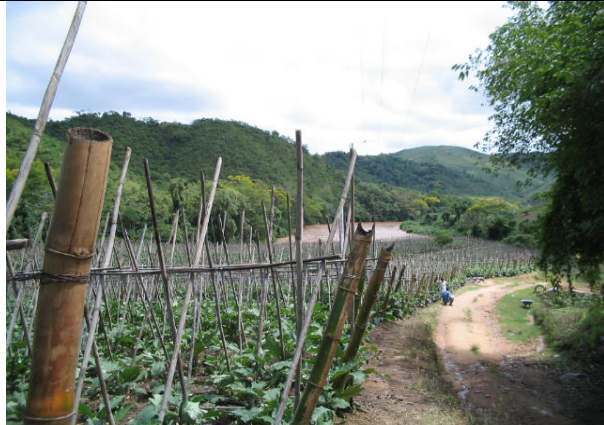
FOTO 112 – Área destinada à agricultura mista (cebolinha, abobrinha, milho, feijão / ponto 78. UTM 671.037 mE X 7.254.599 mN).