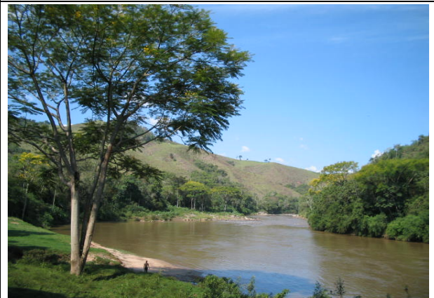
FOTO 22 – Visão das margens do rio ribeira. Aqui há uma predominância das pastagens / ponto 130. UTM 674.913 mE X 7.257.655 mN.

6- Região Sete Quedas Até Ponte de Cerro Azul