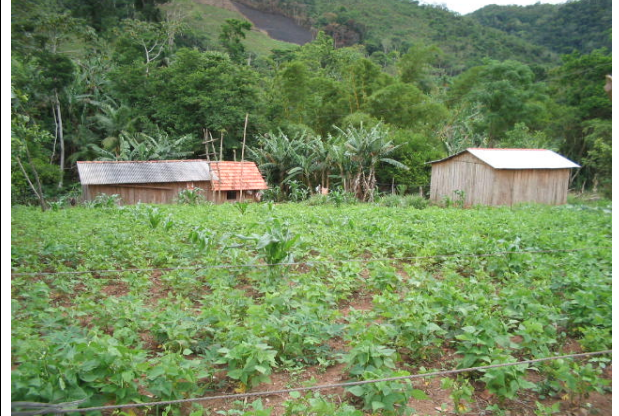
FOTO 08 – Cultura do maracujá consorciado com abobrinha. Agricultura para venda da produção / ponto 194. UTM 697.849 mE X 7.271.739 mN.