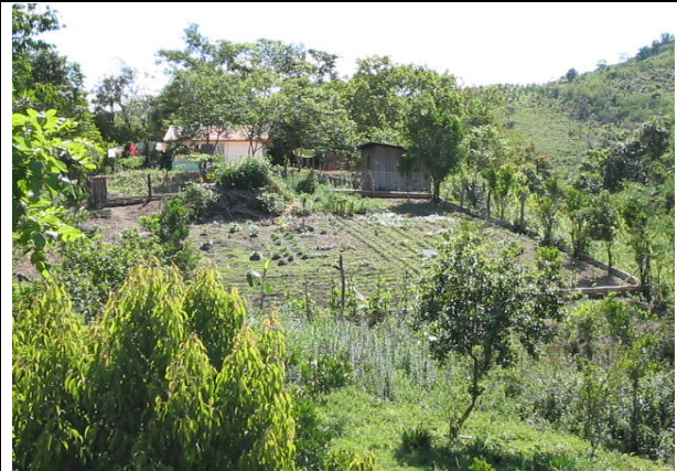
FOTO 122 – Fabricação de rapadura / ponto 86. UTM 664.373 mE X 7.252.869 mN.