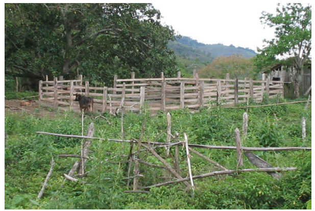
FOTO 15 – Curral / ponto 200. UTM 686.278 mE X 7.270.235 mN.