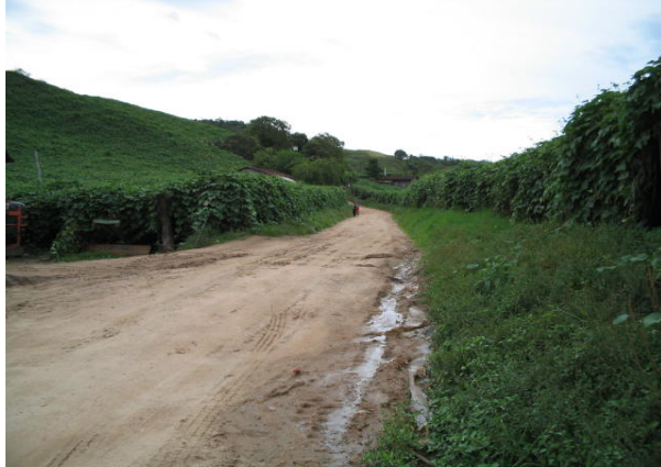
7- Ribeirão Bonito do Chapéu