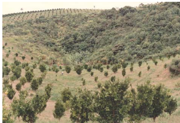
FOTO 45 – Buraco dos Pernilongos/Bocanha – dolina desenvolvida em calcário.