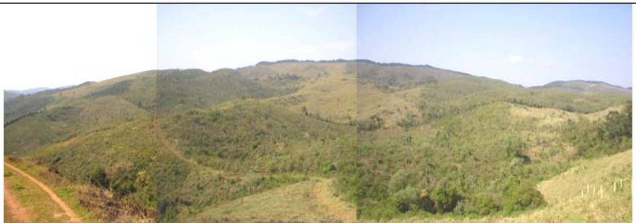
FOTO 54 - Vista Geral do Vale do Desencanto onde se localizam as grutas do Desencanto I e II, Gruta do Toco que não Cai e Gruta da Gambiarra.