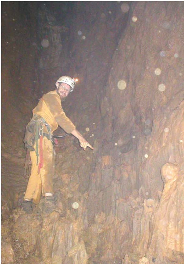
FOTO 62 - Vista da galeria lateral do Abismo Ninho de Diploploda