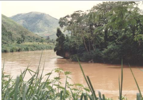
FOTO 39 – Pedra do Morcego – aspecto geral com o rio Ribeira acima do nível normal.