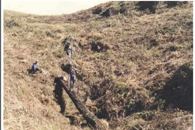
FOTO 46 – Gramados/Vacilo – seqüência de pequenas dolinas condicionadas pela foliação