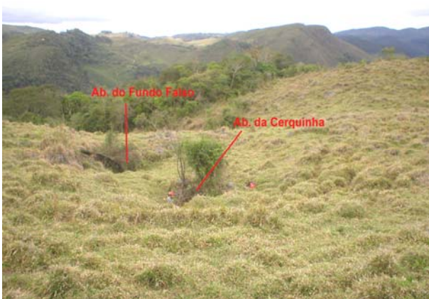
FOTO 63 - Região das entradas dos Abismos do Fundo Falso e da Cerquinha