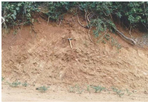
FOTO 51 – Fazenda do Pedro Scheff / rio Sete Quedas – restos de metassedimentos deformados englobados pelos granitos. Local de desenvolvimento de pequenas dolinas.