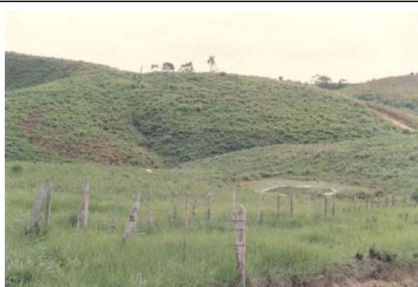
FOTO 49 – Estrada Cerro Azul/Sete Quedas – dolina desenvolvida sobre rocha granítica.