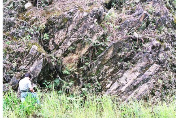
FOTO 37 - Ponto 5A UTM 713.419 mE x 7.283.890 mN – 709 m: metapelitos alterados em zona de falha com orientação N90°; 70°S.