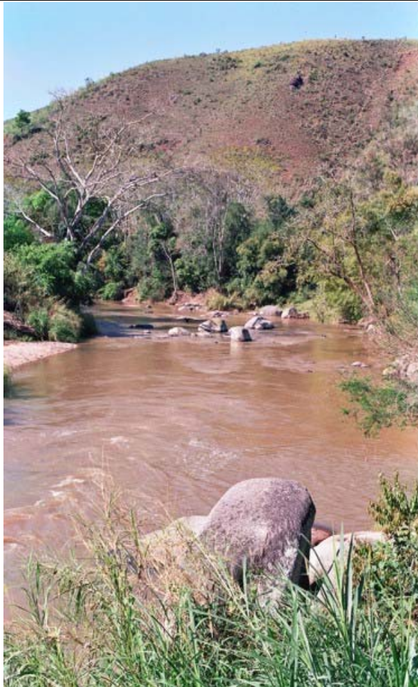
FOTO 11 - Ponto 101 UTM 688.857 mE x 7.278.432 mN-339 m: rio Catas Altas atulhado com blocos grandes de granito, em área de domínio desse tipo de rocha; vista em direção a jusante.