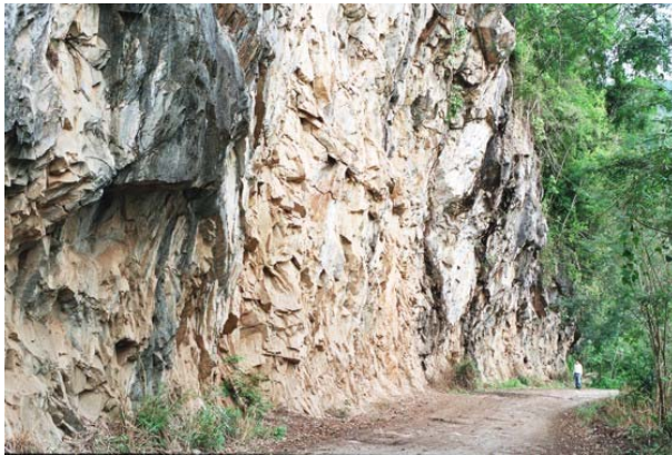
FOTO 43 - Ponto 91 UTM 698.746 mE x 7.271.570 mN - 191 m: detalhe do acamamento do calcário marmóreo ilustrado na foto 42.