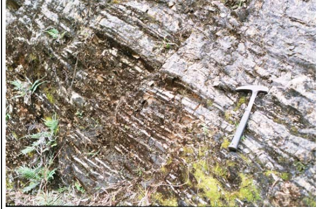
FOTO 33 - Ponto 7A UTM 712.404 mN x 7.284.034 mN - 689 m: "skarnito" em meio à espessa camada de solo vermelho argiloso, residual de rochas calcárias; o "skarnito" mostra alternância de camadas silicosas e marmorizadas, dispostas segundo a direção N50°E; vert.

FOTO 32 - Ponto 104 UTM 693.615 mE x 7.277.139 mN - 219 m: detalhe do "skarnito" ilustrado na foto 12, mostrando nítido bandamento devido à alternância de camadas epidotizadas esverdeadas e quartzosas (mais claras).