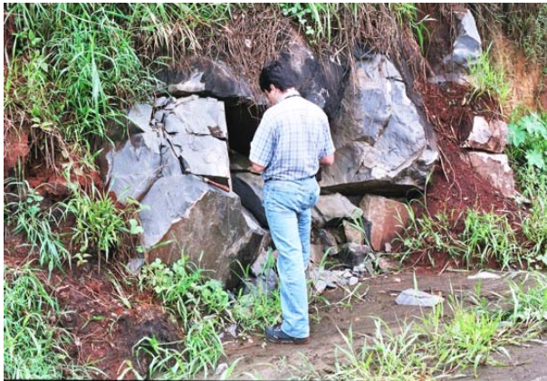
FOTO 45 - Ponto 36A UTM 702.237 mE x 7.271.609 mN – 187 m: quartzito muito fino aflorando na entrada para a UHE Tijuco Alto; tem nítida foliação na direção N90°E; 75°N.