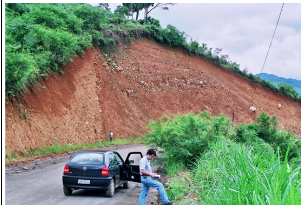
FOTO 25 - Ponto 54A UTM 678.027 mE x 7.251.557 mN - 446 m: filito sericítico rosado na estrada entre Cerro Azul e Tunas do Paraná; quando são, apresentam coloração cinzenta prateada; a foliação tem orientação N25°E; 70°NW.