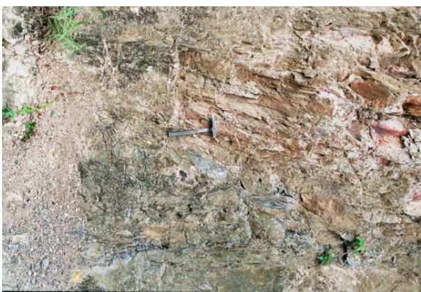
FOTO 39 - ponto 30 UTM 687.950 mE x 7.264.613 mN - 473 m: calcário com nítida foliação na direção N15°; 40°SE; o afloramento é capeado por solo residual argiloso vermelho, que ocorre também interpenetrado nos planos de foliação; a rocha é um mármore fino, cinza claro.