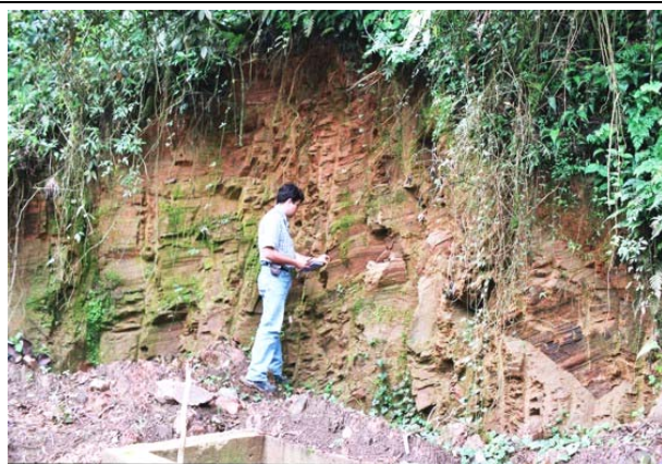
FOTO 20 - Ponto 26A UTM 701.515 mE x 7.267.066 mN - 332 m: movimento de massa em talude escavado em rochas metapelíticas alteradas, desencadeado ao longo de descontinuidades de fratura, sendo que a foliação mergulha para o interior do talude; a foliação tem direção N90°E; 30°S.