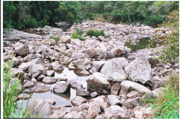
FOTO 12 - Ponto 104 UTM 693.615 mE x 7.277.139 mN -219 m: "skarnito" em contato com granito médio equigranular; o "skarnito" mostra nítido acamamento na direção N150°; 55°NE e tem camadas de quartzo branco intercaladas com camadas esverdeadas de calcário.