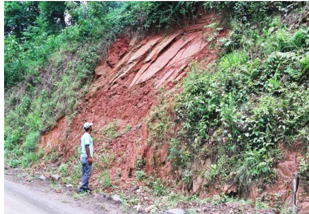
FOTO 22 - Ponto 28A UTM 702.655 mE x 7.267.981 mN - 258 m: dique máfico alterado (saprolito) concordante com a foliação de metapelitos encaixantes, na direção N50°E; 27°NW.