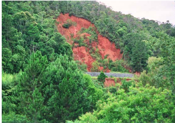
FOTO 14 - Ponto 12A UTM 708.677 mE x 7.282.773 mN -762 m: afloramentos e grandes matacões de granito nas encostas à distância.