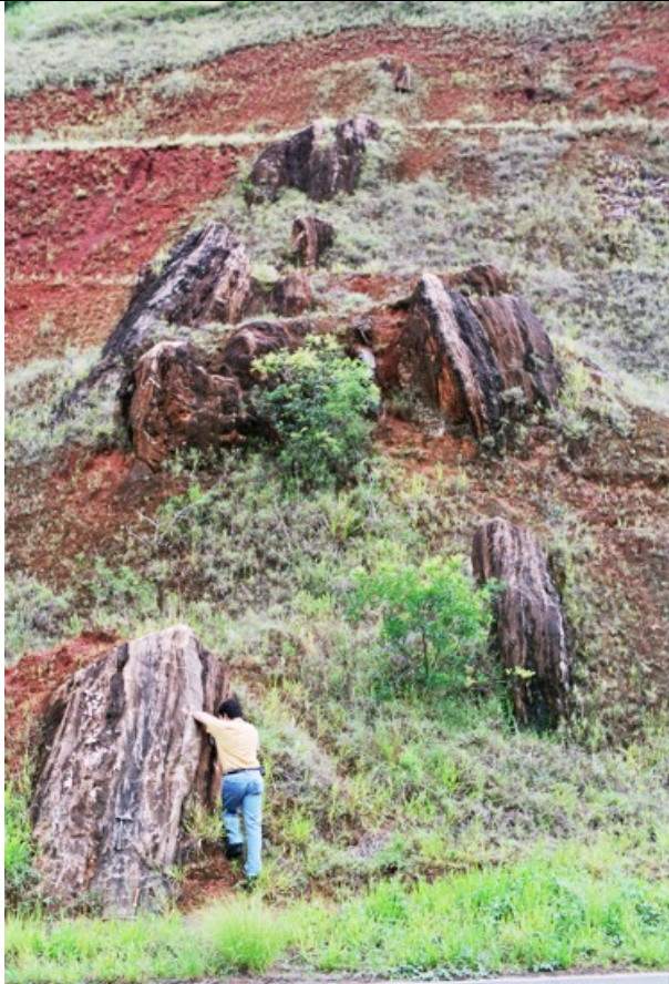
FOTO 34 - Ponto 16A UTM 704.142 mE x 7. 277.477 mN - 437 m: contato de granito, que aflora na base do corte, com metapelite encima, contendo veios de quartzo e injeções graníticas; a foliação do metapelite tem direção N40°E; 60°NW.

FOTO 33 - Ponto 7A UTM 712.404 mN x 7.284.034 mN - 689 m: "skarnito" em meio à espessa camada de solo vermelho argiloso, residual de rochas calcárias; o "skarnito" mostra alternância de camadas silicosas e marmorizadas, dispostas segundo a direção N50°E; vert.