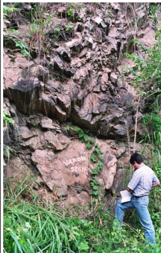
FOTO 30 - Ponto 1A UTM 716.287 mE x 7.285.712 mN - 893 m: rocha carbonática xistosa com foliação na direção N65°W; 45°SW; tem coloração cinzenta e torna-se esbranquiçada quando alterada.