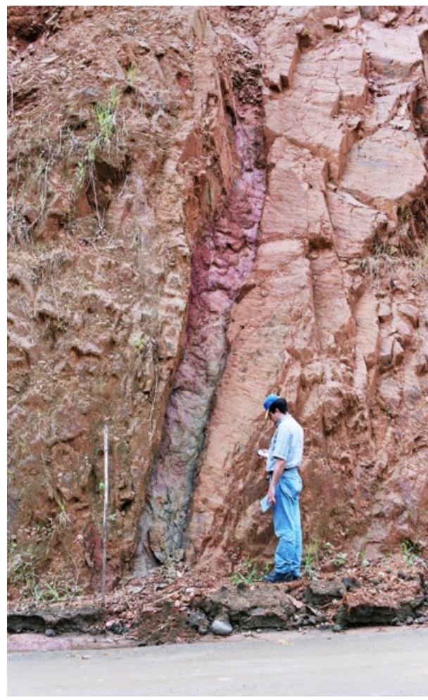
FOTO 24 - Ponto 31A UTM 703.384 mE x 7.268.802 mN - 242 m: espesso depósito rudáceo próximo a Adrianópolis recobrimdo "horst" com metapelitos alterados, distinguindo-se plano de falha ao lado do observador no pé do talude.