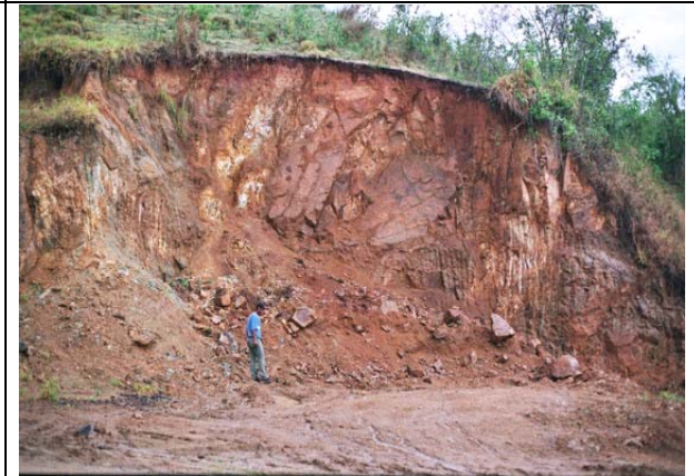
FOTO 7 - Ponto 100: UTM 686.254 mE x 7.280.422 mN -624m: vista seqüencial de grande saibreira em granito porfiróide saprolitizado, entrecortado por numerosos veios pegmatóides e aplíticos, que mergulham para a esquerda da seqüência fotográfica; local próximo a Itapirapuã.