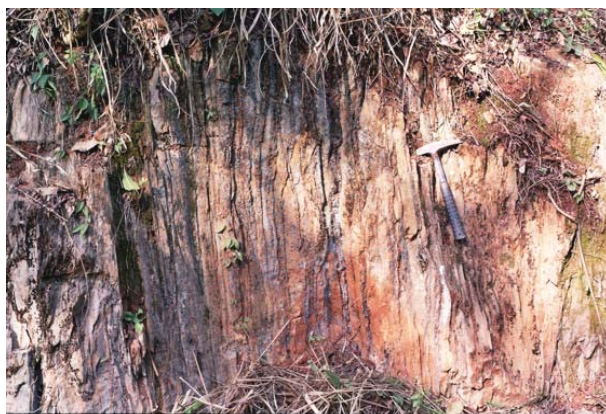
FOTO 29 - Ponto 38A UTM 699.156 mE x 7.273.563 mN - 228 m: calcário dobrado com eixo de dobramento na direção N80°E; 20°SE; acima do observador notam-se pequenas dobras.