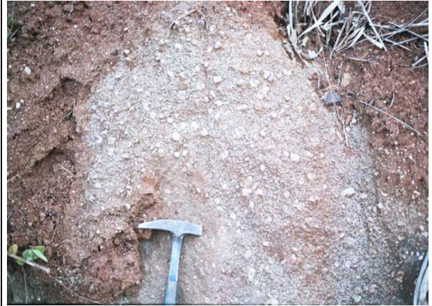
FOTO 03 - Ponto 5: UTM 674.862 mE X 7.252.056 mN – 332 m: corte em saprolito (saibro) de granito grosso com fenocristais de 2 cm de feldspato.

FOTO 02 - Ponto 95: UTM 699.505 mE X 7.273.749 mN – 228 m: granito grosso porfiróide saprolitizado, próximo a contato com granito fino a médio, equigranular, caulinizado.