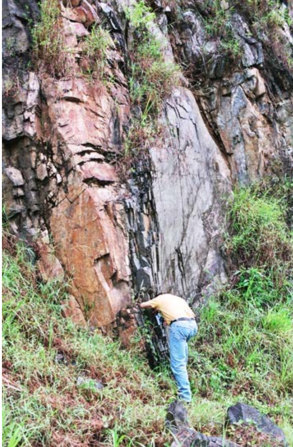
FOTO 36 - Ponto 34A UTM 692.520 mE x 7.276.586 mN – 261 m: calcário “skarnítico” com visível acamamento orientado segundo N65°E; 45°SE; as camadas são maciças e formam pacotes com 0,5 m ou mais de espessura.