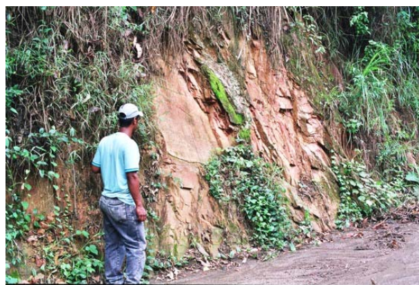
FOTO 18 - Ponto 22 UTM 686.582 mE x 7.260.880 mN - 651 m: metapelito alterado, sem mica, siltítico, com acamamento na direção N25°, mergulhando de 55° a 70° para SE.