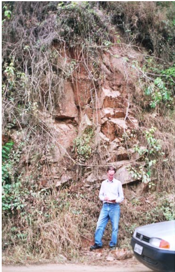
FOTO 02 - Ponto 95: UTM 699.505 mE X 7.273.749 mN – 228 m: granito grosso porfiróide saprolitizado, próximo a contato com granito fino a médio, equigranular, caulinizado.

FOTO 01 -Ponto 11: UTM 679.068 mE X 7.258.282 mN – 277 m: afloramentos de granito médio leucocrático, equigranular, passando a muito fino, com desenvolvido sistema de diáclases.