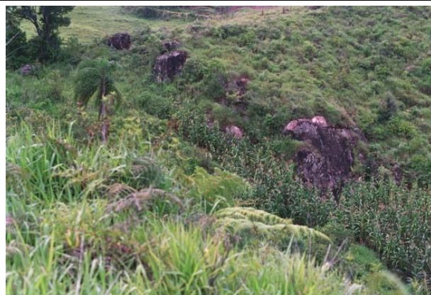
FOTO 16 - Ponto 34 UTM 688.708 mE x 7.266.591 mN - 243 m: filito muito diaclasado e clivado, com nítida foliação na direção N20°; 45°SE.