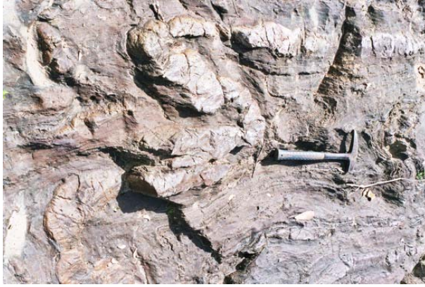
FOTO 32 - Ponto 104 UTM 693.615 mE x 7.277.139 mN - 219 m: detalhe do "skarnito" ilustrado na foto 12, mostrando nítido bandamento devido à alternância de camadas epidotizadas esverdeadas e quartzosas (mais claras).

FOTO 31 - Ponto 77 UTM 694.880 mE x 7.269.889 mN - 190 m: afloramento de quartzito muito duro e silicificado, fino, puro, sem mica, com veios dobrados de quartzo em "S"; tem foliação na direção N55°; 70°NW e aflora na margem esquerda do rio Ribeira.