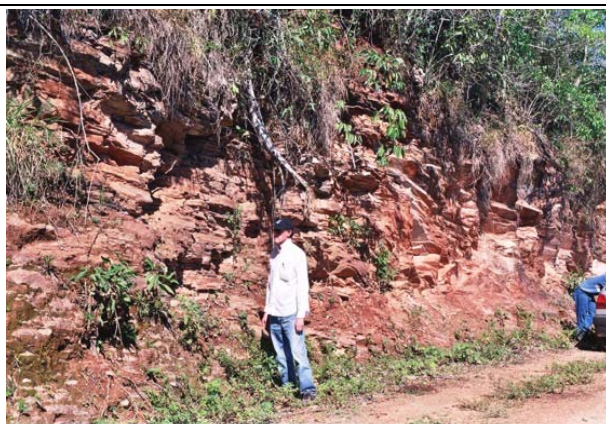
FOTO 27 - Ponto 63 UTM 695.225 mE x 7.269.501 mN - 195 m: calcário microcristalino cinza escuro, maciço, sem foliação visível; ao lado a rocha passa a cálcioxisto muito bem foliado na direção N50°; vert. (vide foto 28).