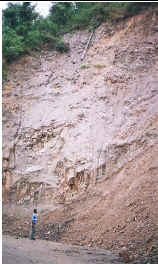
FOTO 06 - Ponto 19: UTM 683.556 mE x 7.259.697 mN -331m: exploração de saibro a partir de granito médio saprolitizado, com faixas de cisalhamento e desenvolvido sistema de diáclases.