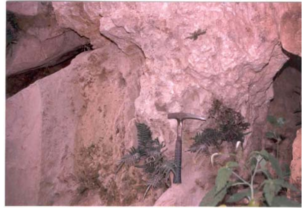
FOTO 04 – Vista de afloramento de rochas carbonáticas apresentando um fraturamento intenso, que possibilita a circulação de água e inicia o processo de dissolução das rochas em questão

FOTO 03 – Vista das dissoluções da rocha carbonática e cavernas geradas pelo processo de águas percolantes, localizadas próximas ao leito do rio ribeira, à montante do local da barragem