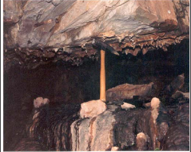
FOTO 03 – Vista das dissoluções da rocha carbonática e cavernas geradas pelo processo de águas percolantes, localizadas próximas ao leito do rio ribeira, à montante do local da barragem

FOTO 02 – Vista de abertura de caverna nos mármoreos localizados próximos à barragem, com circulação de água subterrânea efetiva, neste caso resultando na dissolução das rochas carbonáticas