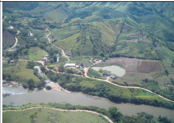
FOTO 215 – Estabelecimento rural com galpão e represa na margem do rio Ribeira – Aproveitamento Tijuco Alto.