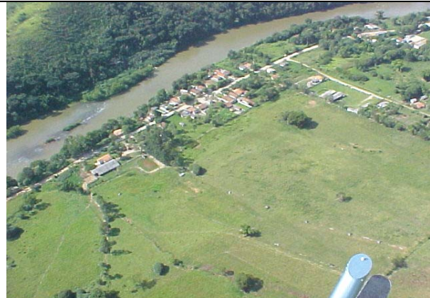
FOTO 227 – Ocupação próximo ao rio no remanso do aproveitamento de Itaóca.