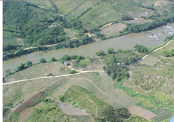
FOTO 221 – Ocupação na margem direita do rio Ribeira, moradia, galpão, plantio de citros. Aproveitamento Tijuco Alto.