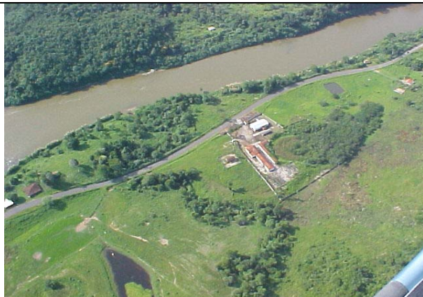
FOTO 238 – Estabelecimento rural ao longo da estrada que margeia o rio Ribeira/MD – aproveitamento Batatal