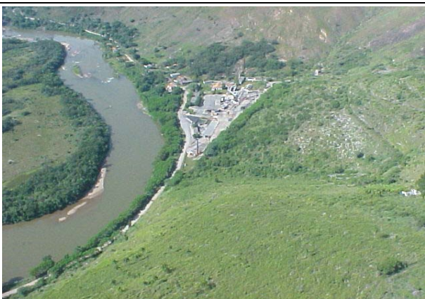
FOTO 230 – Antigas instalações da Plumbum – Aproveitamento Itaóca