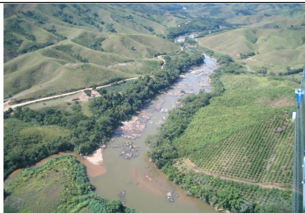
FOTO 214 – Área com cultura perene nas proximidades do rio Ribeira – Aproveitamento Tijuco Alto