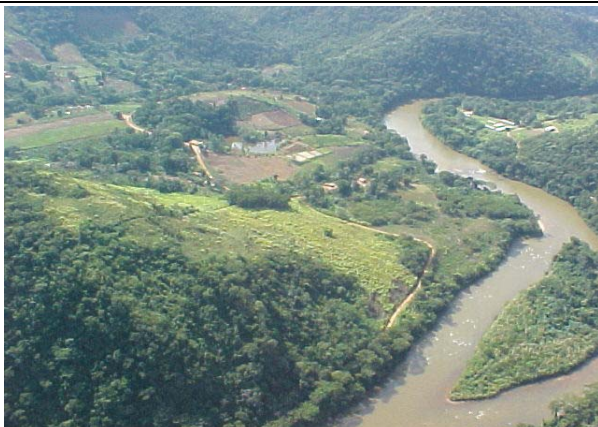
FOTO 222 – Bairro rural Ilha Rasa à esquerda – Aproveitamento Tijuco Alto