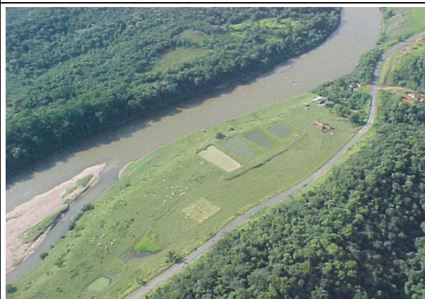
FOTO 239 – Estabelecimento rural – pastagem na margem do rio Ribeira/MD – aproveitamento Batatal