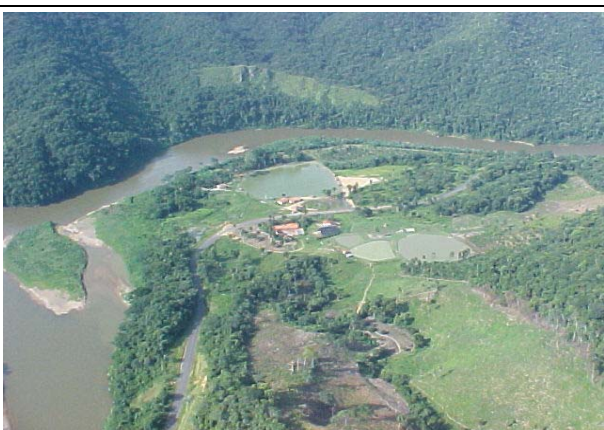
FOTO 242 – Ocupação na margem direita do rio Ribeira – aproveitamento Batatal