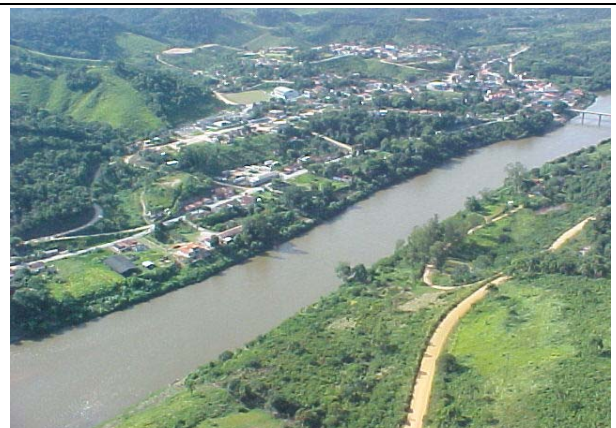
FOTO 234 – Vista aérea da cidade de Iporanga – remanso do aproveitamento Batatal