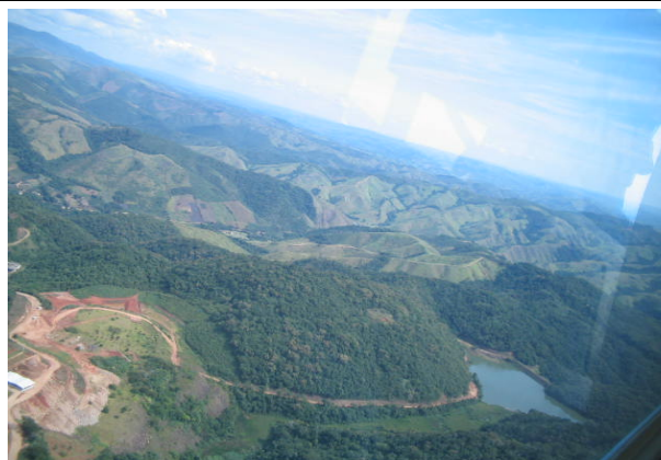
FOTO 212 – Aspectos da área de mineração de fluorita na região de Volta Grande, lagoa ao fundo – Aproveitamento Tijuco Alto