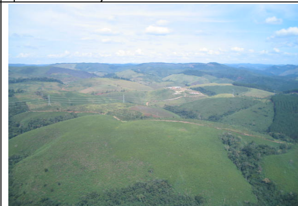
FOTO 209 – Aspecto da área de mineração de fluorita na região de Volta Grande em Cerro Azul – Aproveitamento Tijuco Alto