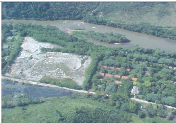
FOTO 229 – Área de rejeitos e vila abandonada da antiga mineração Plumbum. Aproveitamento Itaóca.