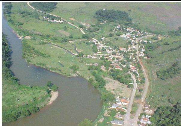
FOTO 226 – Adrianópolis, estrada em direção ao aproveitamento de Itaóca à esquerda. À direita estrada para Curitiba.