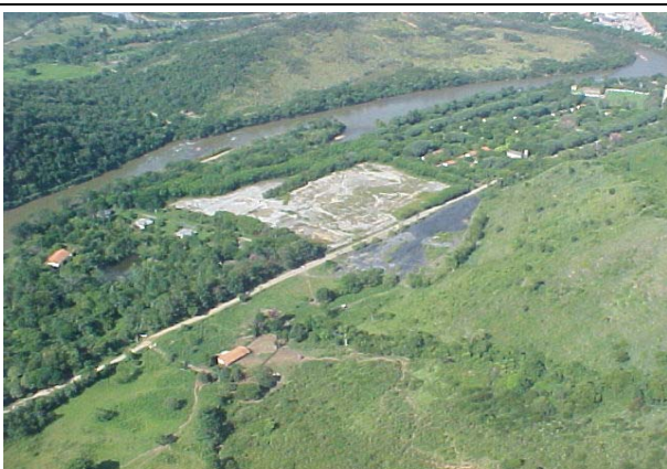
FOTO 228 – Área de rejeitos da mineração Plumbum – Aproveitamento Itaóca