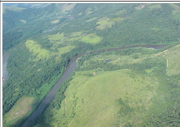
FOTO 233 – Rio Ribeira e Pardo, proximidades do local do eixo de Funil.