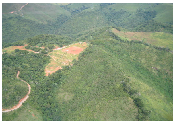
FOTO 208 – Mineração de fluorita na região de Volta Grande em Cerro Azul – Aproveitamento Tijuco Alto