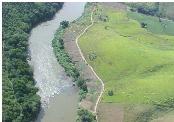
FOTO 220 – Pastagem plantada e agricultura de subsistência na margem direita do rio ribeira – aproveitamento tijuco alto.