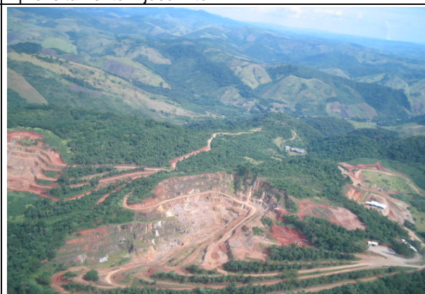
FOTO 211 – Aspecto da área de mineração de fluorita na região de Volta Grande em Cerro Azul – Aproveitamento Tijuco Alto