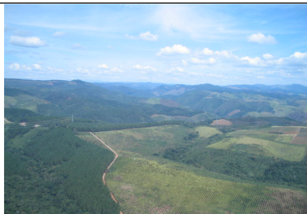
FOTO 210 – Reflorestamento com em terras altas nas proximidades do aproveitamento Tijuco Alto