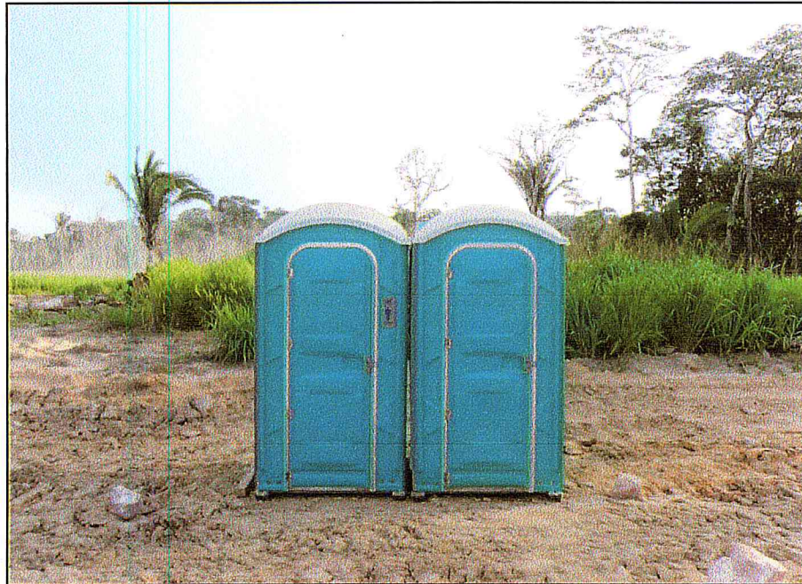
Banheiros químicos instalados na área do CTPFS