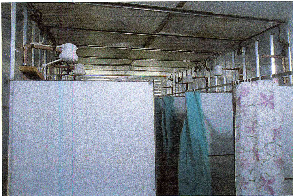
Chuveiros elétricos de uso coletivo

Cia. Hidrelétrica Teles Pires S/A. Praia do Flamengo, 78 – 1º andar – Sala 101 Flamengo – CEP. 22.210-030 Rio de Janeiro, RJ.