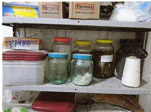
Anfíbios coletados que serão encaminhados à coleções científicas.

O CTPFS possui, adicionalmente a sua equipe técnica de resgate, médico veterinário e biólogos plantonistas para alimentar, medicar e manter os animais cativos sob supervisão constante. É nesse local que também ocorrem as marcações e demais procedimentos pré soltura.