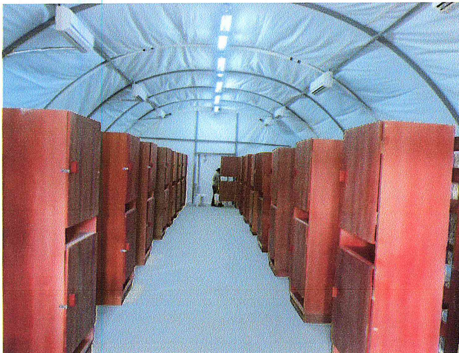
Dependências internas do alojamento.