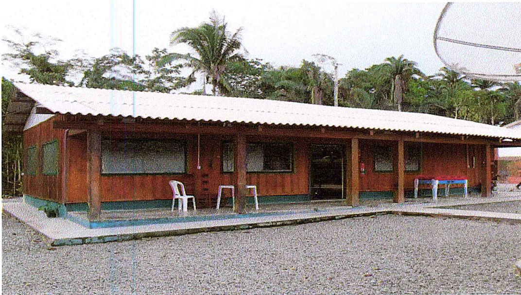
Alojamento Pousada Jerusalém, portas e janelas possuem telas de proteção