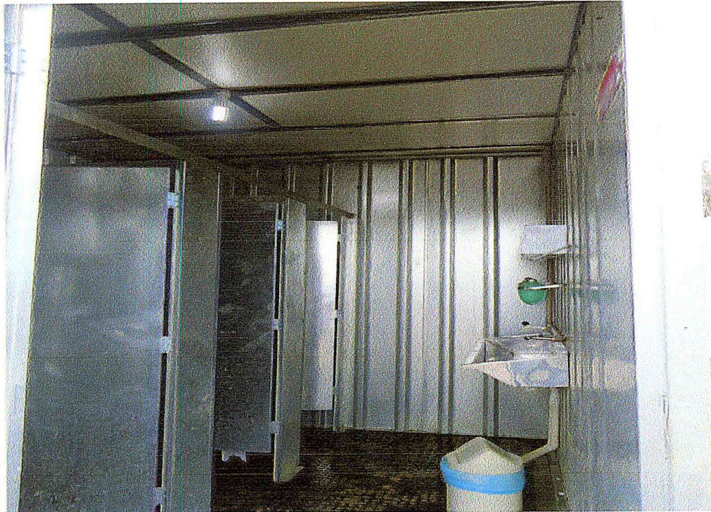
Banheiro de uso coletivo.