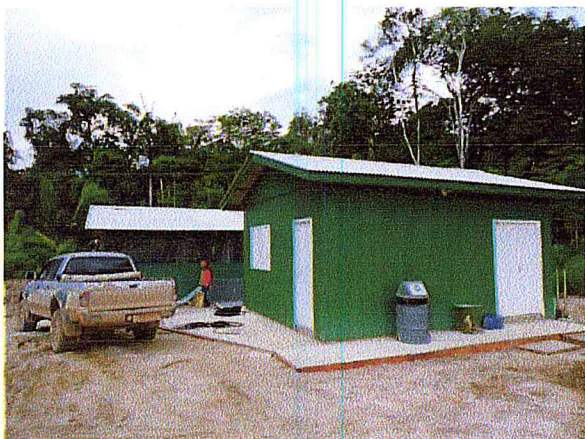
Fase final de instalação do CTPFS.

O Centro de Triagem Provisório de Fauna Silvestre, doravante nesse documento denominado CTPFS, encontra-se localizado em área adequada no canteiro de obras, nas coordenadas 21L X:520554 e Y:8968137. O local para a instalação foi selecionado a partir de características tanto naturais como de origens antrópicas, apropriado para a recuperação dos animais que estejam sob observação.