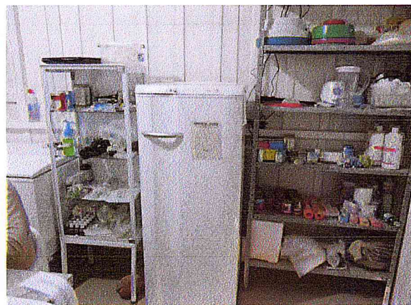
Local para armazenamento de materiais ambulatoriais.