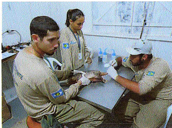
Equipe veterinária em atendimento a animal ferido.

Sendo assim, certo de termos comprovado a instalação e operacionalidade do CPTFS conforme previsto no Programa de Resgate e Salvamento Científico da Fauna Silvestre, nos colocamos a disposição para quaisquer esclarecimentos adicionais que se façam necessários.