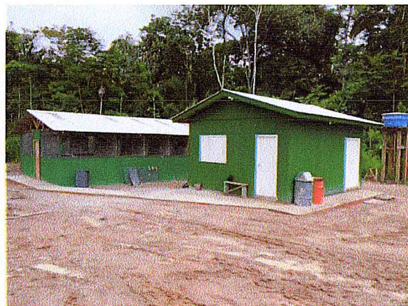
CTPFS concluído, incluindo recintos de quarentena.

Atualmente o CTPFS apresenta-se em pleno funcionamento, onde são realizadas diariamente atividades como triagem, quarentena, procedimentos médico-veterinários além da estocagem de materiais e exemplares coletados. O Centro possui infra estrutura adequada à boa condução das atividades e condições de trabalho, com bancadas, mesa cirúrgica, pias, prateleiras entre outras coisas.