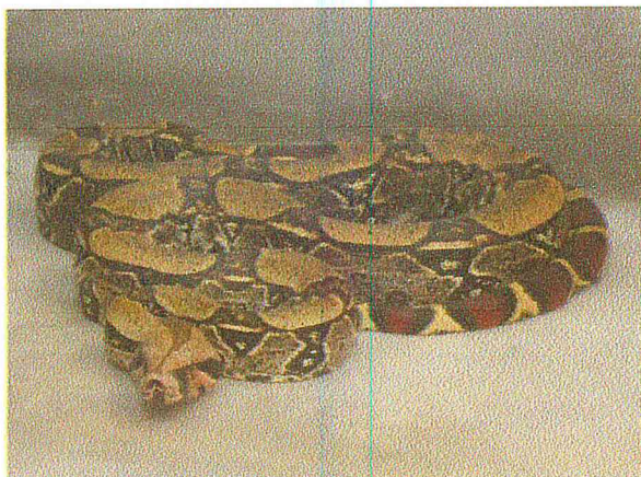
Boa constrictor sob observação em recinto de quarentena.

O CTPFS possui, adicionalmente a sua equipe técnica de resgate, médico veterinário e biólogos plantonistas para alimentar, medicar e manter os animais cativos sob supervisão constante. É nesse local que também ocorrem as marcações e demais procedimentos pré soltura.