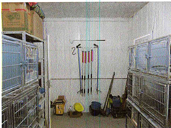
Depósito de equipamentos e materiais de contenção.