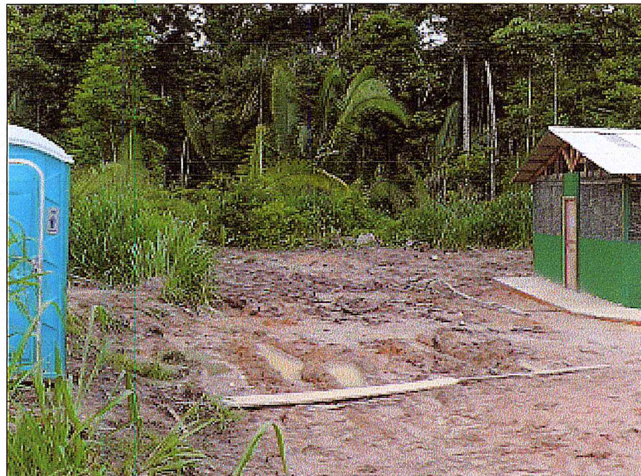
Registro mostrando a proximidade de um dos banheiros do CTPFS