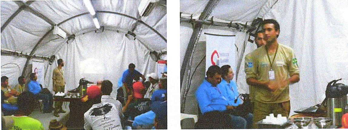
Figura 03: Palestra com equipes de supressão vegetal explicando procedimentos de resgate de fauna e resgate de abelhas em ocos de árvores.