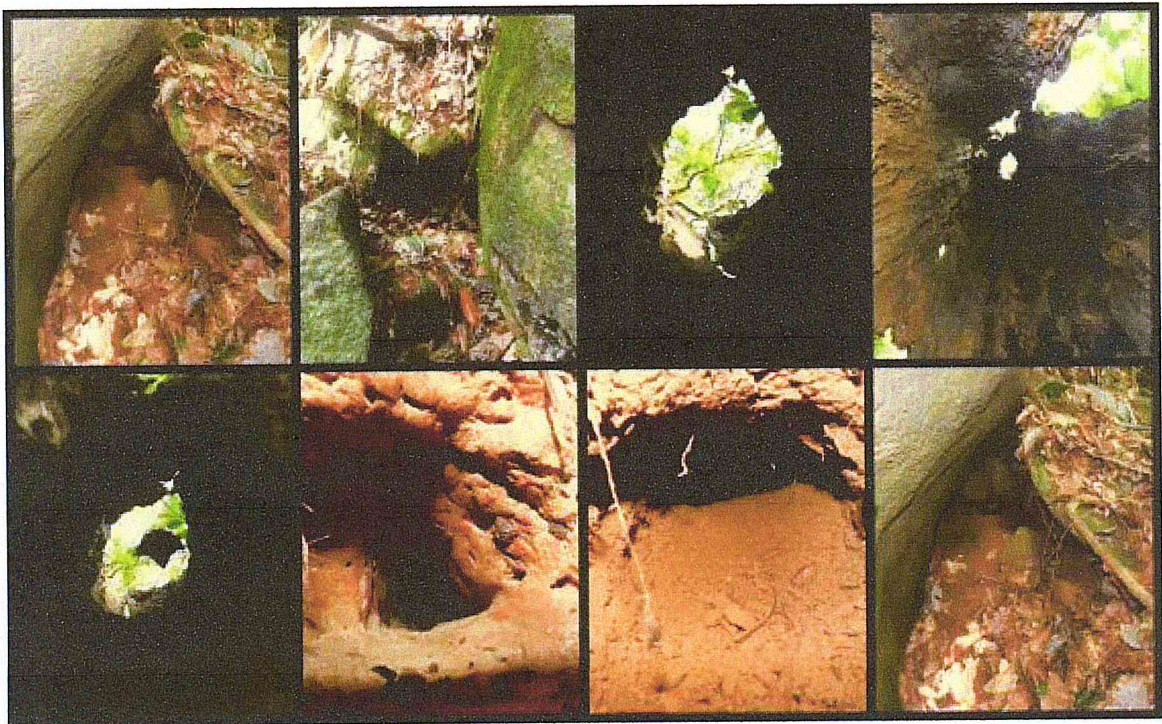
Figura 04: Intensificação na busca por abrigos em cavidades entre afloramentos rochosos, ocos de árvores e cavidades no solo nas futuras áreas a serem suprimidas.