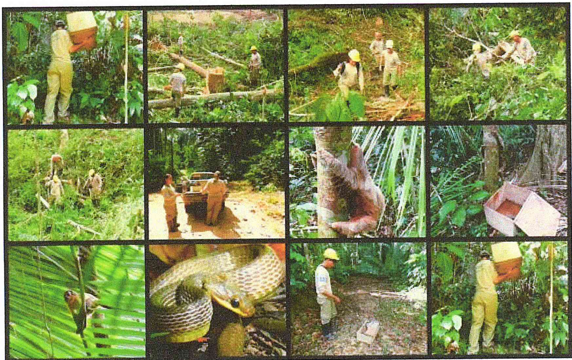
Figura 02: Intensificação nas atividades de busca ativa, captura, soltura da fauna silvestre, acompanhamento da supressão vegetal, pré-afugentamento de grupos de primatas e a retirada dos animais silvestres de campo em menor tempo para posterior atendimento médico veterinário.