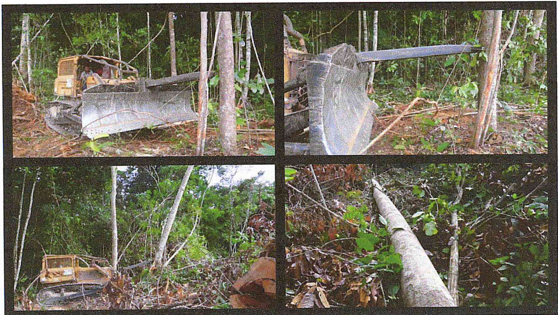
Figura 1: Ilustração da prática operacional na derrubada de espécies arbóreas, sem ocorrência de danos ao fuste.