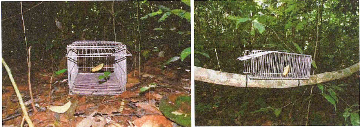
Figura 05: Montagem das armadilhas Tomahawk com iscas atrativas para captura nas futuras áreas a serem suprimidas.