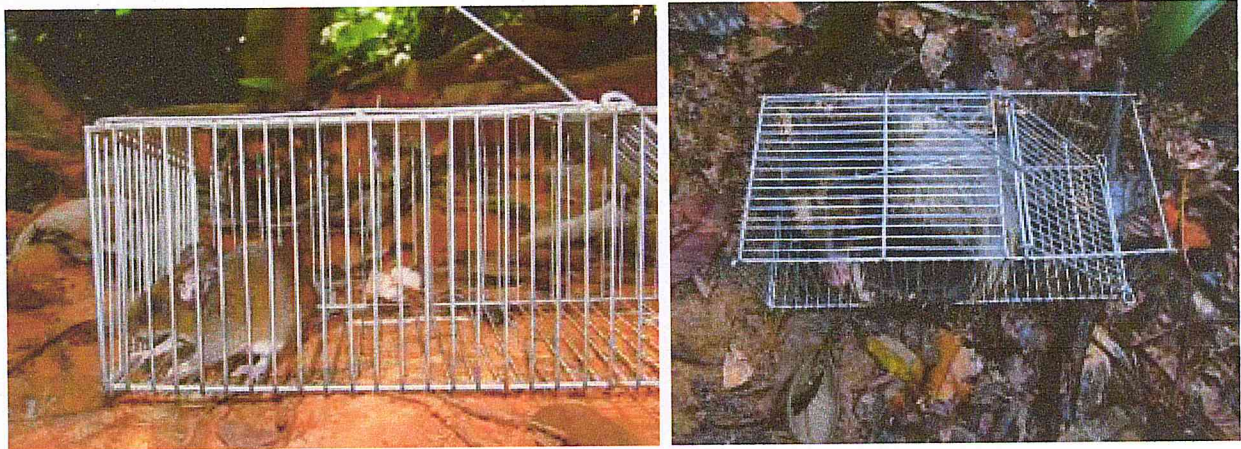
Figura 06: Registro de captura através das armadilhas Tomahawk nas futuras frentes a serem suprimidas.