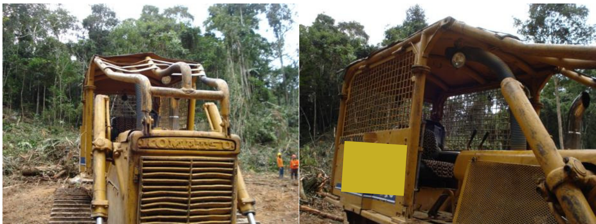
Cabine reforçada oferece mais segurança ao operador