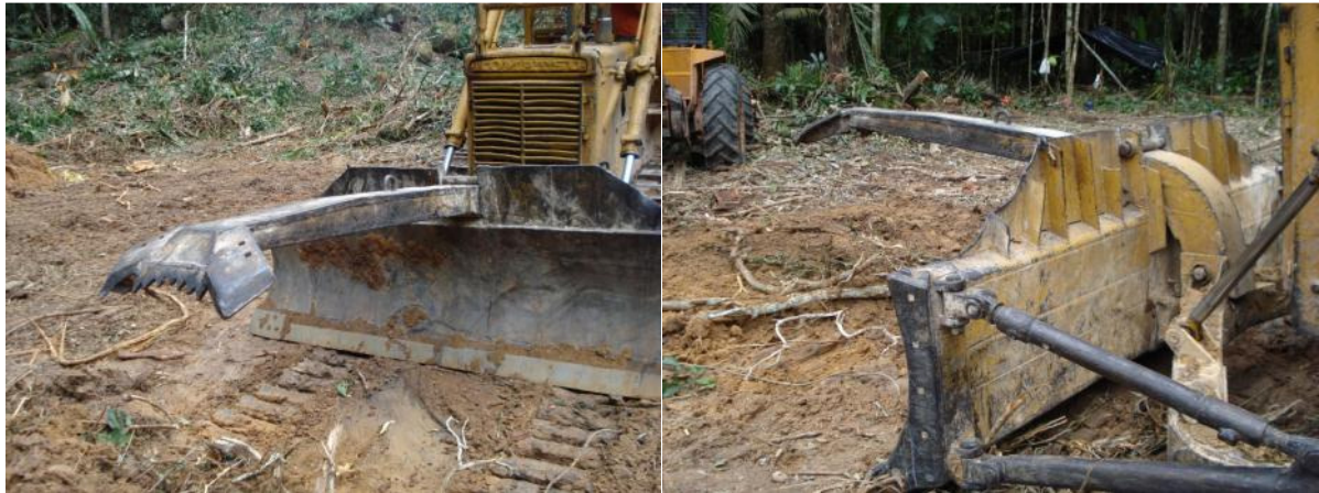
Trator de Esteira adaptado com bico de pato.