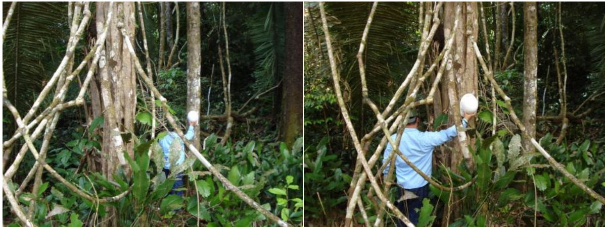
Grande presença de indivíduos arbóreos com DAP \leq 45 cm e emaranhado de cipós dificultando o bosqueamento e promovendo condições inseguras para os operadores de motosserras.