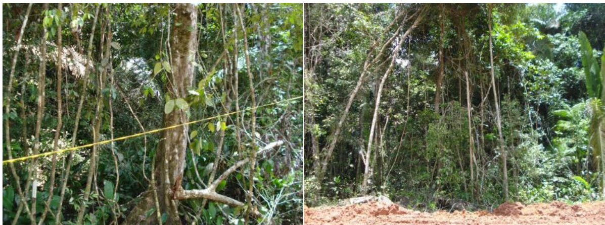
Densidade elevada de indivíduos arbóreos com DAP \leq 45 cm e presença de muitos cipós.