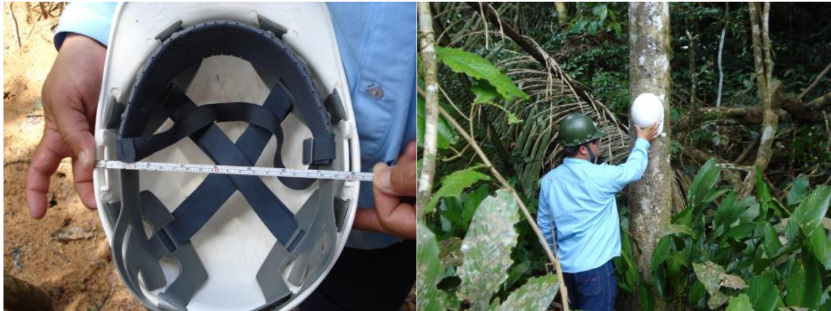
Referência utilizada como escala. Capacete de segurança com 20 cm.