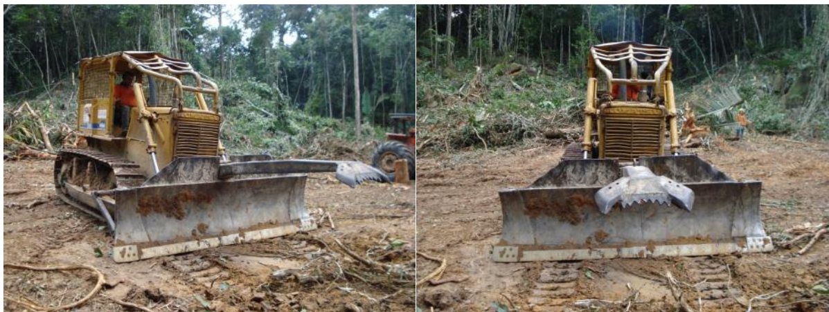
Trator de Esteira com bico de pato e cabine reforçada possibilita a derrubada individual de indivíduos arbóreos e garante mais segurança ao operador do equipamento.