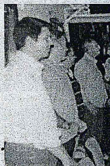
Membros da Ame Peixe e a secretária

“Não há hotel pesqueiro nem emprego que sobreviva sem que o meio ambiente esteja em condições adequadas para o desenvolvimento das várias espécies de peixes. Dado ao tempo necessário para que um peixe cresça e atinja tamanho para atrair o turista, a sua soltura é uma das bases fundamentais para que a pesca esportiva cresça e se estabeleça de forma sólida e duradoura”, define a secretária