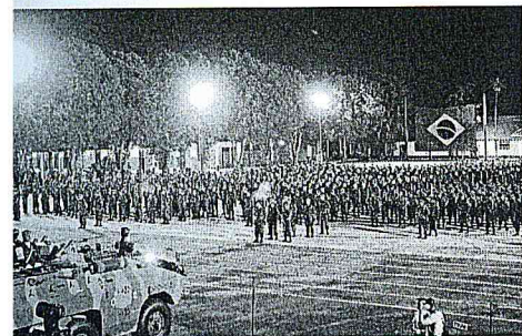
Comandante reuniu tropas de 2 mil soldados lotados em 10 quartéis

Segundo o general Peixoto, comandante da 8ª Região Militar, o Dia do Soldado faz alusão à data de aniversário de Luís Alves de Lima e Silva, o Duque de Caxias, patrono do Exército Brasileiro. Segundo o General, "Duque de Caxias foi o maior soldado que o Exército já produziu e deve ser exemplo e inspiração para os soldados. Ele não foi apenas um grande soldado, foi um grande cidadão brasileiro", destacou.