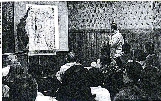
Mapa aponta as áreas onde será preciso maior atenção