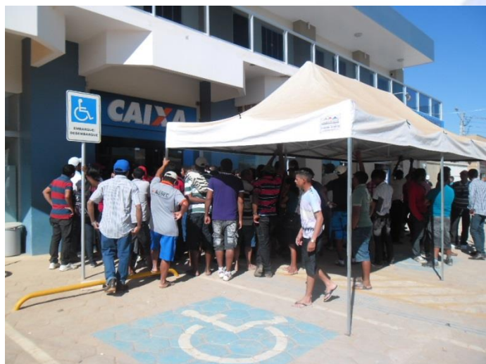
Figura 03: Monitoramento do dia de pagamento.