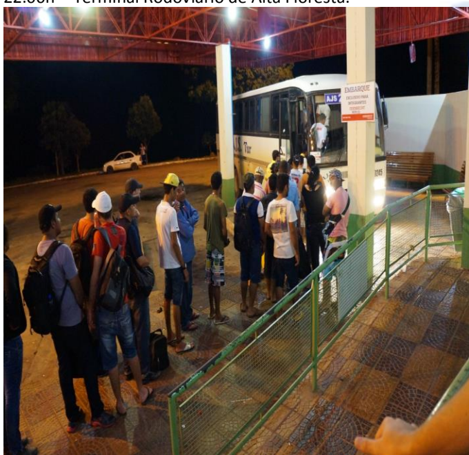
Figura 07: Monitoramento Embarque dos Colaboradores – 22:00h - Terminal Rodoviário de Alta Floresta.