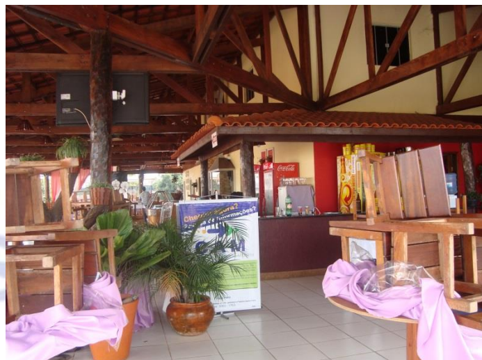
Figura 02: divulgação do CAM – Restaurante Laços e Abraços.