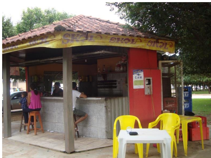
Figura 01: Divulgação do CAM