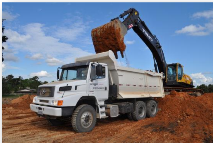
Figura 14 Módulo Técnico - Turma de Motorista de Caminhão Basculante interagindo com a Turma de Escavadeira