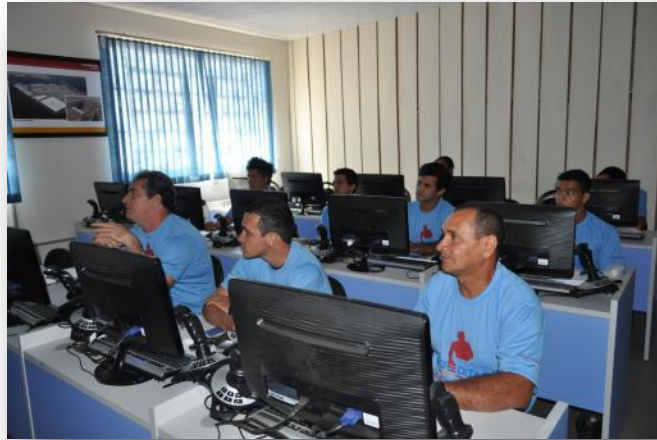
Figura 11 Módulo Técnico - Aulas nos simuladores de equipamentos pesados