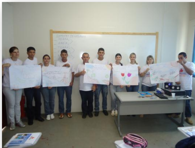
Figura 4 Apresentação de trabalhos no Módulo Básico