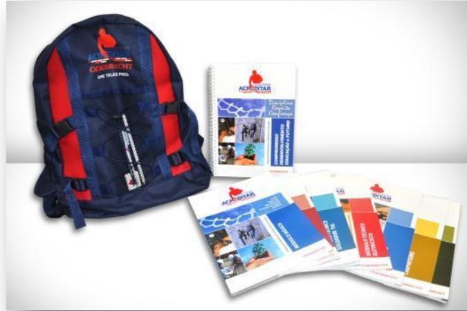
Figura 1 Material Didático do Programa Acreditar