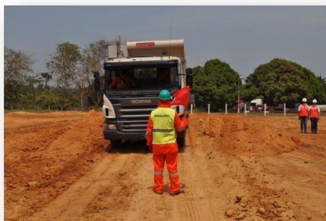
Figura 16 Módulo Técnico - Turma de Sinaleiro de Terraplanagem