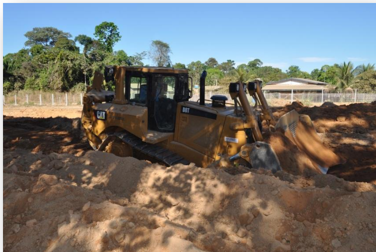
Figura 15 Módulo Técnico - Turma de Operador de Equipamentos (Trator de esteira)