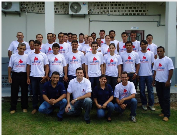
Figura 5 Turma do Módulo Básico com equipe pedagógica