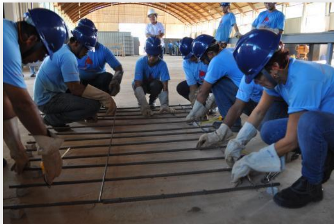
Figura 7 Módulo Técnico - Turma de Armador