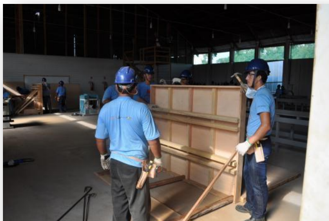
Figura 8 Módulo Técnico - Turma de Carpinteiro