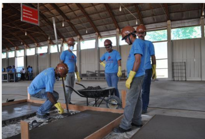
Figura 6 Módulo Técnico - Turma de Pedreiro