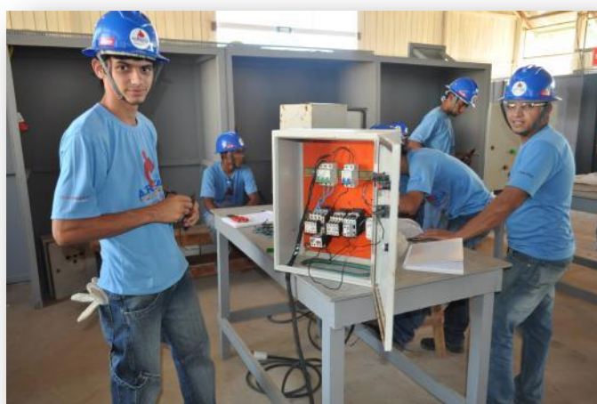
Figura 10 Módulo Técnico - Turma de Eletricista