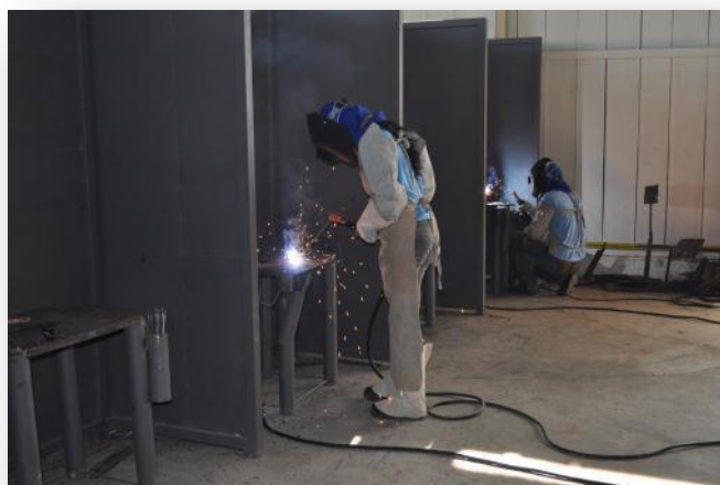
Figura 9 Módulo Técnico - Turma de Soldado