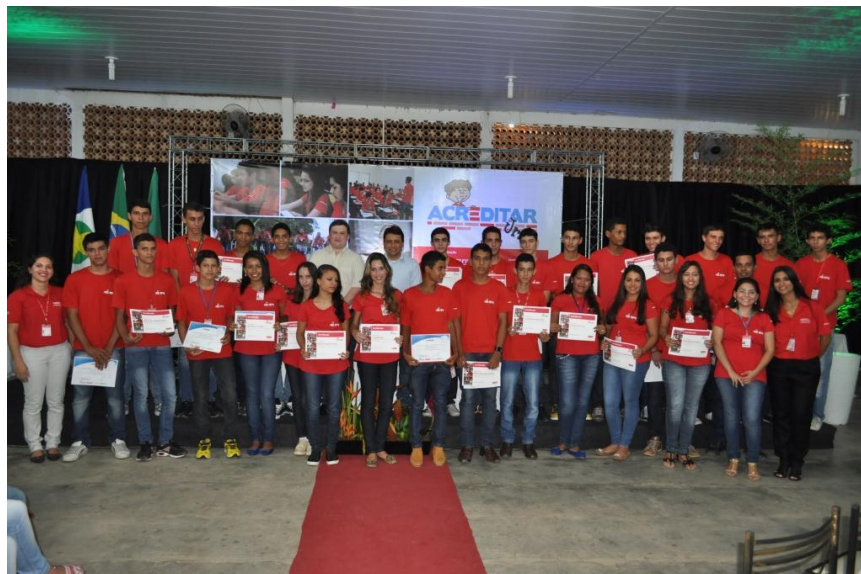
Figura 18 Acreditar Jr. - Formandos