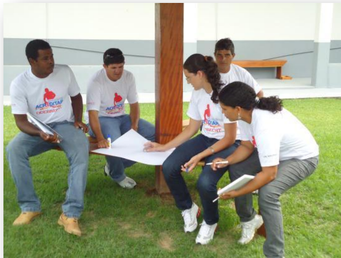
Figura 3 Trabalho em grupo no Módulo Básico