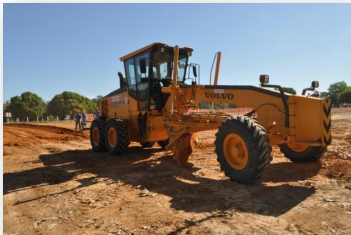
Figura 13 Módulo Técnico - Aulas de Operador de Equipamentos (Motoniveladora)