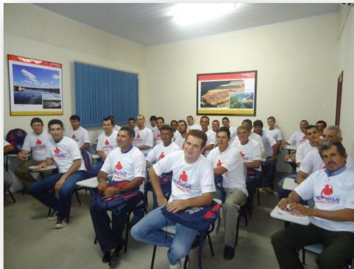
Figura 2 Aulas do Módulo Básico