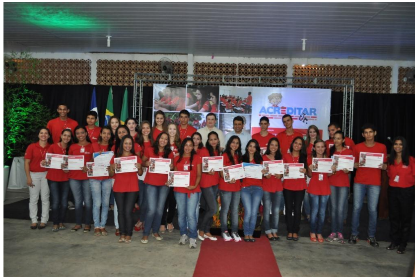
Figura 17 Acreditar Jr. - Formandos