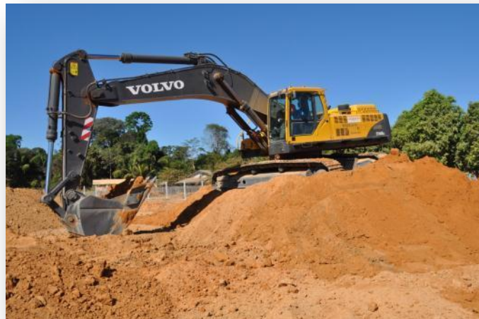
Figura 12 Módulo Técnico - Turma de Operador de Equipamentos (Escavadeira)