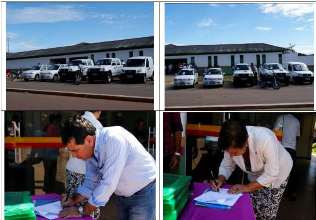
08/03/2012 - Solenidade de entrega de contemplados pelo Subprograma de Compensação Financeira - Programa de Reforço a Infraestrutura e aos Equipamentos Sociais (P.36) no município de Paranaíta/MT.