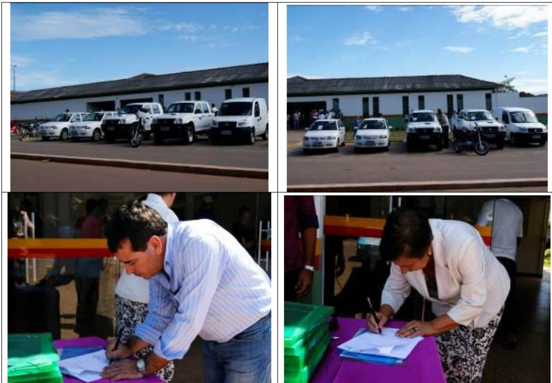
08/03/2012 - Solenidade de entrega de contemplados pelo Subprograma de Compensação Financeira - Programa de Reforço a Infraestrutura e aos Equipamentos Sociais (P.36) no município de Paranaíta/MT.