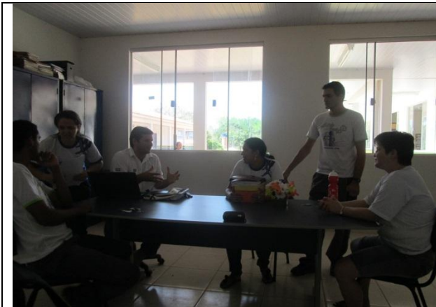
Foto 1 – Acompanhamento Escola Municipal Cristo Redentor – 05/09/13 – Paranaíta/MT