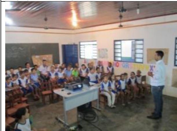
Foto 3 – Oficina de Organização Social Escola Municipal Cristo Redentor – 22/04/14 – Paranaíta/MT