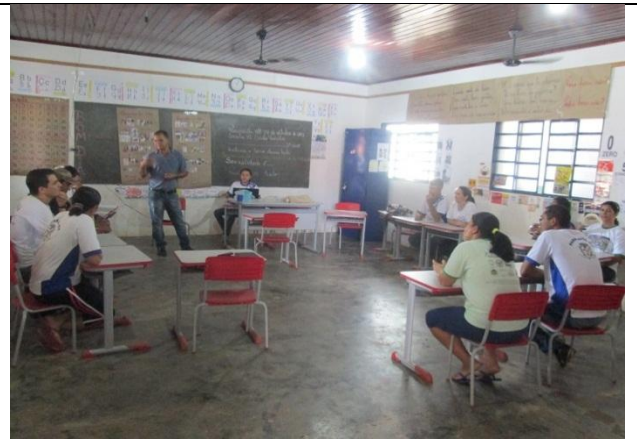
Foto 2 – Acompanhamento Escola Municipal Cristo Redentor – 10/10/13 – Paranaíta/MT