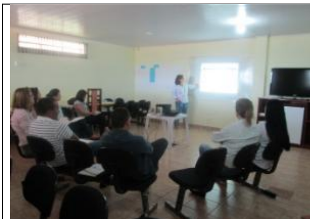
Foto 1 – Participantes módulo I - curso Gestão de Resíduos Sólidos em Alta Floresta - MT