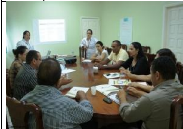
Foto 5 – Participantes módulo II - curso Gestão de Resíduos Sólidos em Alta Floresta - MT