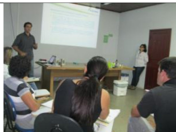
Foto 4 – Apresentação do projeto do aterro sanitário para Paranaíta contratado pela CHTP - Módulo 2