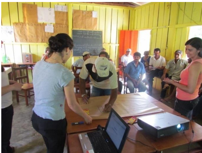
Comunidade Rio Jordão - Assentamento de São Pedro