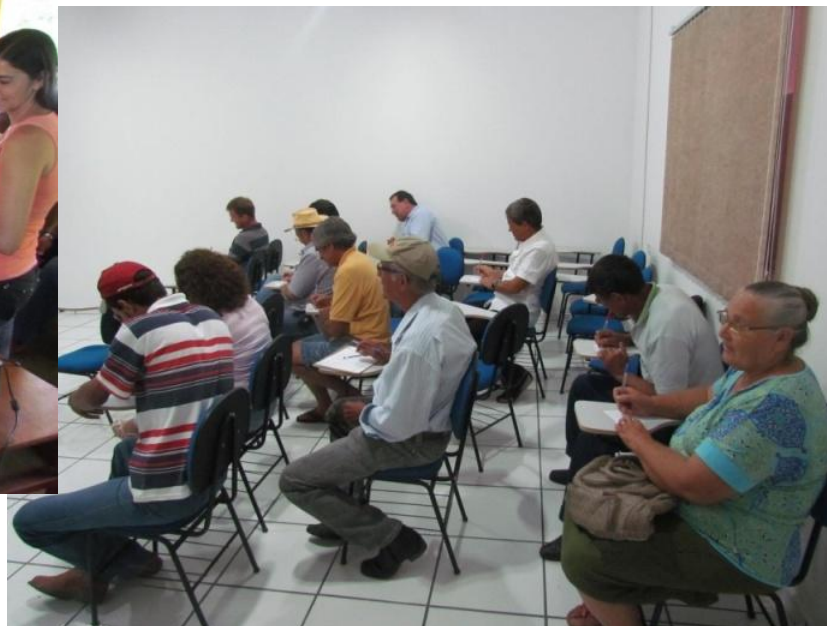
Proprietários de terras