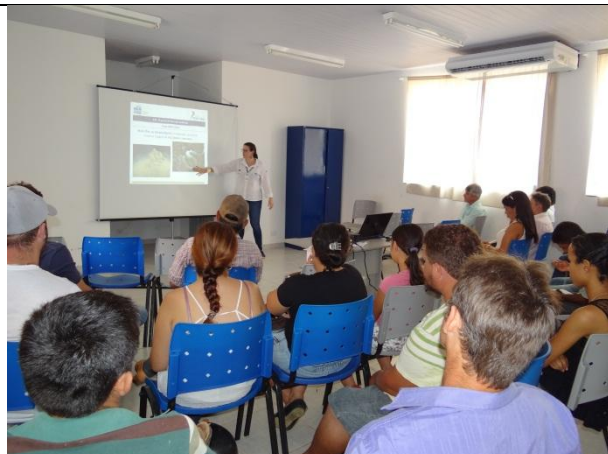
Foto 02 – Apresentação sobre técnicas de recuperação florestal realizada durante a Oficina de Proteção e recuperação de Mata Ciliar-Assentamento São Pedro/Paranaíta – 12/09/15