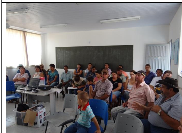
Foto 03 – Agricultor do assentamento tirando dúvidas durante a Oficina de Proteção e Recuperação de Mata Ciliar-Assentamento São Pedro/Paranaíta – 12/09/15