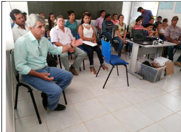
Foto 01 – Participantes da Oficina de Proteção e Recuperação de Mata Ciliar/Assentamento São Pedro/Paranaíta – 12/09/15