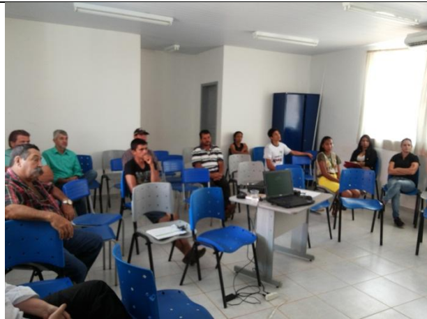
Foto 15 – Oficina de “Gerenciamento Eficiente da Unidade Produtora” Assentamento São Pedro - Paranaíta 07/11/15