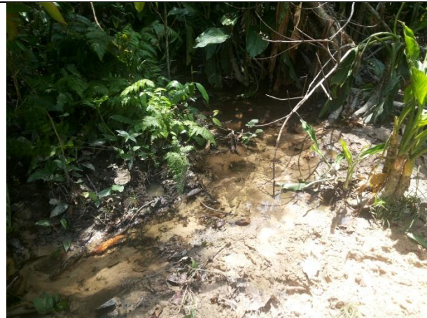
Foto 06 – Visita a uma área de pastagem de gado de corte na propriedade do Sr. Francisco Passos Assentamento São Pedro- Paranaíta 30/10/15