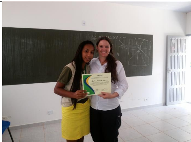
Foto 17 – Entrega de certificado a aluna do Com-Vida pela participação nas Oficinas de Proteção e recuperação de Mata Ciliar Assentamento São Pedro - Paranaíta 07/11/15