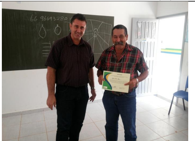
Foto 18 – Entrega de certificado ao produtor rural pela participação nas Oficinas de Proteção e recuperação de Mata Ciliar Assentamento São Pedro - Paranaíta 07/11/15