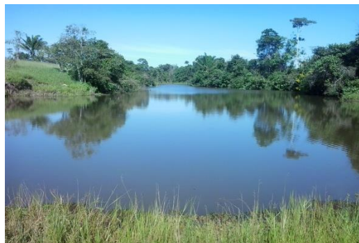
Figura 4 - LOCAL DA NASCENTE