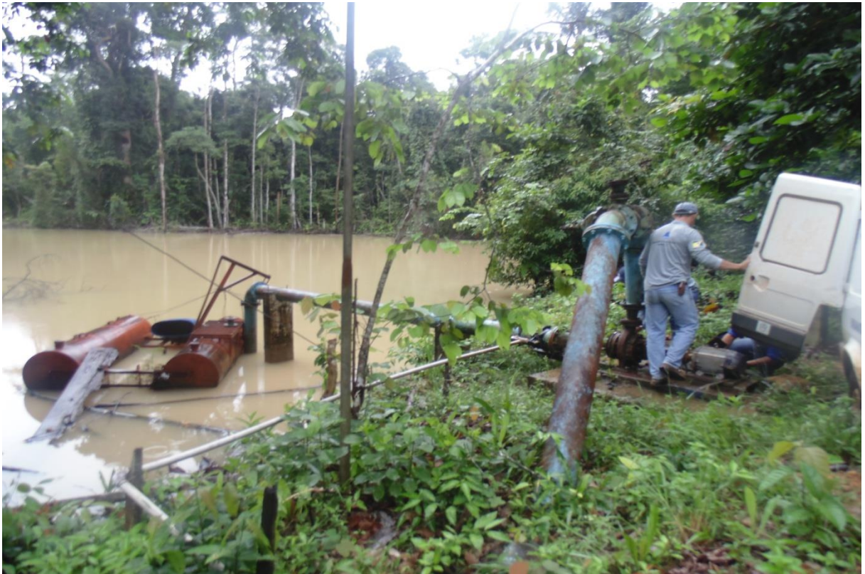
Figura 7 - CAPTÇÃO DE ÁGUA LOCAL 2