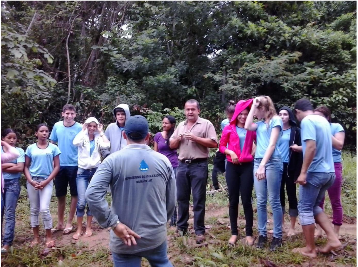
Figura 6 - VISITA AO DAE