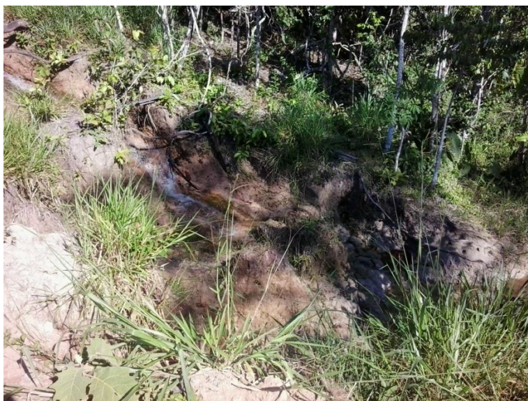
Figura 1 - LOCAL DA NASCENTE

O Projeto REPENSAR, REVER E RECUPERAR tem como destaque a importância do esforço coletivo entre comunidade e poder público para a recuperação do patrimônio natural coletivo bem como a promoção a saúde pública. Preocupa-se em demonstrar como é de suma importância à recuperação que será realizada na nascente do Rio