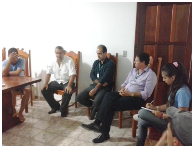
Figura 5 - REUNIÃO ENTRE ALUNOS E GOVERNANTES

A prefeitura municipal de Paranaíta em parceria com a Escola Estadual João Paulo I serão responsáveis pela execução do projeto, comprometendo-se, em conformidade com a legislação vigente, a realizar o gerenciamento técnico e acompanhamento das atividades, fornecimento de serviços de apoio, viabilização de mão de obra, fornecimento de Equipamentos de Proteção Individual (EPI) aos trabalhadores do campo, fornecimento de insumos, prestação de contas, emissão de relatórios de monitoramento e acompanhamento. O responsável técnico pelo projeto e pela execução do