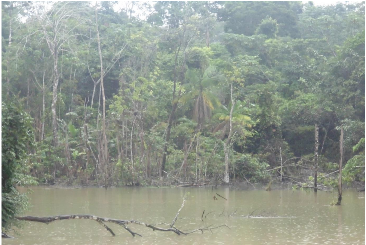
Figura 8 - RIO PINGUIM