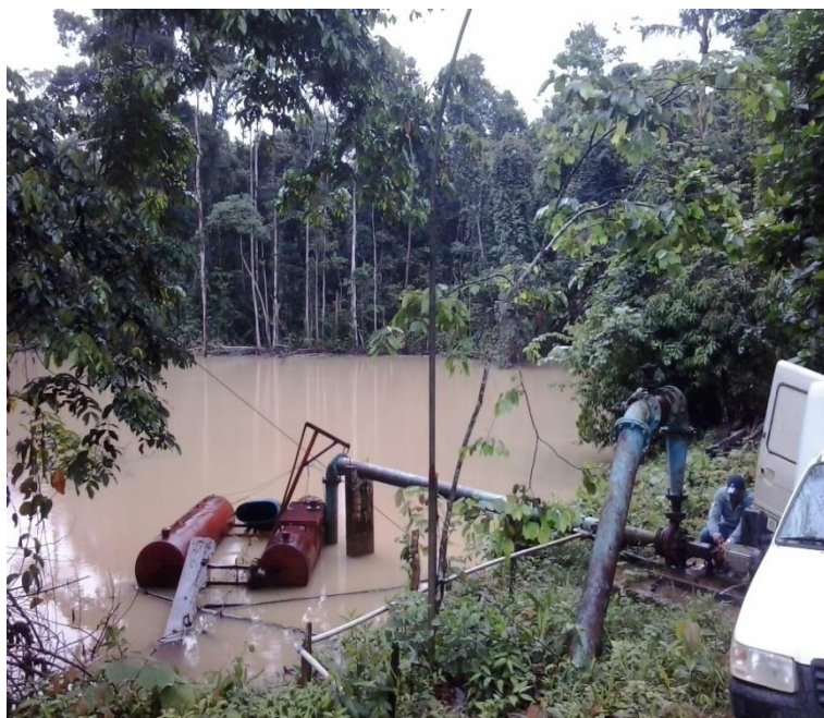
Figura 2 - CAPTÇÃO DE ÁGUA (DAE)

Detectou-se então que o nível do reservatório, que até o momento sempre havia sido suficiente para o abastecimento municipal, começou a diminuir chegando