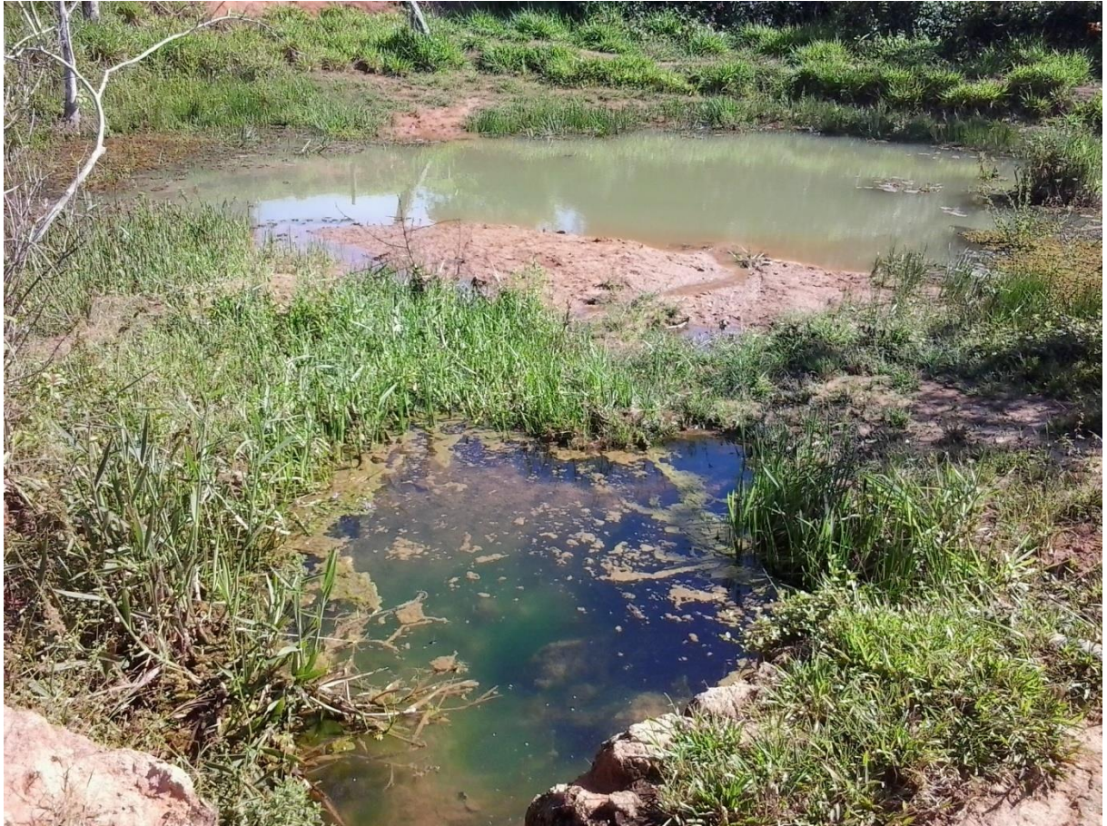
Figura 9 - LOCAL DA NASCENTE