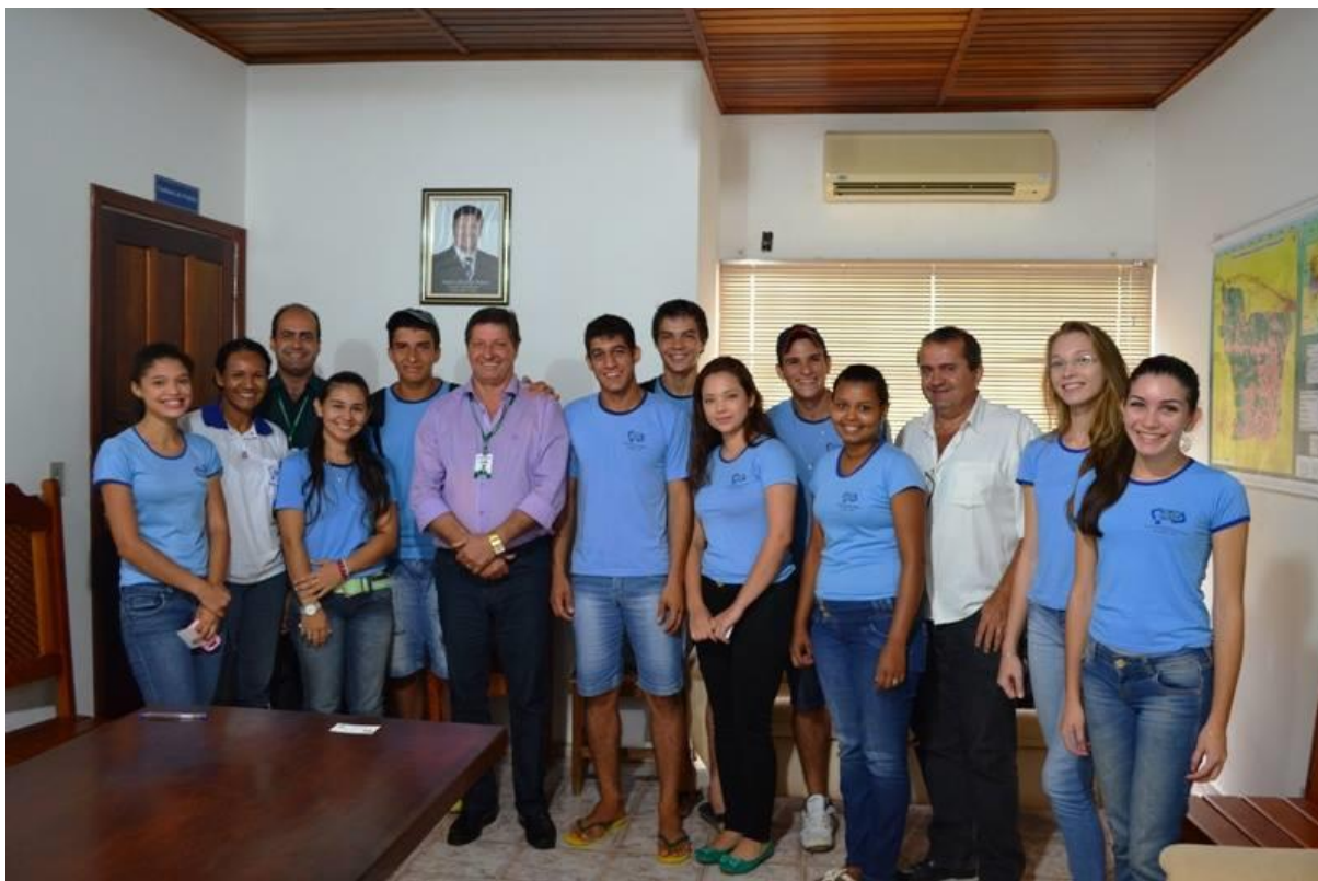
Figura 10- APOIO AO PROJETO 3R

Apoio da Prefeitura Municipal de Paranaíta – MT