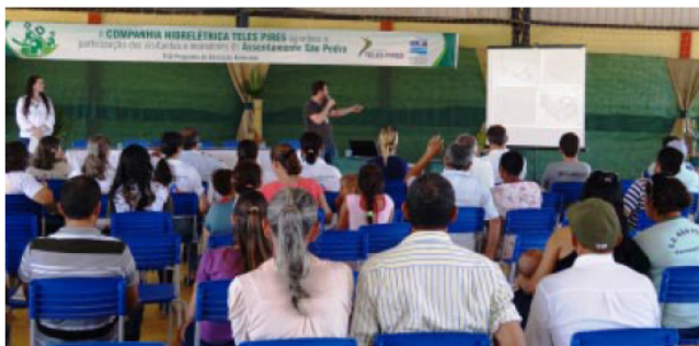
Diversas palestras foram ministradas aos moradores do Assentamento São Pedro

O 1º Seminário de Saúde e Meio Ambiente contou com a parceria da Escola Estadual São Pedro, escolas municipais Tancredo de Almeida Neves, Maria Quitéria e Cristo Redentor, Secretaria Municipal de Saúde de Paranaitá, agentes comunitários de saúde, posto do Programa Saúde da Família do assentamento e grupo Com-Vida.