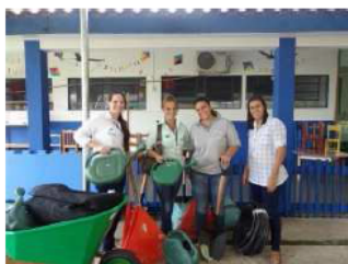
Horta recebe apoio

O município de Paranaíta acaba de receber uma carga de insumos agrícolas e materiais para jardinagem da Companhia Hidrelétrica Teles Pires (CHTP). Essa doação foi destinada ao projeto Hortaliças e Compostagem dos Resíduos Sólidos Orgânicos, desenvolvido no Centro de Educação Infantil Criança Feliz I, no município. O projeto acontece desde junho de 2014, e atende cento e trinta e sete crianças, entre sete meses a quatro anos.