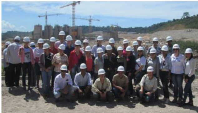
Professores saíram encantados do canteiro de obras e souberam mais sobre a usina