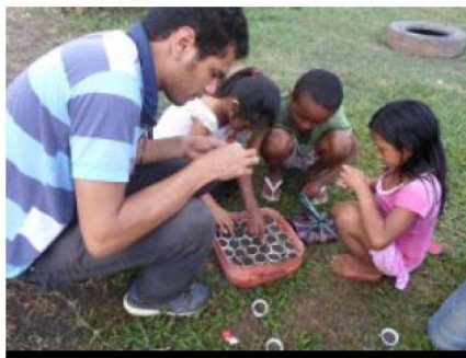
Alunos das escolas participam do projeto da CHTP

Em Jacareacanga, cerca de três mil alunos das escolas municipais Maria Emília e Carmem Valente e da escola estadual Haroldo Veloso, e 300 usuários do Centro de Referência de Assistência Social (CRAS), fazem parte do programa, que já instalou quatro hortas na região. As atividades são realizadas pelos estudantes e acom-