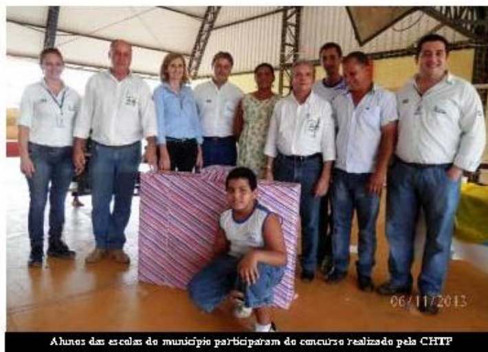
Alunos das escolas do município participaram do concurso realizado pela CHTP

sei em planta, pensei em ecologia e escolhi Eco Vida, estou muito feliz", disse o aluno.