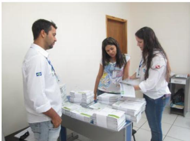
Objetivo é esclarecer a população sobre a estrutura dos serviços públicos de saúde