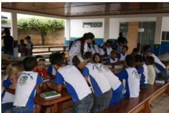
Ação é realizada

A Companhia Hidrelétrica Teles Pires, por meio do Programa de Educação Ambiental, desenvolve atividades em 19 escolas da rede pública de ensino de Alta Floresta, Paranaíta (MT) e Jacareacanga (PA). O projeto busca trabalhar de maneira multidisciplinar temas que envolvam ações e melhorias socioambientais nestes municípios. Até o final de 2014, cerca de 5 mil alunos e 200 professores irão participar das oficinas.