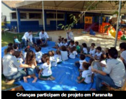
Crianças participam de projeto em Paranaíta