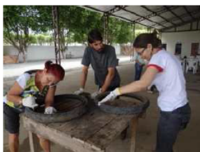
Curso foi oferecido no município

A Companhia Hidrelétrica Teles Pires (CHTP) realiza entre os dias 20 a 25 de outubro, o curso de reaproveitamento de pneus, no Parque de Exposição Mauro Zanette em Paranaíta. O objetivo é promover a conscientização ecológica, utilizando como ferramenta o ecodesign para a criação de produtos a partir de pneus usados. Outra meta é combater a proliferação do mosquito da dengue, através da reutilização desse material.