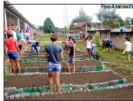
Ação envolve comunidade escolar

programa conta com o apoio da Secretaria Municipal de Agricultura e tem como objetivo ensinar a importância de uma nutrição saudável com o uso de alimentos orgânicos que podem ser produzidos em ambientes diversificados.