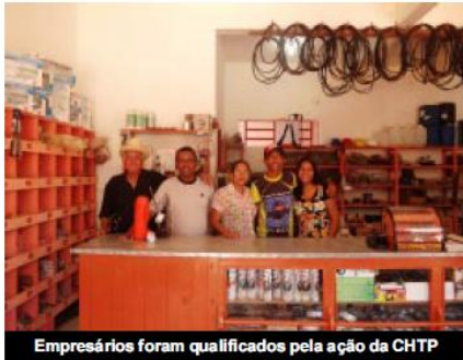
Empresários foram qualificados pela ação da CHTP

Assessoria Companhia Hidrelétrica Teles Pires