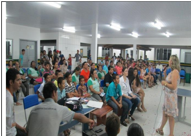
Foto 15- Abertura “Dia da Conquista” EM Maria Quitéria-Paranaíta- 09/12/14.