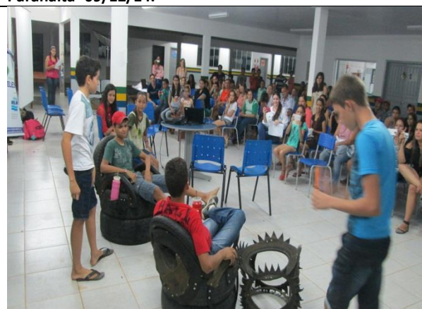
Foto 18 - Encenação peça teatral sobre a temática “lixo” - EM Maria Quitéria –Paranaíta- 09/12/14