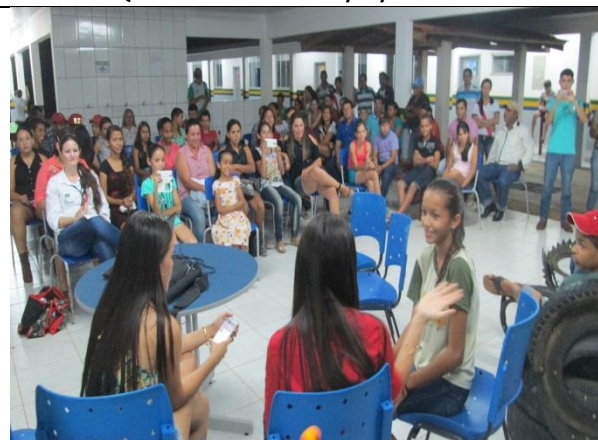
Foto 20- Encenação peça teatral sobre a temática “lixo” - EM Maria Quitéria –Paranaíta- 09/12/14