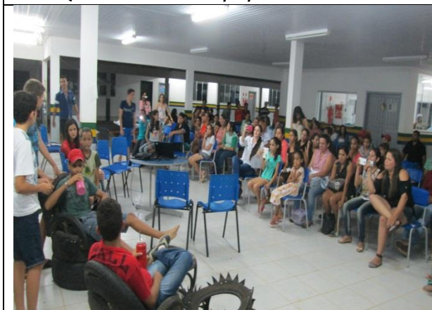
Foto 19 - Encenação peça teatral sobre a temática “lixo”- EM Maria Quitéria –Paranaíta- 09/12/14