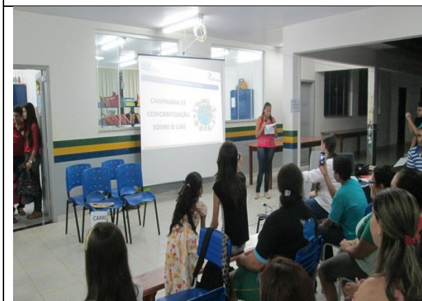
Foto 17-Encenação peça teatral sobre a temática “lixo” - EM Maria Quitéria –Paranaíta- 09/12/14.