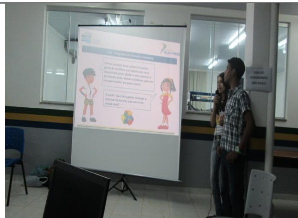
Foto 22 - Apresentação realizada pelos alunos - EM Maria Quitéria –Paranaíta- 09/12/14