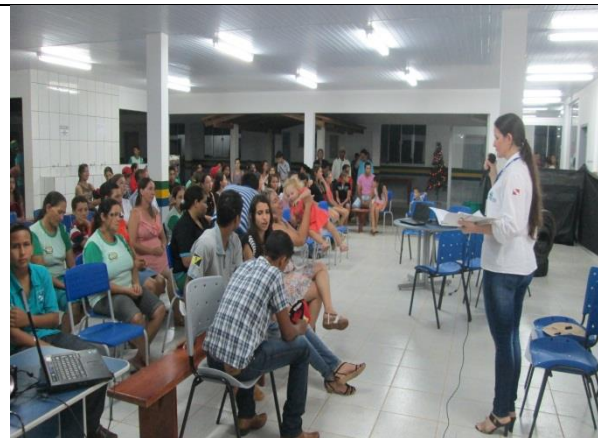
Foto 16 - Lançamento da Campanha de conscientização sobre o Lixo “Dia da Conquista” EM Maria Quitéria-Paranaíta- 09/12/14.