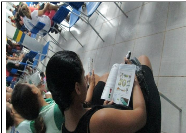
Foto 21- Entrega de Folder da Campanha de "Conscientização sobre o Lixo" - EM Maria Quitéria – Paranaíta- 09/12/14