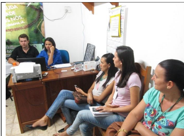
Foto 01 – Reunião de acompanhamento e monitoramento – GT_Paranaíta – 03/07/14