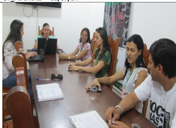
Foto 06 - Reunião de acompanhamento e monitoramento – GT_Paranaíta – 17/07/14