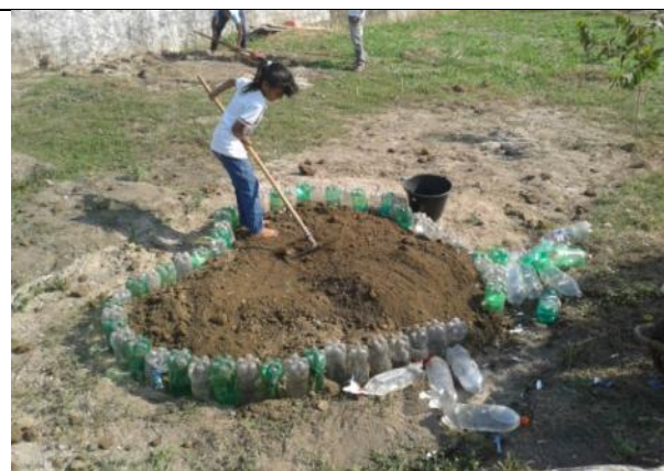
Foto 02- Acompanhamento do Projeto Plantando Esperança – confecção de canteiros 07/08/14