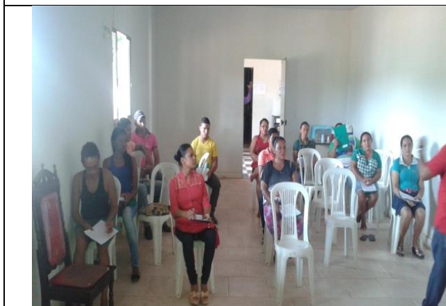
Foto 15 – Aula teórica do curso de Olericultura. Jacareacanga – 27/10/14