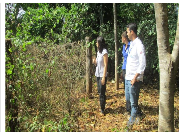
Foto 07 – Reunião de acompanhamento e monitoramento das atividades – GT-4– EM Aluizio de Azevedo - 16/07/14