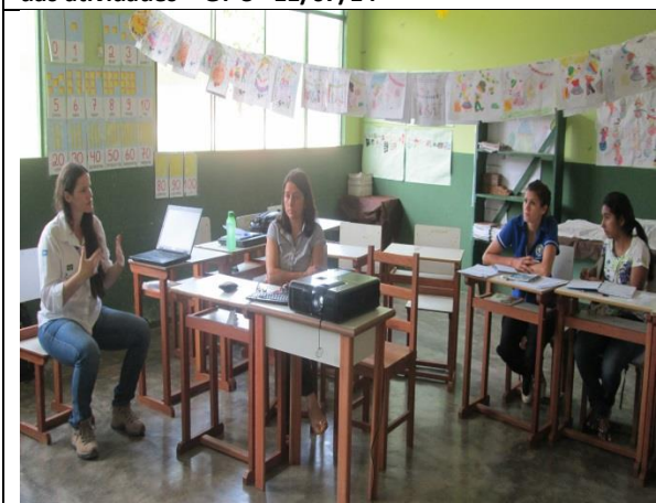
Foto 05 – Reunião de acompanhamento e monitoramento das atividades – GT-4– EM Aluizio de Azevedo - 16/07/14