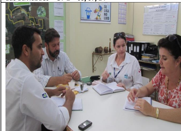
Foto 03 – Reunião de acompanhamento e monitoramento das atividades – GT-3– 11/07/14