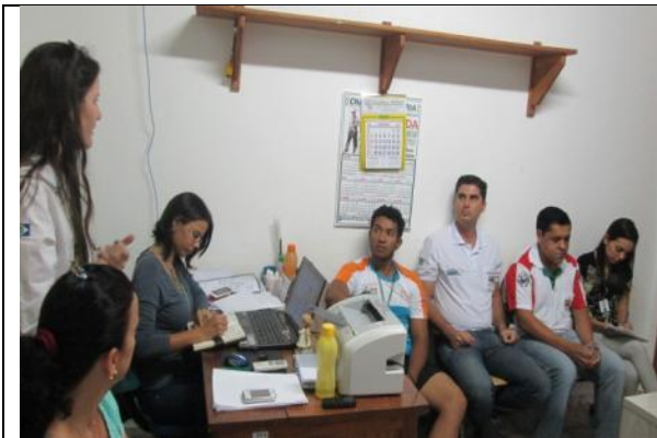
Foto 07 – Reunião de acompanhamento e monitoramento – GT_Paranaíta – 05/08/14