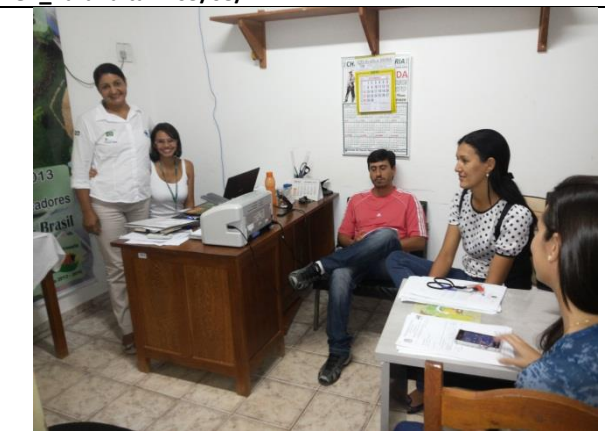
Foto 10 - Acompanhamento GT Prefeitura- Paranaíta 18/09/2014