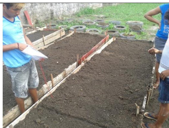
Foto 08- Conclusão dos canteiros no CRAS e semeadura de coentro. 01 a 24/09