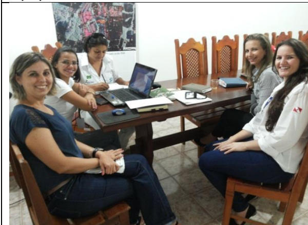
Foto 11 – Reunião de acompanhamento e monitoramento – GT_ Prefeitura Paranaíta – 02/20/14