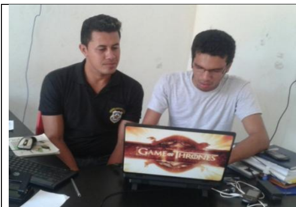
Foto 01- Reunião de acompanhamento e monitoramento – PEA – Sec. Mun. Ass. Social – 25/08/14