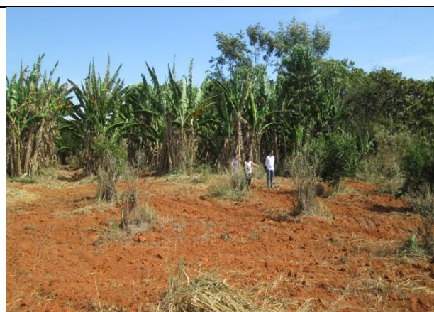
Foto 08 – Reunião de acompanhamento e monitoramento das atividades – GT-4– EM Aluizio de Azevedo - 16/07/14