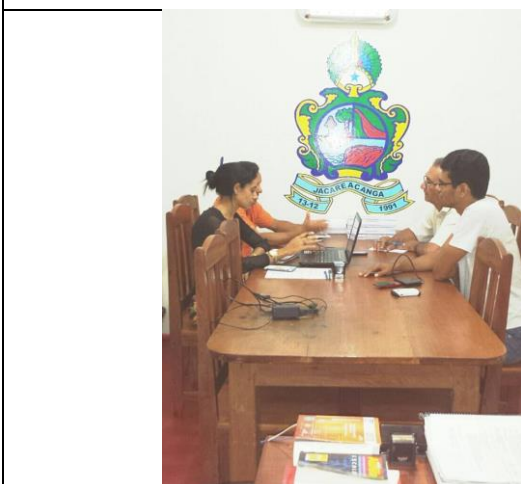
Foto 11- Reunião no gabinete da Camara Municipal, para tratar sobre as novas ações do projeto horta. 25/09