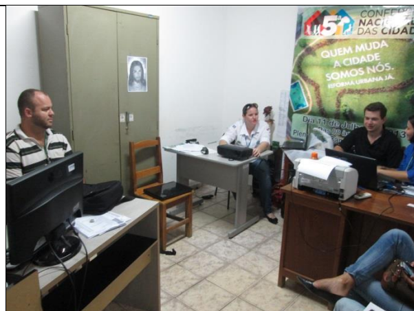
Foto 02- Reunião de acompanhamento e monitoramento – GT_Paranaíta – 03/07/14