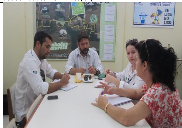
Foto 04 – Reunião de acompanhamento e monitoramento das atividades – GT-3– 11/07/14