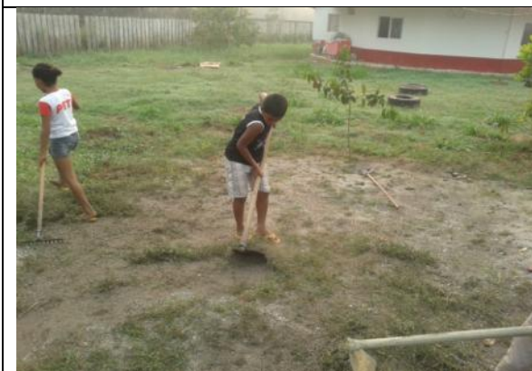
Foto 03- Acompanhamento do Projeto Plantando Esperança – preparo da área onde será alocada a horta 04/08/14