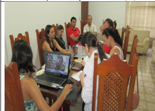
Foto 17 – Reunião de acompanhamento e monitoramento – GT_ Prefeitura Paranaíta – 06/11/14