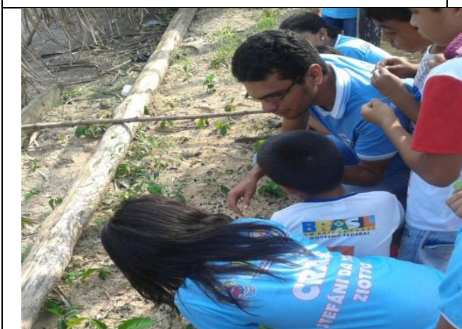
Foto 09- Visita ao viveiro municipal, demonstração da utilização da sementeira. 29/09