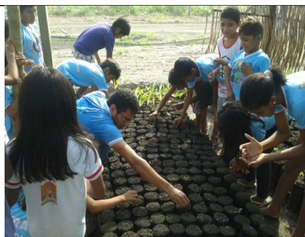
Foto 10- Realização de monda e plantio de guaraná. 29/09