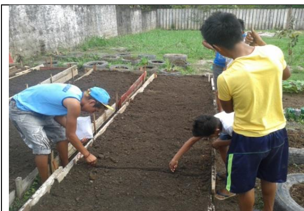
Foto 07- Conclusão dos canteiros no CRAS e semeadura de coentro. 01 a 24/09