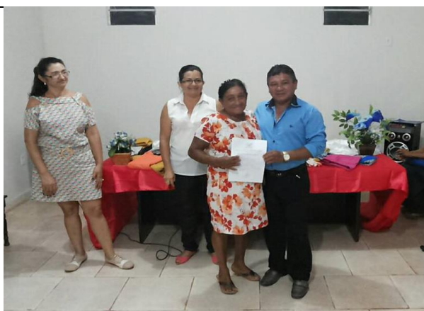
Foto 12- Entrega dos certificados do Curso de Ateliê. - Jacareacanga - 10/10/14