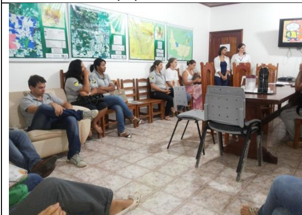
Foto 15 – Reunião com GT Prefeitura de Paranaíta e Conselho Municipal de Educação Paranaíta – 22/10/14