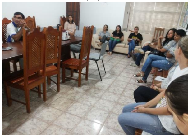
Foto 16 – Reunião com GT Prefeitura de Paranaíta e Conselho Municipal de Educação Paranaíta – 22/10/14