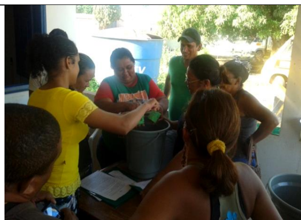
Foto 14 – Alunos do curso de Olericultura fazendo repelente orgânico à base de sabão. Jacareacanga – 28/10/14