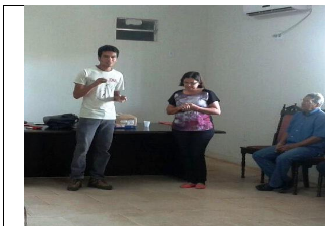
Foto 13 – Encerramento do Curso de Associativismo, Jacareacanga – 18/10/14