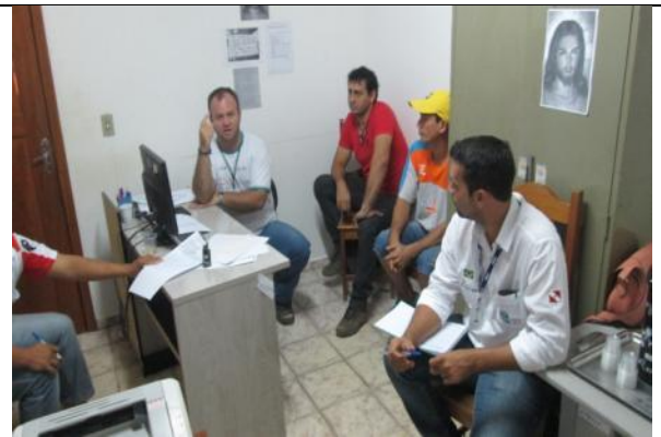
Foto 08 – Reunião de acompanhamento e monitoramento – GT_Paranaíta – 05/08/14