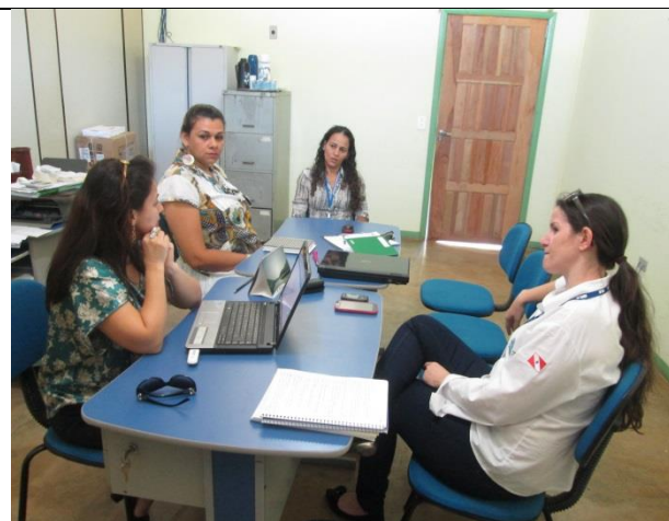
Foto 02 – Reunião de acompanhamento e monitoramento das atividades – GT-2 – 09/07/14