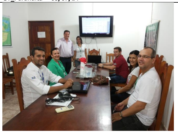
Foto 04– Reunião de acompanhamento e monitoramento – GT_Paranaíta – 10/07/14