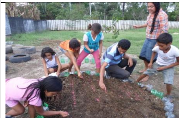
Foto 05- Acompanhamento do Projeto Plantando Esperança – sementeira de coentro 25/08/14