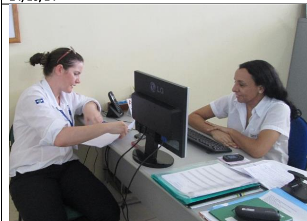
Foto 11 – Visita a Secretaria Municipal de Turismo de Alta Floresta para verificar andamento GT-3 - Alta Floresta – 29/10/14