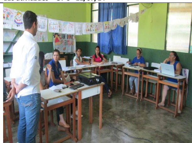
Foto 06 – Reunião de acompanhamento e monitoramento das atividades – GT-4– EM Aluizio de Azevedo - 16/07/14