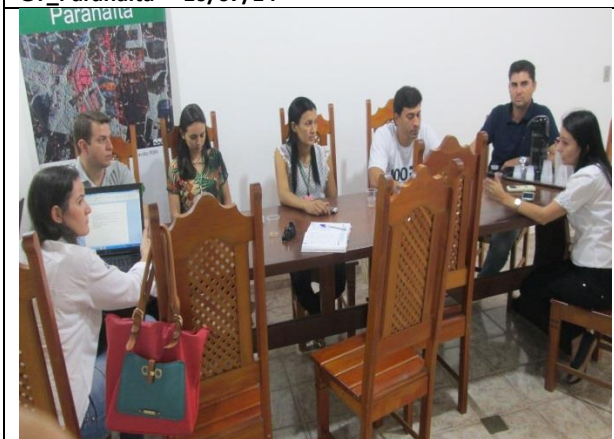
Foto 05 - Reunião de acompanhamento e monitoramento – GT_Paranaíta – 17/07/14