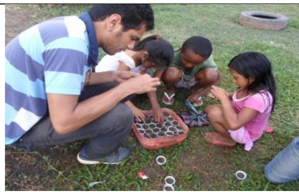
Foto 06- Acompanhamento do Projeto Plantando Esperança – sementeira do alface 25/08/14