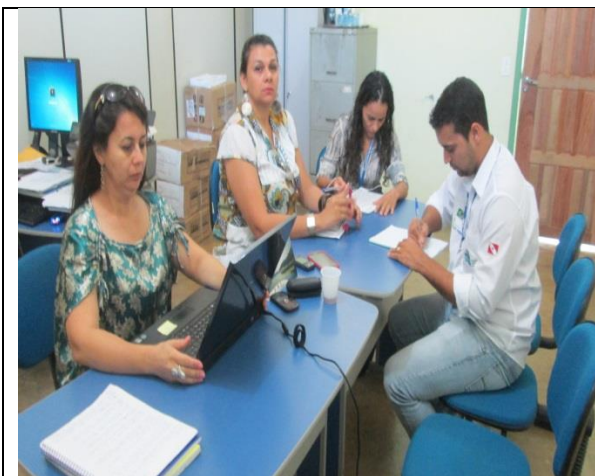
Foto 01 – Reunião de acompanhamento e monitoramento das atividades – GT-2 – 09/07/14