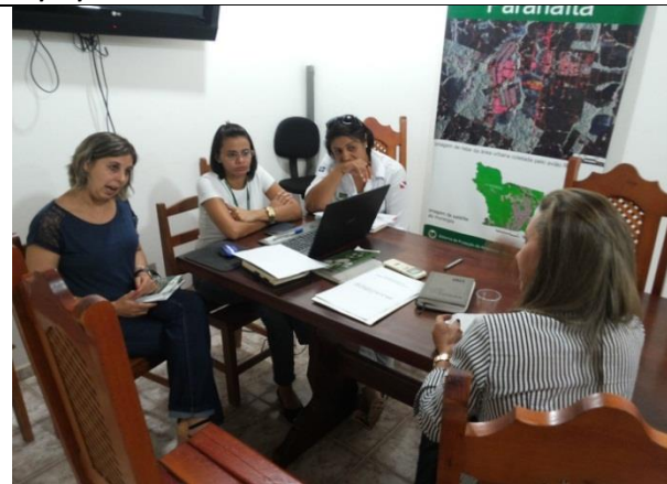
Foto 12 – Reunião de acompanhamento e monitoramento – GT_ Prefeitura Paranaíta – 02/20/14