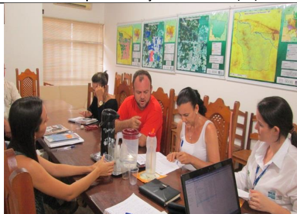
Foto 18 – Reunião de acompanhamento e monitoramento – GT_ Prefeitura Paranaíta – 06/11/14