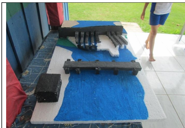
Foto 1 – Acompanhamento Escola Municipal Getúlio Vargas “B” – maquete prévia - 22/10/13 – Paranaíta/MT