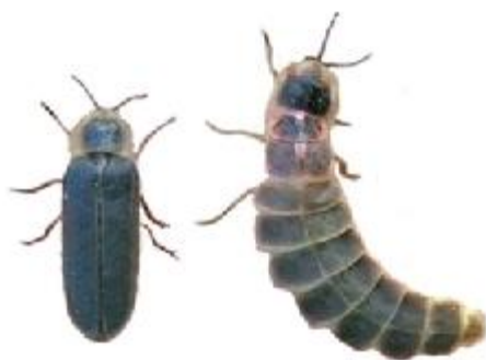
macho e fêmea

Características = conhecido também por pirilampo, o macho mede em torno de 10 mm de comprimento e a fêmea, entre 12 a 20 mm. O macho tem duas asas e élitros. Com seu corpo frágil, cor de terra, a fêmea do vaga-lume pode somente arrastar-se no chão. Para compensar a falta de asas, desenvolveu-se algo muito especial durante a evolução do vaga-lume: pequenas glândulas que segregam luciferina, uma substância que em determinadas condições se torna luminescente. A luz verde é o sinal para que o macho interrompa seu balé aéreo e venha juntar-se à fêmea. Essa diferenciação tão marcada entre os sexos é rara entre os coleópteros. A espécie Lampyris noctiluca é a mais comum no Brasil. Sua larva luminescente é muito parecida com a fêmea adulta. Uma molécula de luciferina é oxidada por oxigênio, em presença de trifosfato de adenosina ,