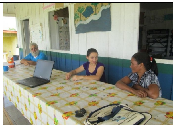
Foto 2 – Acompanhamento Escola Municipal Getúlio Vargas “B” – 22/10/13 – Paranaíta/MT