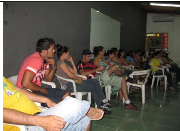
Foto 2 - Docentes participantes do curso