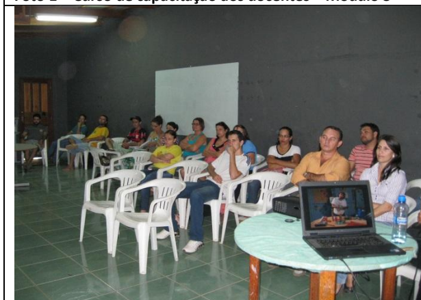
Foto 3 – Apresentação de vídeo sobre reuso de materiais para confecção de instrumentos musicais