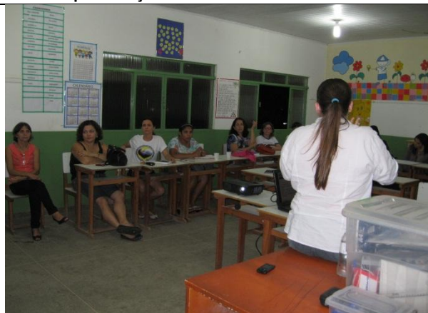
Foto 6 - Debates a respeito do tema