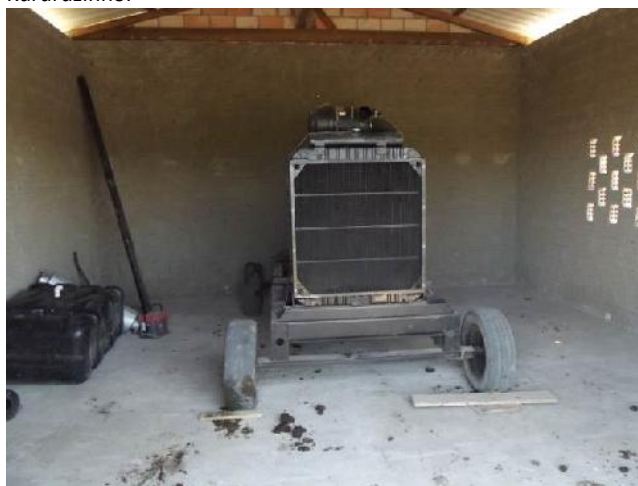
Figura 06: Detalhes do gerador no local definitivo