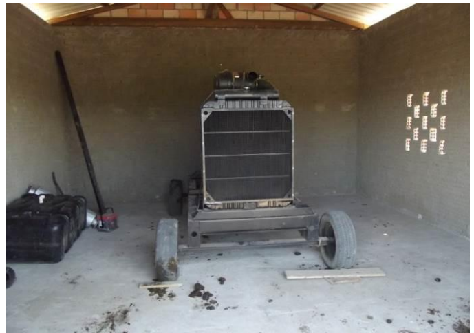
Figura 06: Detalhes do gerador no local definitivo