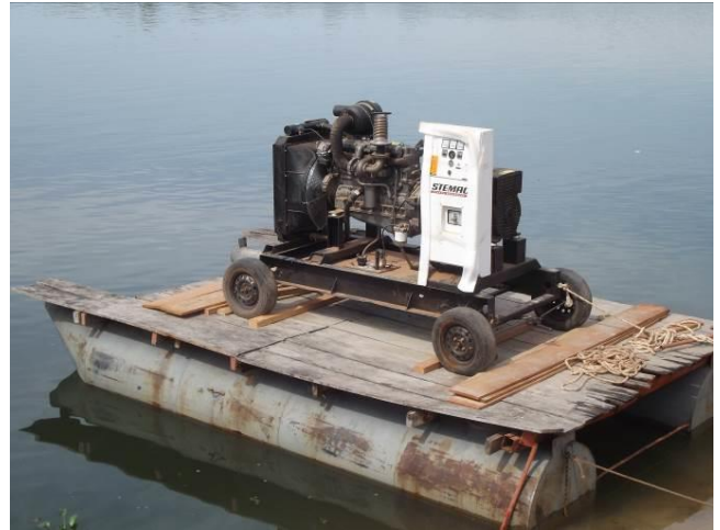
Figura 04: Logística entrega gerador de energia Aldeia Kururuzinho.