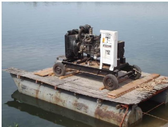
Figura 04: Logística entrega gerador de energia Aldeia Kururuzinho.