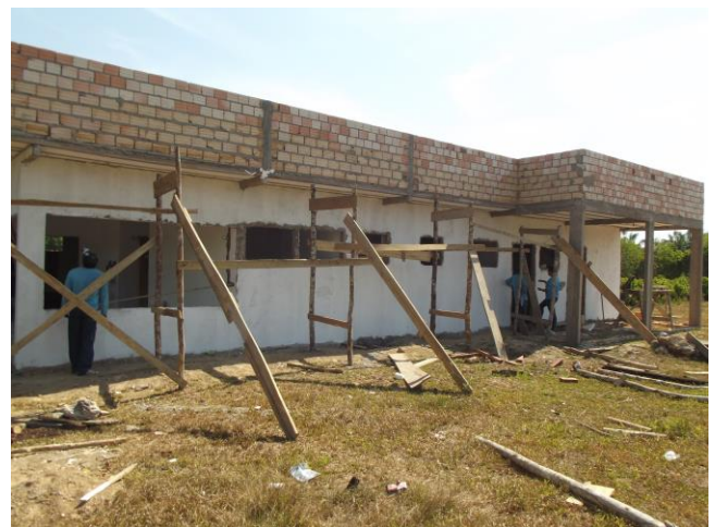
Figura 02: Obra do Posto de Saúde