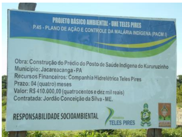
Figura 01: Placa com informações da Obra