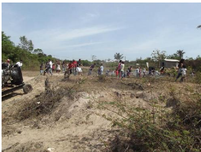
Figura 05: Indígenas colaborando com transporte do gerador