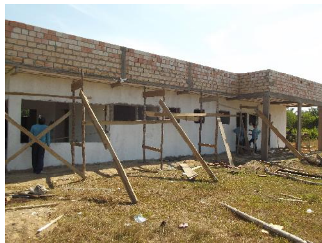
Figura 02: Obra do Posto de Saúde