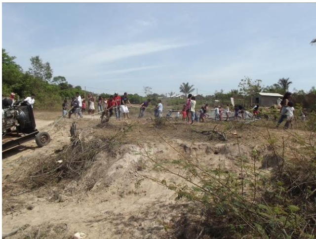
Figura 05: Indígenas colaborando com transporte do gerador