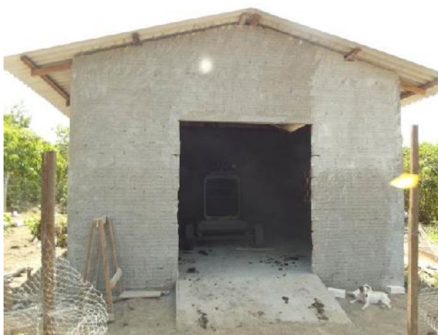
Figura 07: Gerador no interior do galpão construído para protegê-lo