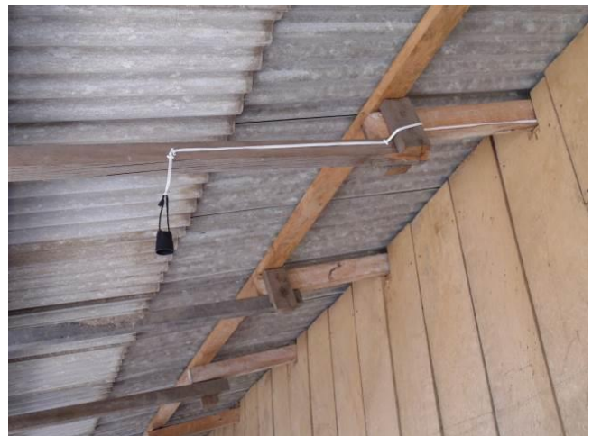
Figura 08: Instalação elétrica nas residências