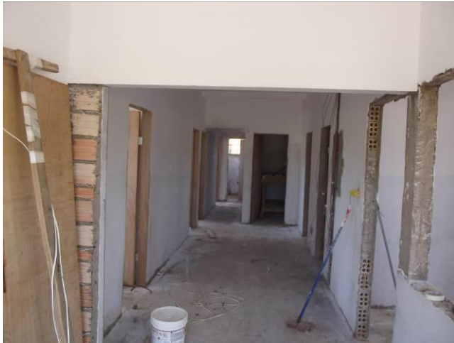
Figura 03: Detalhe das obras no interior do posto de saúde