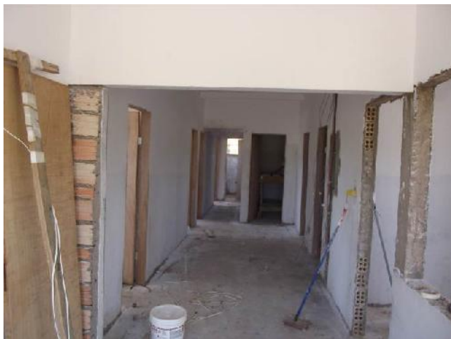
Figura 03: Detalhe das obras no interior do posto de saúde