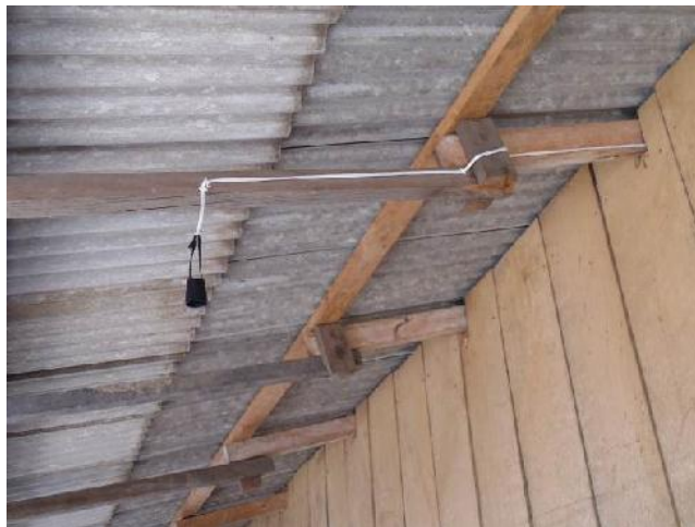
Figura 08: Instalação elétrica nas residências