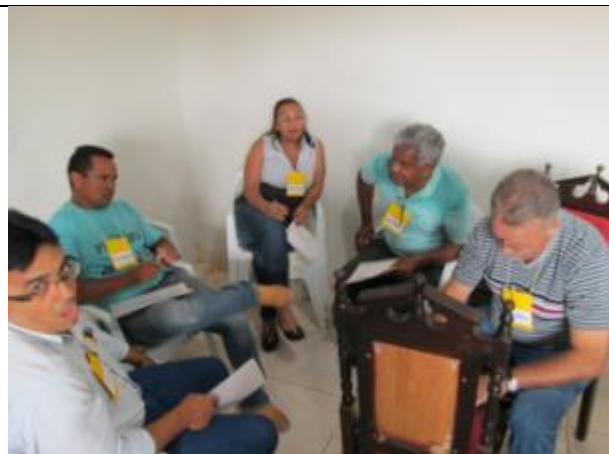
Foto 5 – Atividade em grupo: levantamento de barreiras e deficiências da Gestão Pública - Módulo 2