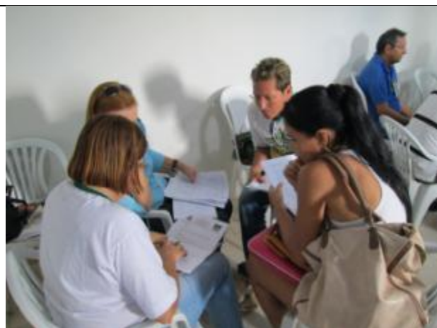
Foto 9 – Atividade de elaboração de projeto seguindo roteiro WALM - Módulo 3