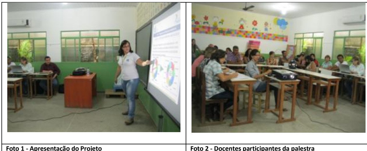
Foto 1 - Apresentação do Projeto