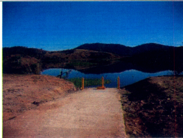
Foto 5: Vista da barreira executada para impedir o acesso à rampa executada por FURNAS.