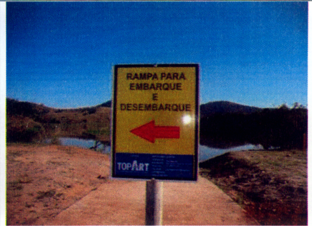
Foto 6: Vista da placa indicativa para a rampa de embarque e desembarque.