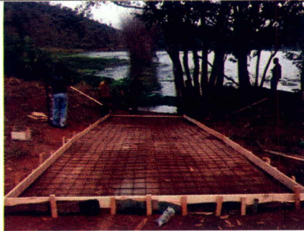
Foto 1: Vista da execução da melhoria da rampa executada pelos usuários.