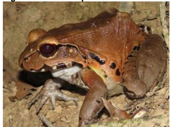
Figura 1-10: Leptodactylus pentadactylus .