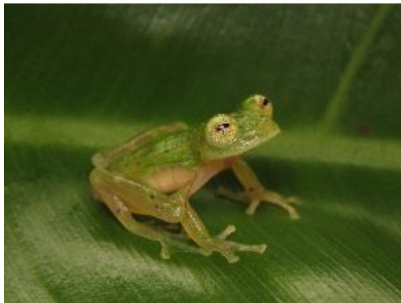
Figura 1-1: Hyalinobatrachium munozorum (vista de perfil).