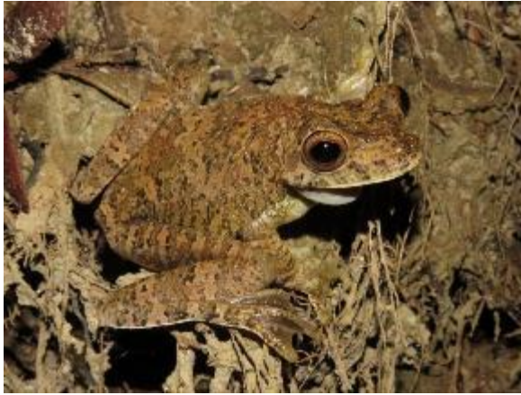
Figura 1-7: Hypsiboas boans .