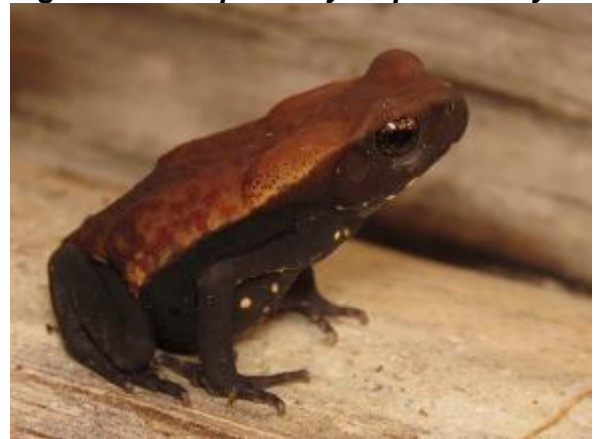
Figura 1-12: Rhaebo guttatus .