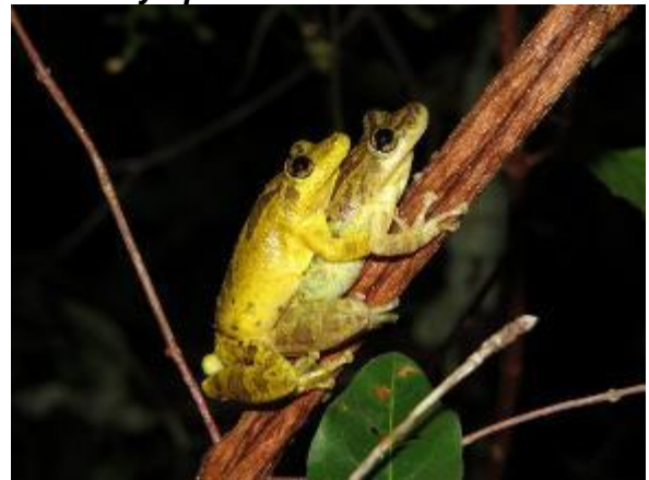
Figura 1-30: Scinax fuscovarius .