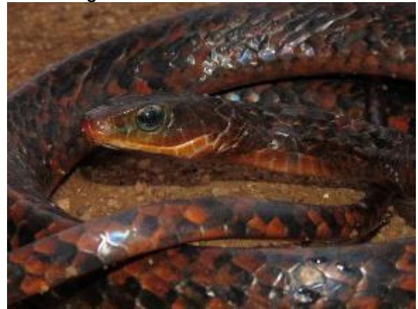
Figura 1-32: Chironius scurrulus .