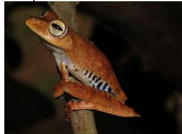
Figura 1-22: Hypsiboas calcaratus .