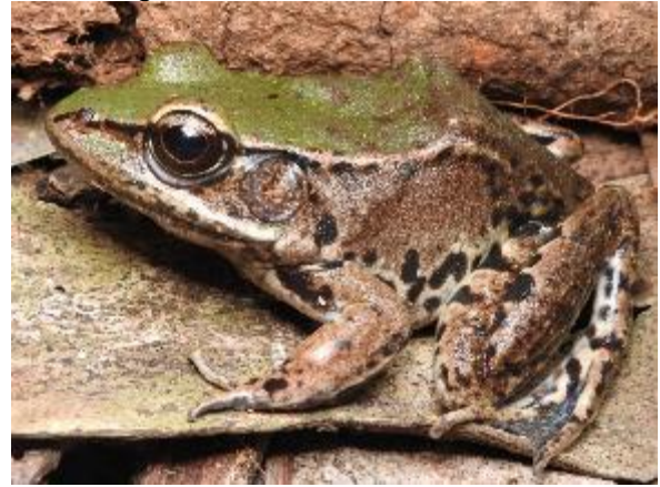
Figura 1-26: Lithobates palmipes .