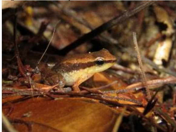
Figura 1-5: Allobates aff. brunneus .