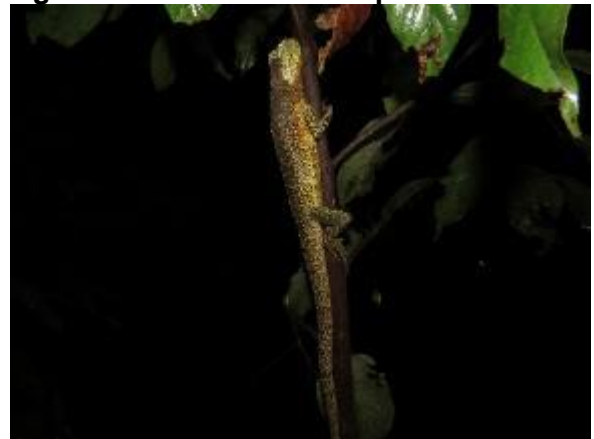
Figura 1-36: Uranoscodon superciliosus .