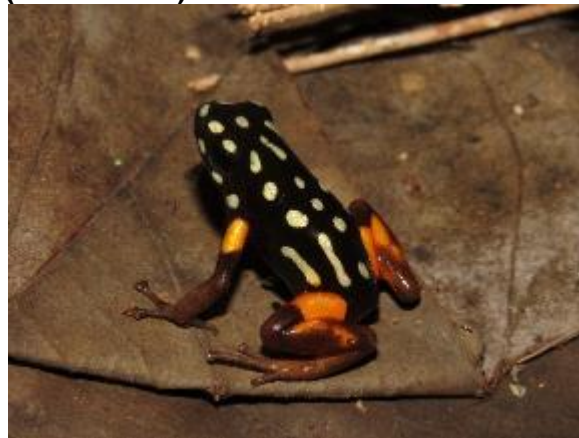
Figura: 1-21: Adelphobates castaneoticus .