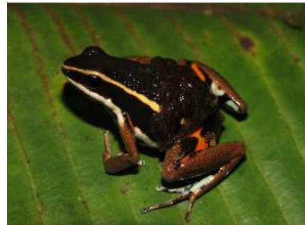
Figura 1-24: Ameerega sp. Macho transportando girinos.