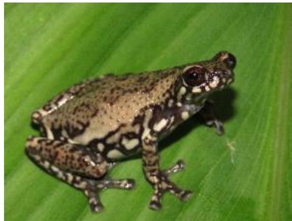
Figura 1-23: Allophryne ruthveni .