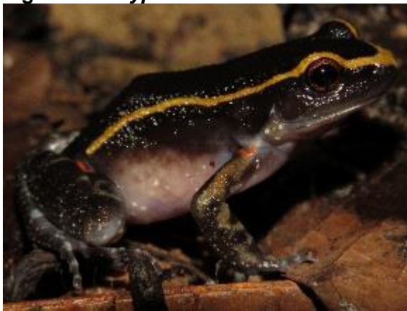
Figura 1-9: Lithodytes lineatus .