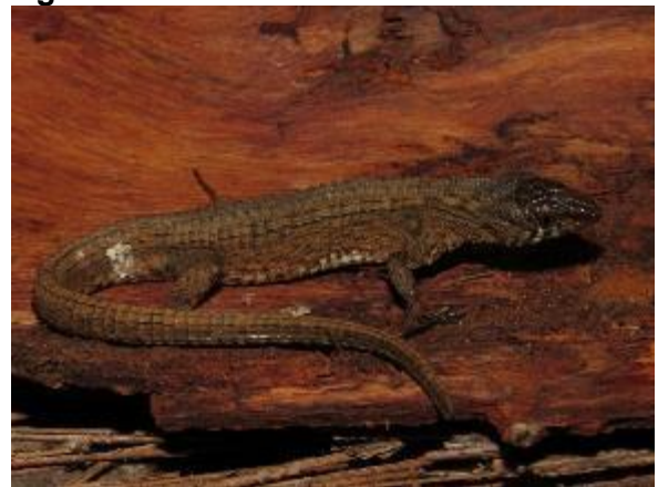
Figura 1-34: Neusticurus sp.