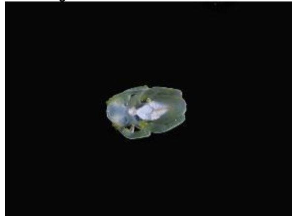
Figura 1-20: Hyalinobatrachium sp. (vista ventral).