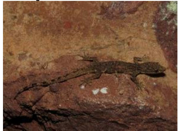
Figura 1-14: Gonatodes humeralis .