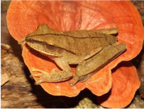
Figura 1-25: Hypsiboas leucocheilus .