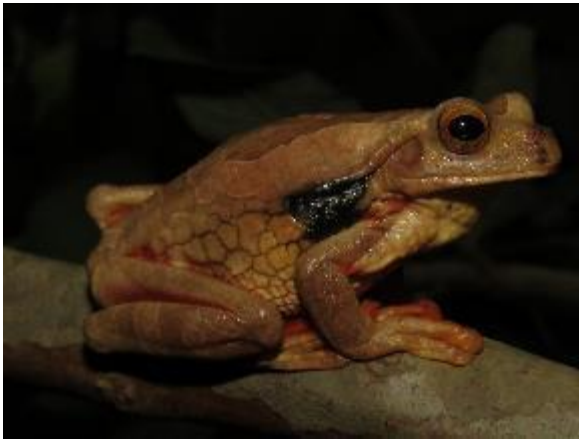
Figura 1-31: Trachycephalus coriaceus .