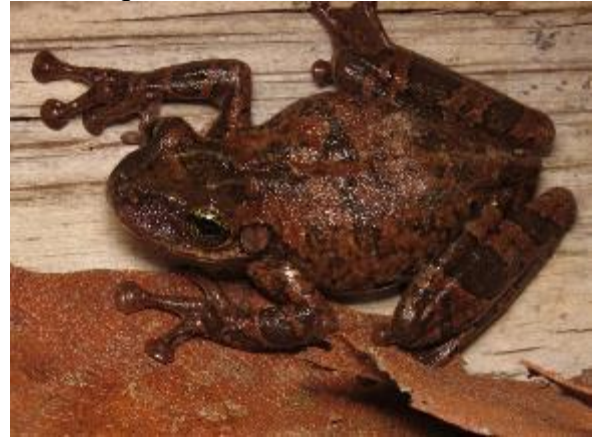
Figura 1-8: Osteocephalus taurinus .