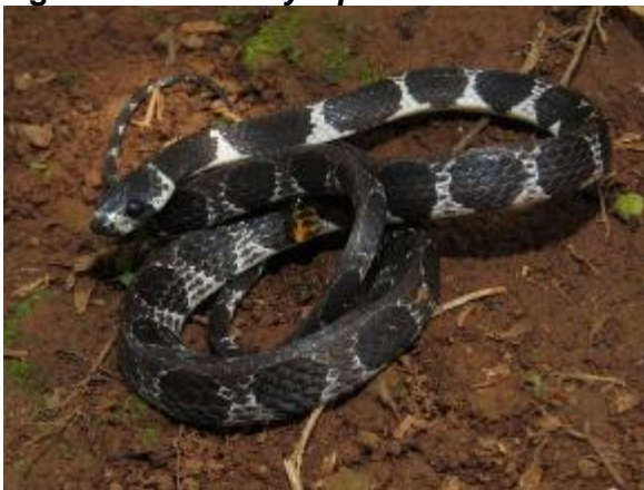
Figura 1-33: Dipsas catesbyi .