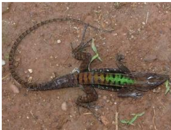
Figura 1-15: Kentropyx calcarata .