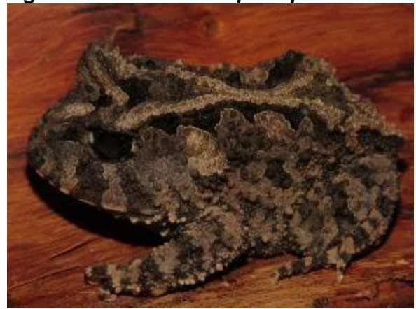
Figura 1-28: Proceratophrys concavitympanum .