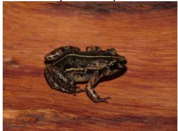
Figura 1-4: Adenomera andreae .