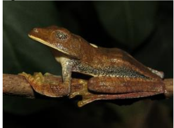
Figura 1-6: Hypsiboas aff. semilineatus 3.