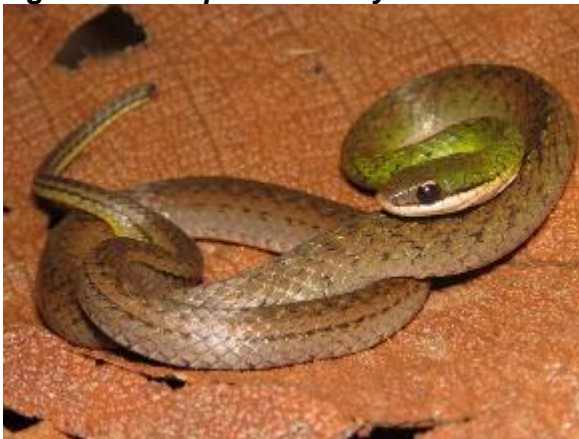
Figura 1-35: Erythrolamprus reginae .