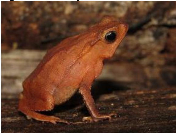
Figura 1-11: Rhinella castaneotica .