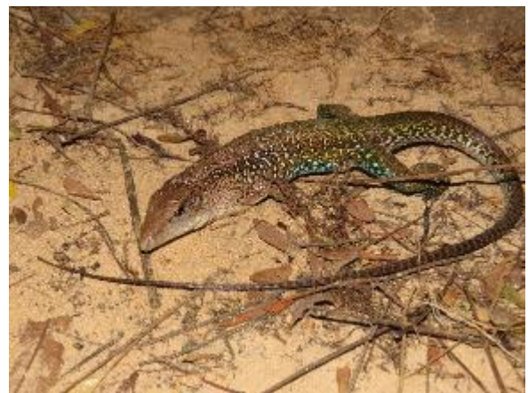
Figura 1-16: Ameiva ameiva .