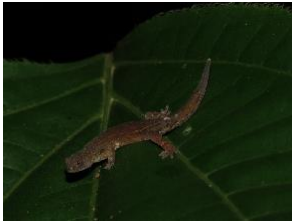
Figura 1-13: Chatogekko amazonicus .