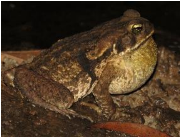
Figura 1-29: Rhinella marina .