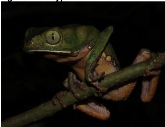
Figura 1-27: Phyllomedusa vaillantii .