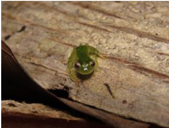
Figura 1-19: Hyalinobatrachium sp. (vista dorsal).