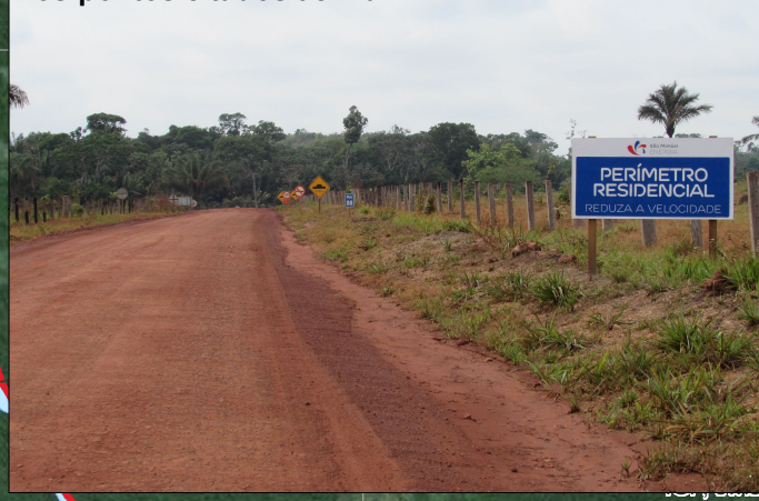
Modelo de placa de perímetro urbano localizado nos pontos citados acima.